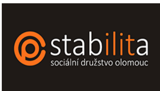
Obrázek č. 1 – logo sociálního družstva STABILITA Olomouc

zdroj: http:// www.stabilita-olomouc.cz/images-logo 14. 4. 2014