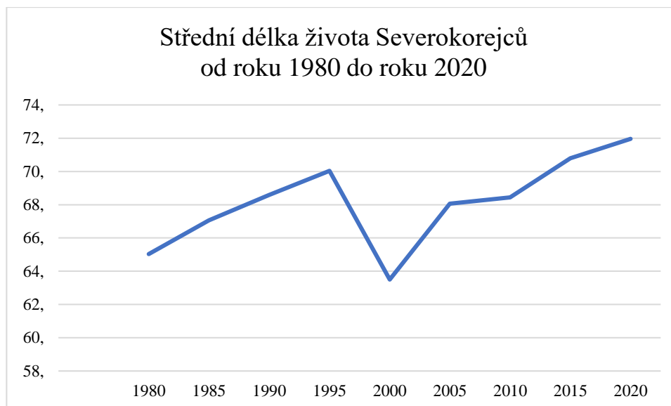
Graf 3: Střední délka života Severokorejců od roku 1980 do roku 2020

V roce 2008 bylo po 15 letech provedeno v KLDŘ sčítání obyvatel. Z dostupných dat bylo možné zjistit, že hladomor měl vliv na snížení střední délky života Severokorejců. 176 „Úmrtnost v roce 2008 byla u mužů a žen ve věku 10–39 let (kteří prožili své dětství a dospívání v 90. letech) a u žen ve věku 40–49 let (které byly v 90. letech v plodném věku) více než dvakrát vyšší než příslušné míry úmrtnosti v roce 1993.“ 177 (Bahk, Ezzati a Khang, 2018, str. 833)