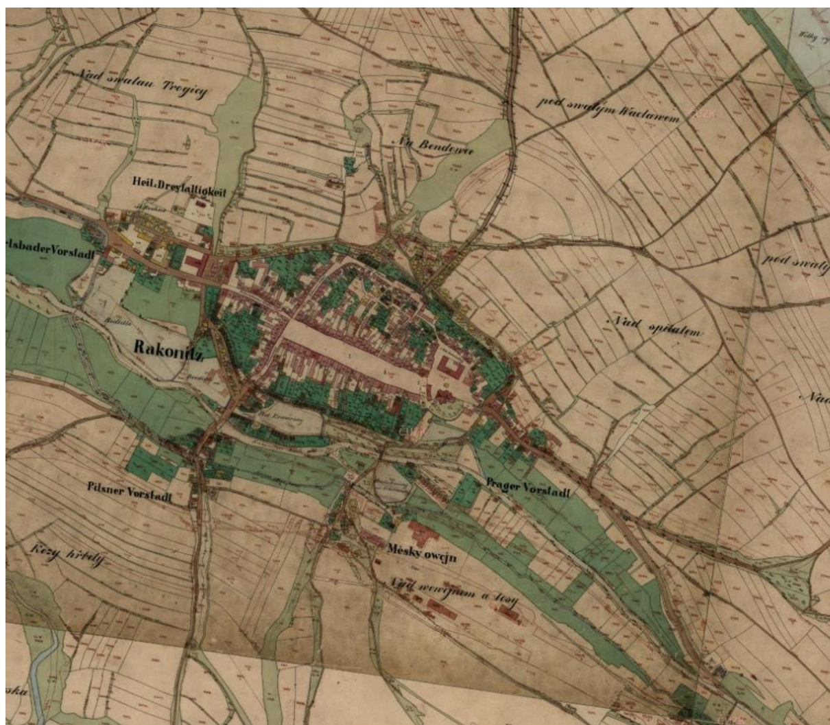
Mapa č.2: Rakovník na mapě stabilního katastru 271