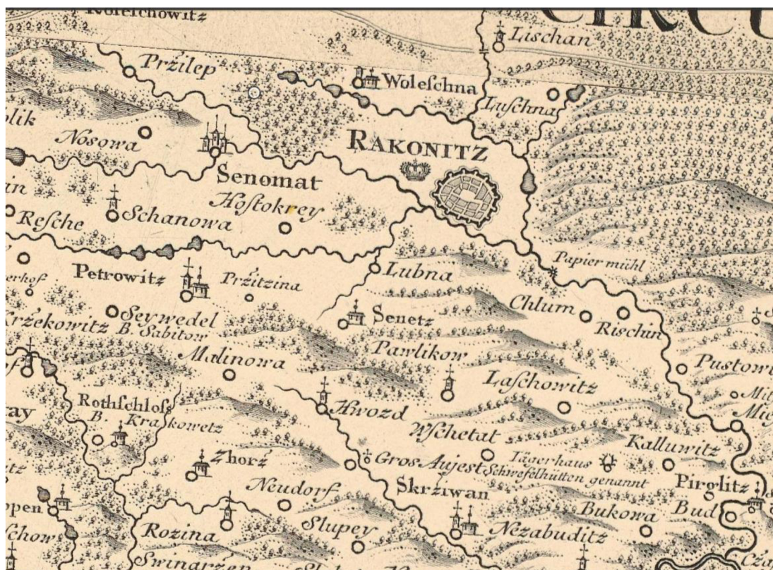
Mapa č. 1: Rakovník s okolím na Müllerově mapě Čech z roku 1720 61

válce se změnila tvář města zejména díky výstavbě panelových sídlišť. Historické jádro města tvoří dnes městskou památkovou zónu. 60