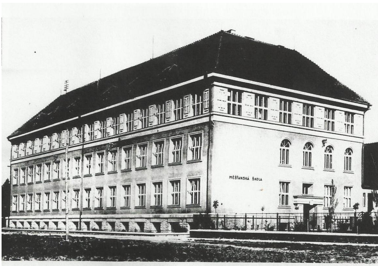
Příloha č. 7