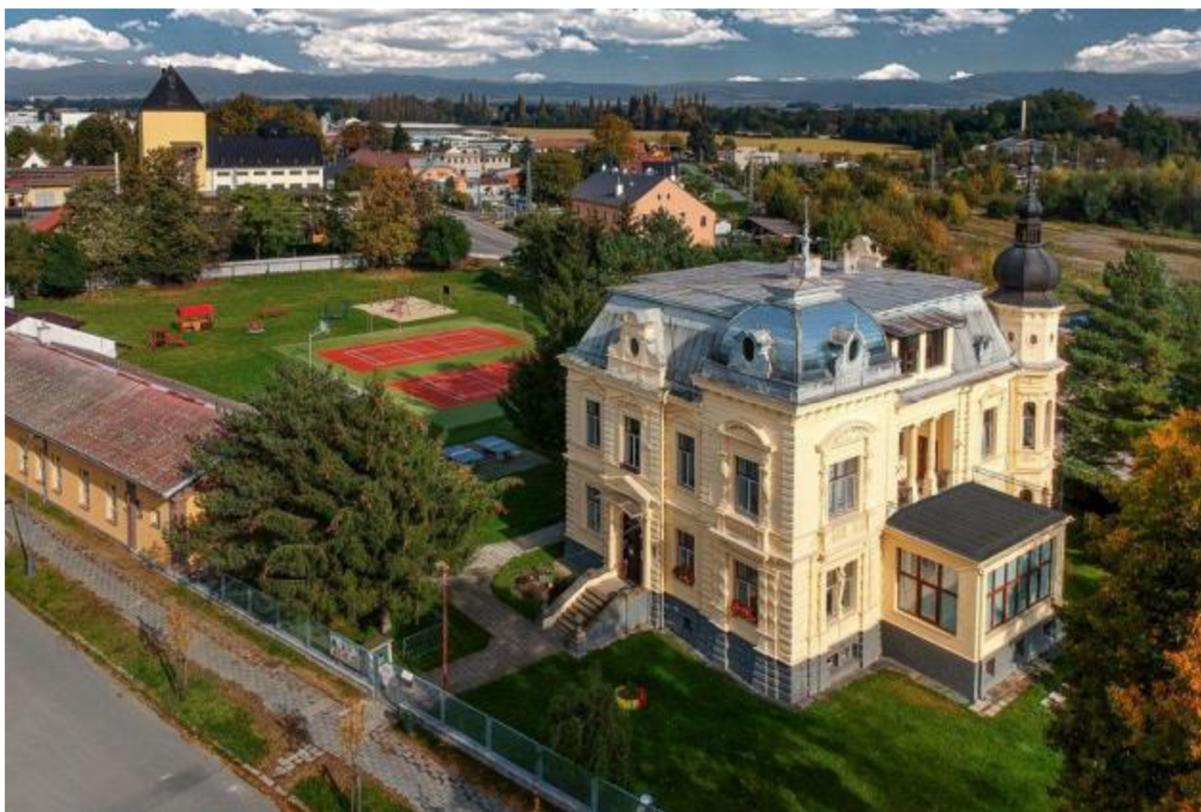
Obrázek 1: Hlavní budova organizace (DDM Uničov Vila Tereza, 2023)