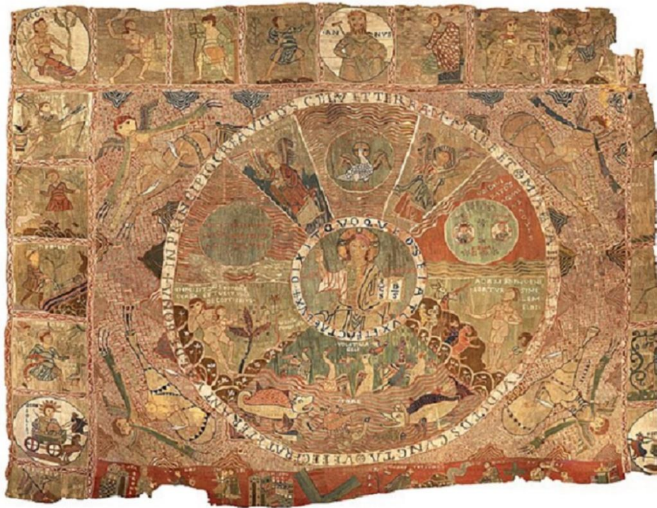
Obr. 5 – Stvoření světa, 11. st. po Kr., tapiserie, katedrála Panny Marie, Gironna, Španělsko.