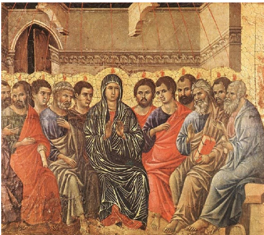
Obr. 7 – Duccio di Buoninsegna, Sestoupení Ducha svatého, 13.-14. st. po Kr., kostel svatého Jana, Mechelen, Belgie.