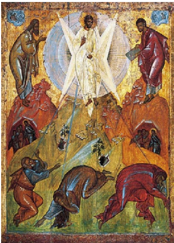
Obr. 8 – Theofán řecký, Proměnění Páně, cca 1400 po Kr., ikona