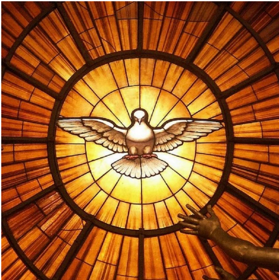
Obr. 11 – Gian Lorenzo Bernini, Duch svatý v podobě holubice, cca 1660 po Kr., alabastrová vitráž, Trůn svatého Petra, Bazilika svatého Petra, Vatikán.