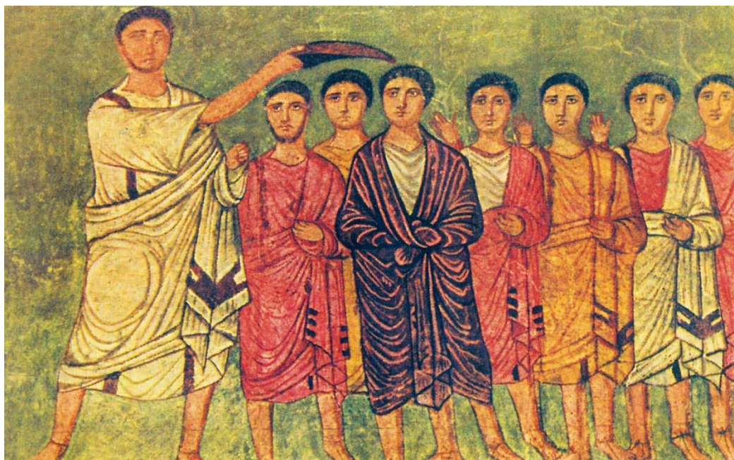
Obr. 1 – David pomazán na krále prorokem Samuelem, cca 230 po Kr., freska, synagoga v Dura Europos, Sýrie.