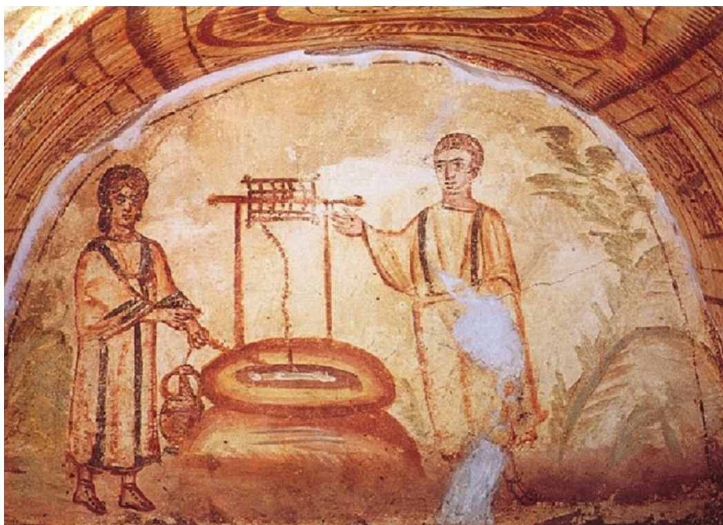
Obr. 2 – Ježíš a Samaritánka u Jákobovy studny, 4. st. po Kr., freska, katakomby na Vía Latina, Řím, Itálie.