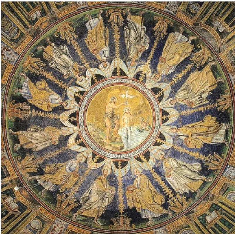
Obr. 4 – Křest Krista v Jordánu, 5. st. po Kr., mozaika, Baptisterium ortodoxních, Ravenna, Itálie.