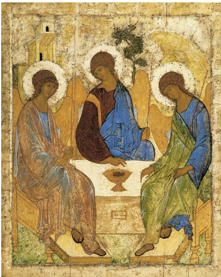
Obr. 9 – Andrej Rublev, Návštěva u Abraháma (Ikona nejsvětější Trojice), 1410, Tret'jakovská galerie, Moskva.