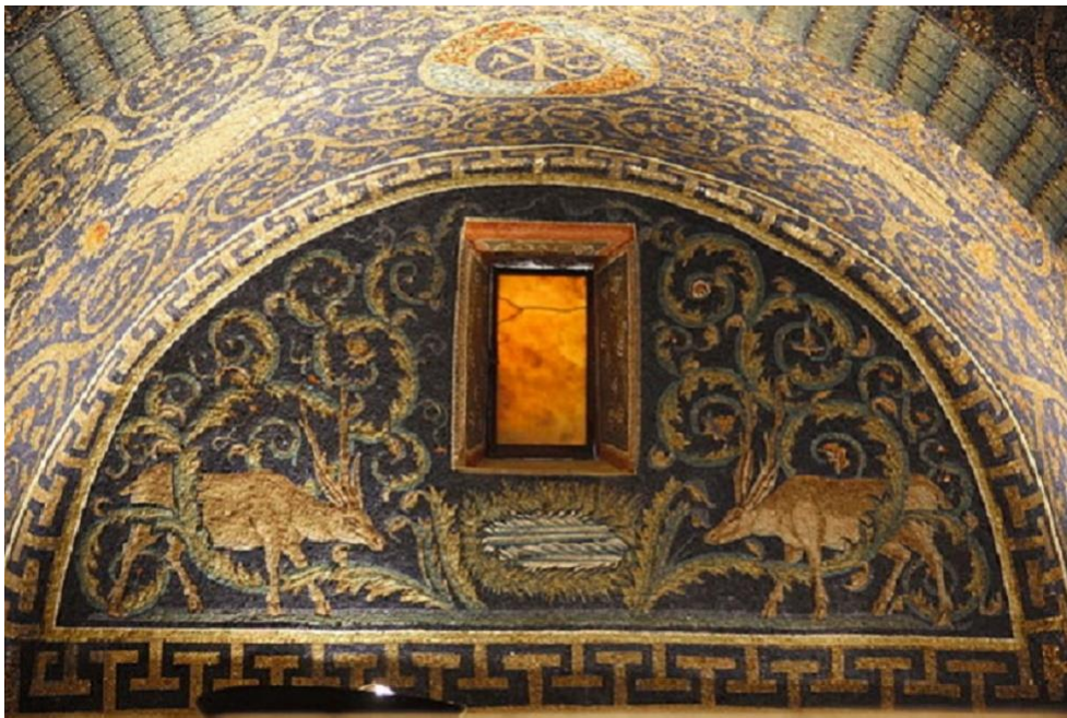
Obr. 3 – Jeleni u pramene, 5. st. po Kr., mozaika, Mauzoleum Gally Placidie, Ravenna, Itálie.