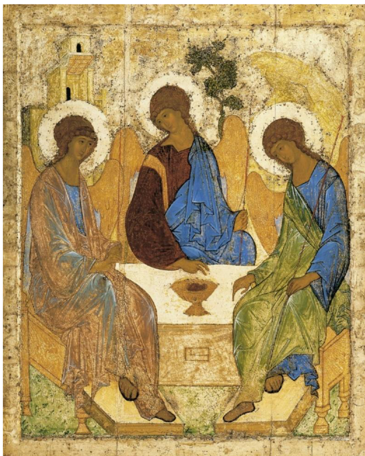
Obr. 9 – Andrej Rublev, Návštěva u Abraháma (Ikona nejsvětější Trojice), 1410, Tretjakovská galerie, Moskva.