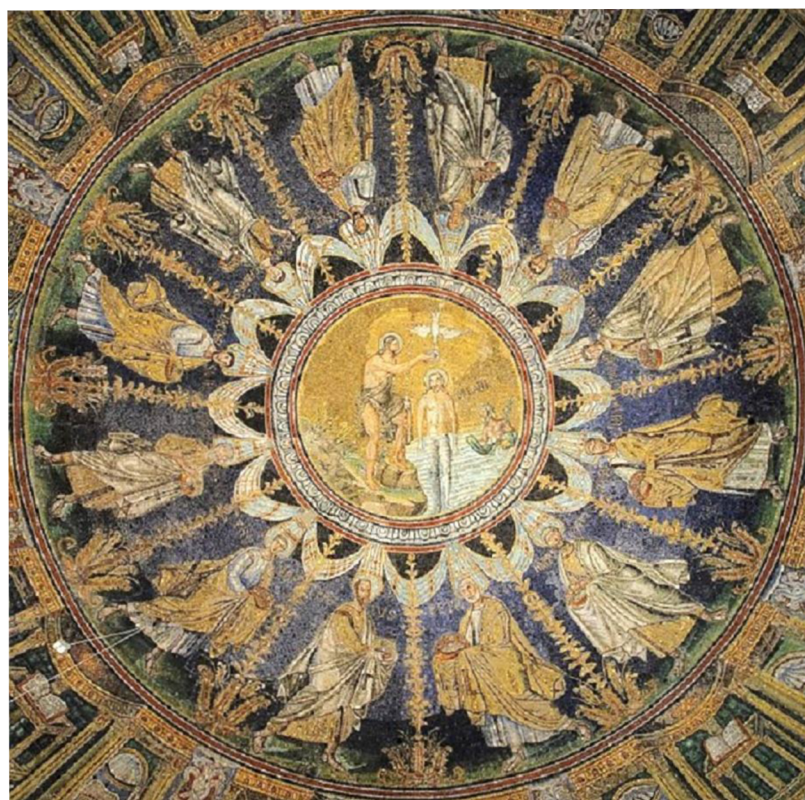
Obr. 4 – Křest Krista v Jordánu, 5. st. po Kr., mozaika, Baptisterium ortodoxních, Ravenna, Itálie.