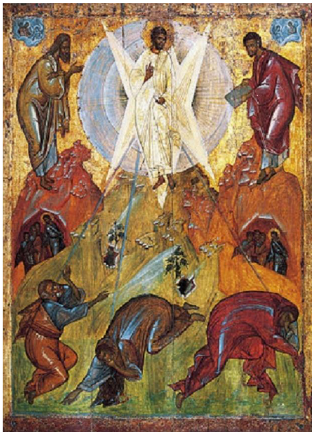
Obr. 8 – Theofán řecký, Proměnění Páně, cca 1400 po Kr., ikona