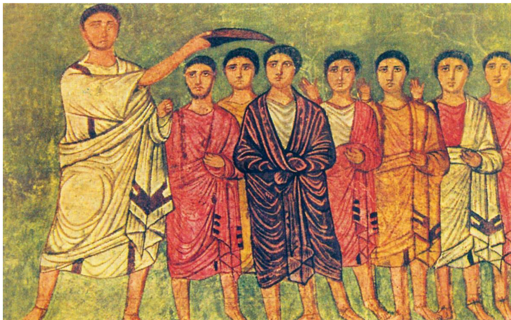
Obr. 1 – David pomazán na krále prorokem Samuelem, cca 230 po Kr., freska, synagoga v Dura Europos, Sýrie.