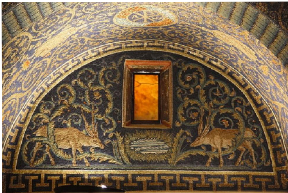
Obr. 3 – Jeleni u pramene, 5. st. po Kr., mozaika, Mauzoleum Gally Placidie, Ravenna, Itálie.