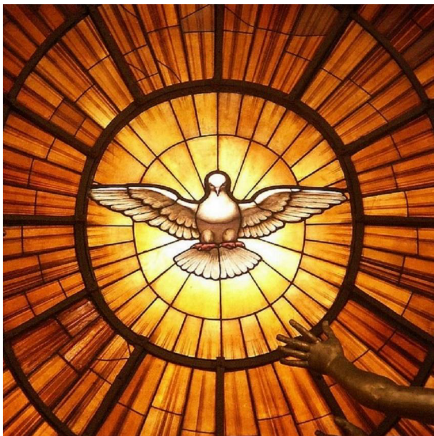
Obr. 11 – Gian Lorenzo Bernini, Duch svatý v podobě holubice, cca 1660 po Kr., alabastrová vitráž, Trůn svatého Petra, Bazilika svatého Petra, Vatikán.