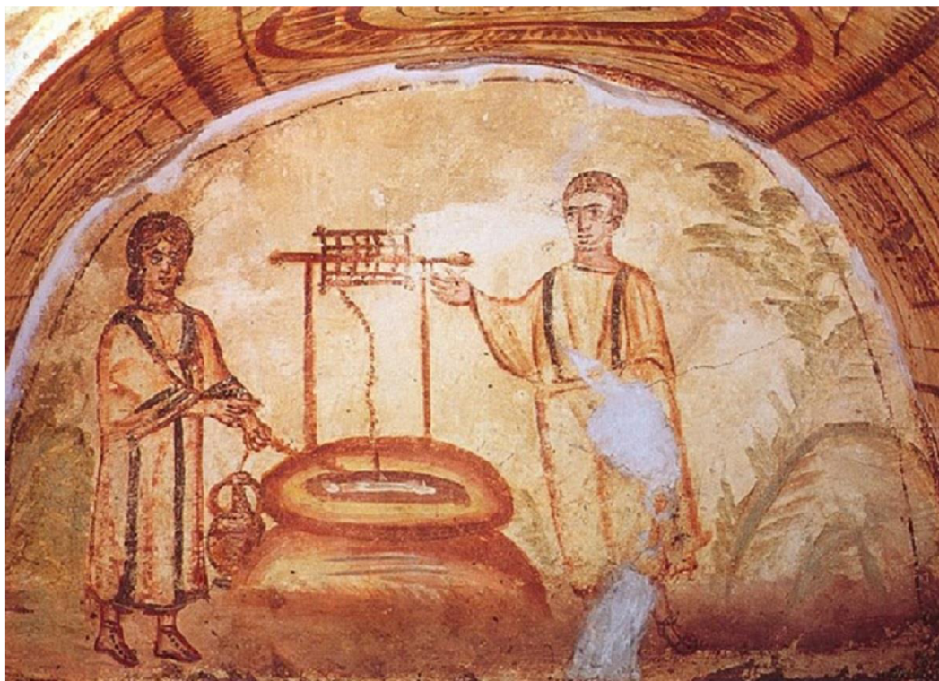
Obr. 2 – Ježíš a Samaritánka u Jákobovy studny, 4. st. po Kr., freska, katakomby na Vía Latina, Řím, Itálie.