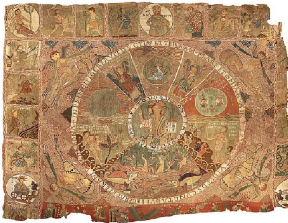
Obr. 5 – Stvoření světa, 11. st. po Kr., tapiserie, katedrála Panny Marie, Gironna, Španělsko.