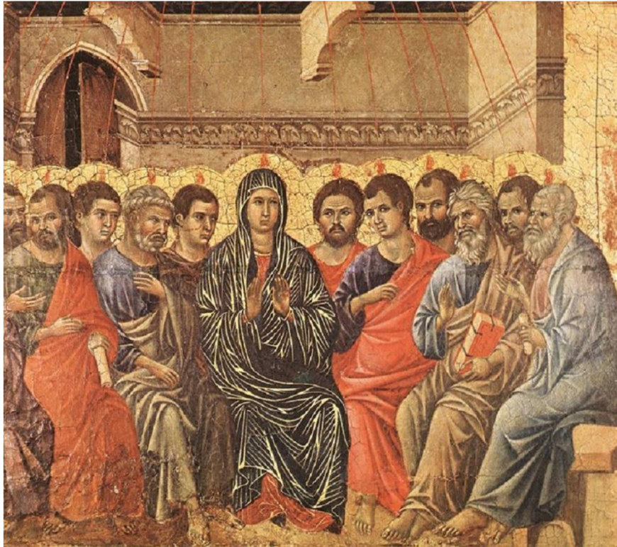
Obr. 7 – Duccio di Buoninsegna, Sestoupení Ducha svatého, 13.-14. st. po Kr., kostel svatého Jana, Mechelen, Belgie.