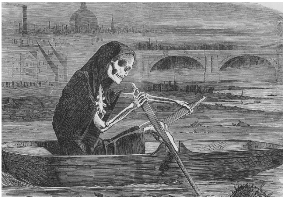
Obr. 1. Tichý loupežník: Řádění smrti na Temži, které si během velkého zápachu vyžádalo životy obětí, jež nezaplatily za vyčištění řeky (Punch Magazine, 1858)

Jako Velká průmyslová revoluce se označuje období asi mezi roky 1760 a 1860, během kterého technologický progres, vzdělání a masivní růst kapitálu transformoval nejdříve Velkou Británii a postupně i zbytek západního světa v industriální velmoci. Revoluce se přirozeně také promítla do životní úrovně obyčejných lidí. Nárůst národního kapitálu se promítl nejen v investicích do veřejné infrastruktury, ale i samotné platy britských dělníků se mezi lety 1760 a 1860 zdvojnásobily. Revoluce také dala vzniknout dvěma novým sociálními vrstvám, a to proletariátu a buržoazii, jež se dělí podle vlastnictví výrobních prostředků. Kvůli tomuto a dalším vedlejším efektům existuje konsensus akademické obce, že se skutečně jedná o jeden z největších mezníků v historii lidstva (Nardinelli a kol., 2018).