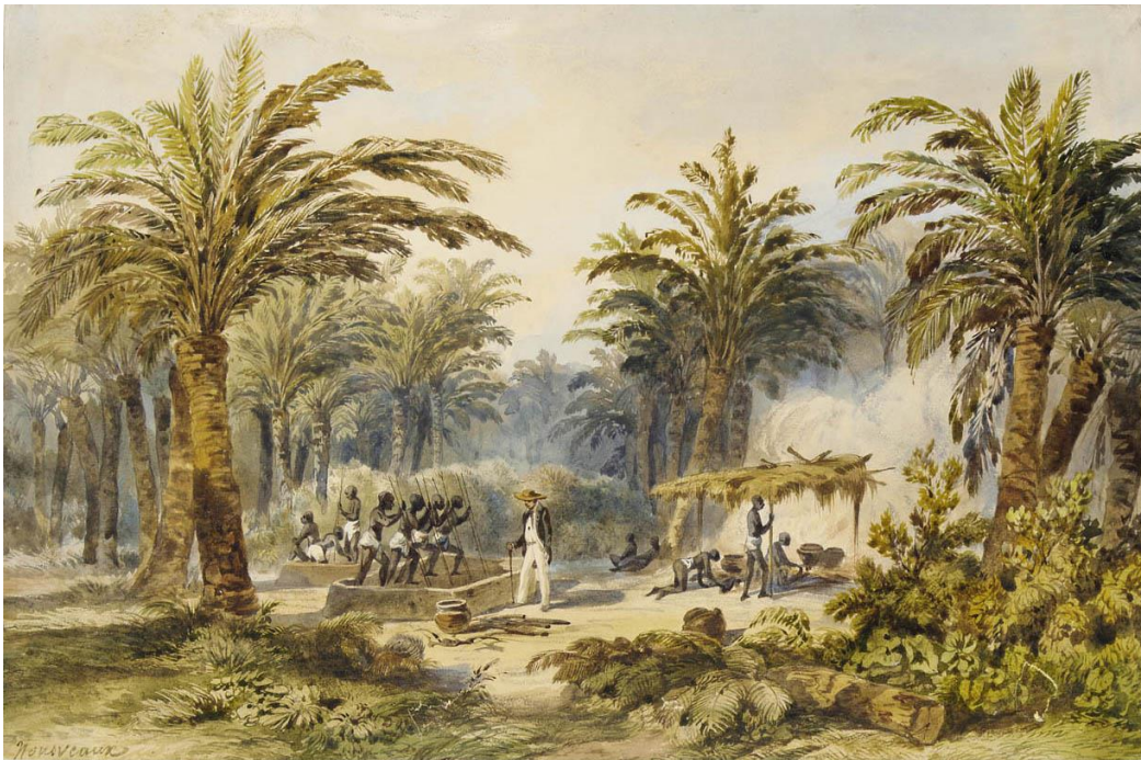
Obr. 2 Výroba palmového oleje v Whydah, západní pobřeží, Afrika (Nousveaux, 1845)

Průmyslová revoluce ale měla úplně jiné dopady v Africe než kdekoli jinde na světě. Jak píší Dan Allosso a Tom Williford ve svém díle „Modern World History: New Perspectives“: