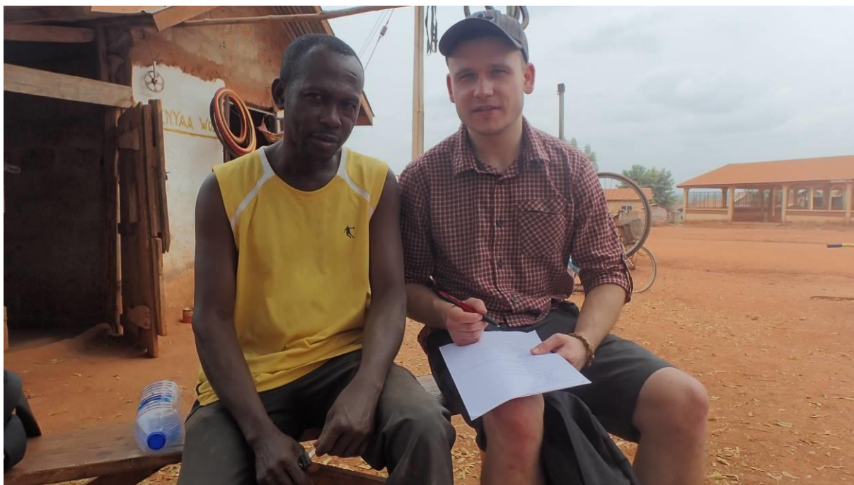
11 Dotazování autora práce (třetí zleva) členů neurozeného rodu v sázkové kanceláři na vesnici za pomoci překladatele (první zleva)