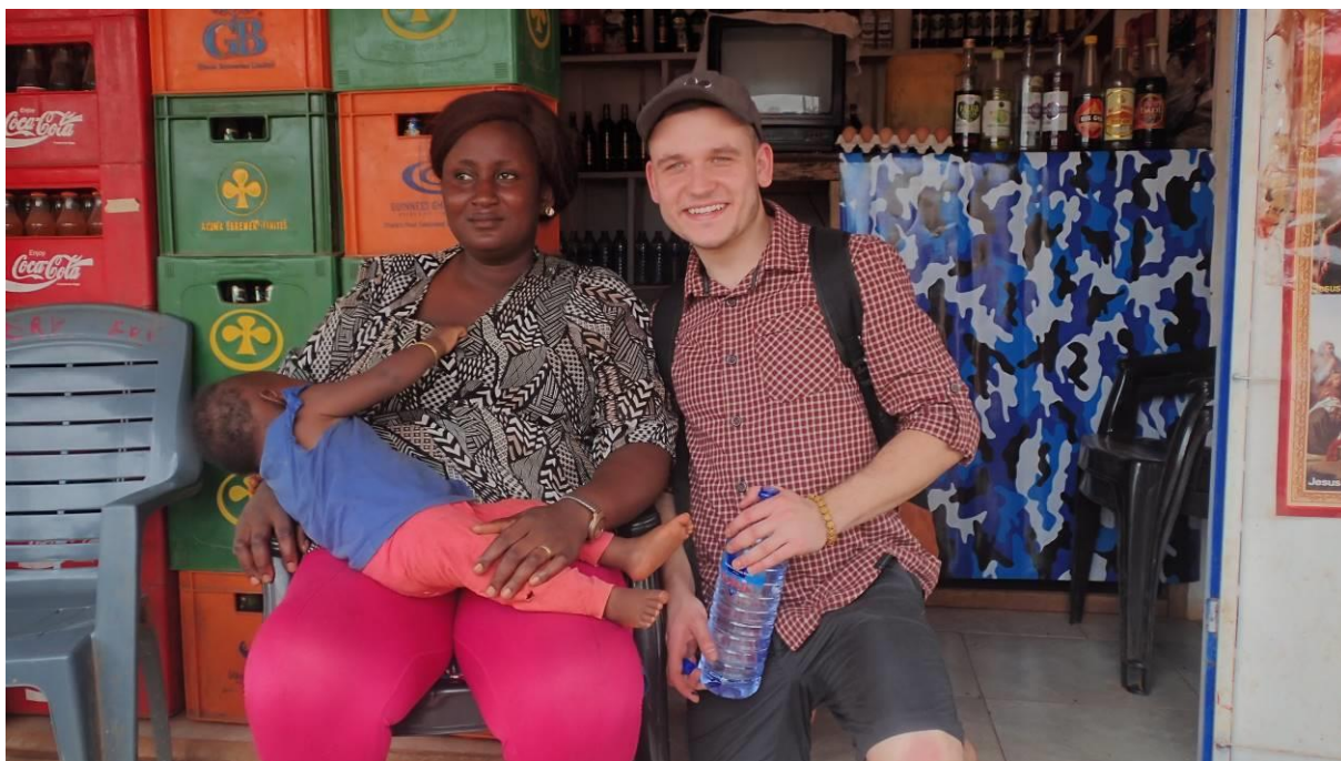
15 Isaacův děd (čtvrtý zprava) společně s rodinnými příslušníky královského původu na pohřbu