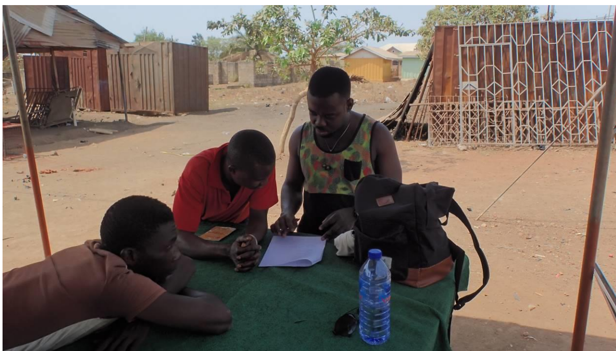
7 Dotazování informátora (první zprava) ve městě Odumasi