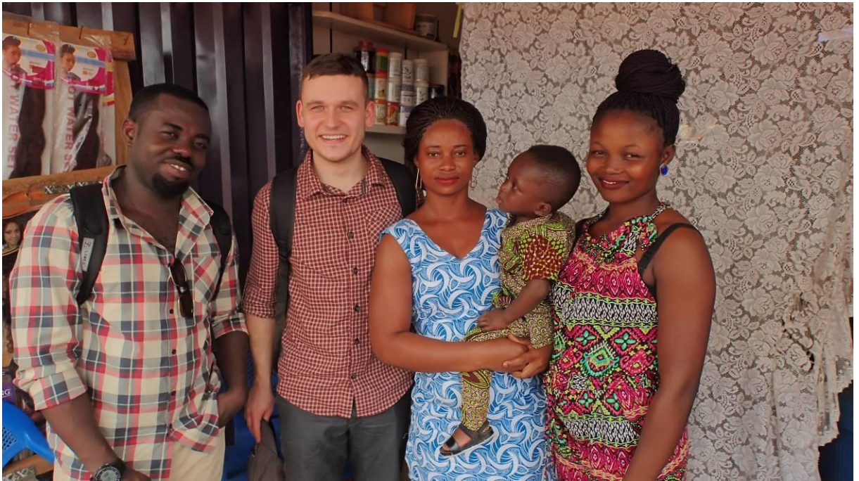
13 Dotazování autora práce (první zleva) vesnického obchodníka neurozeného původu (uprostřed) za pomoci překladatele (třetí zleva)