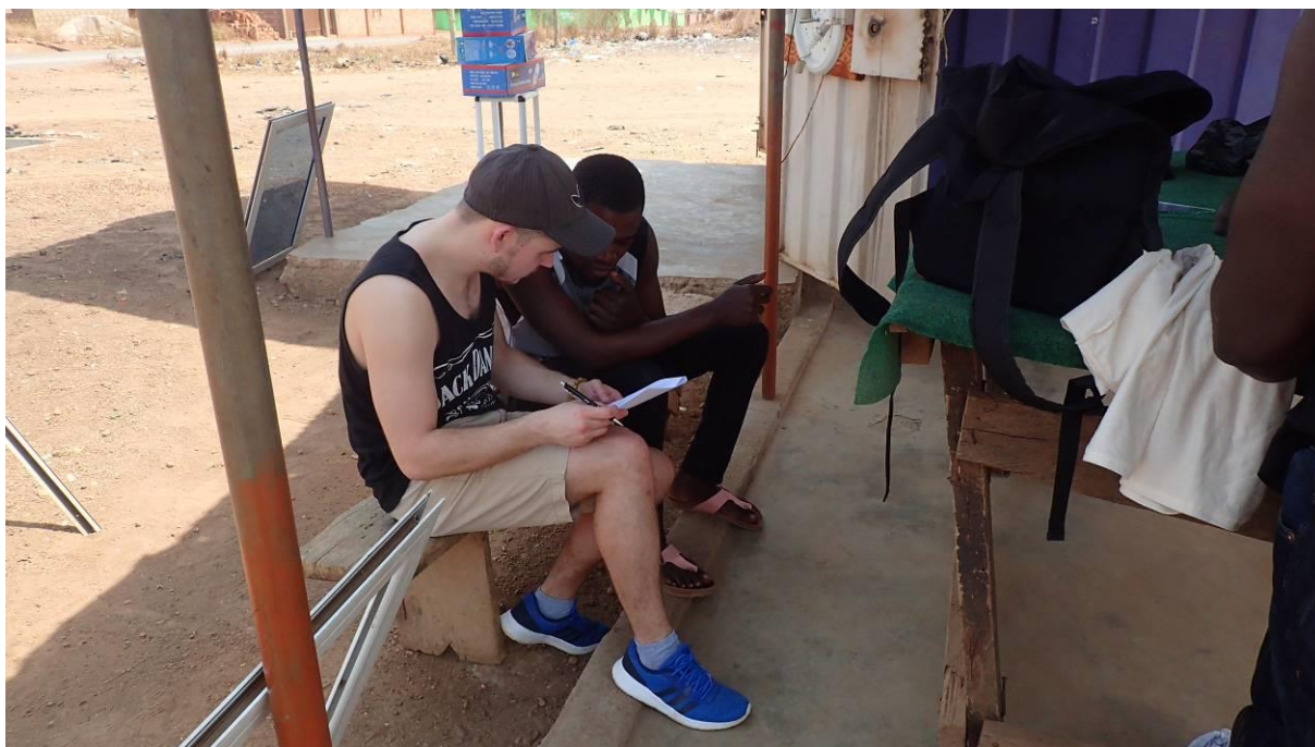
Obrázky 6-14 jsou z autorova osobního archivu