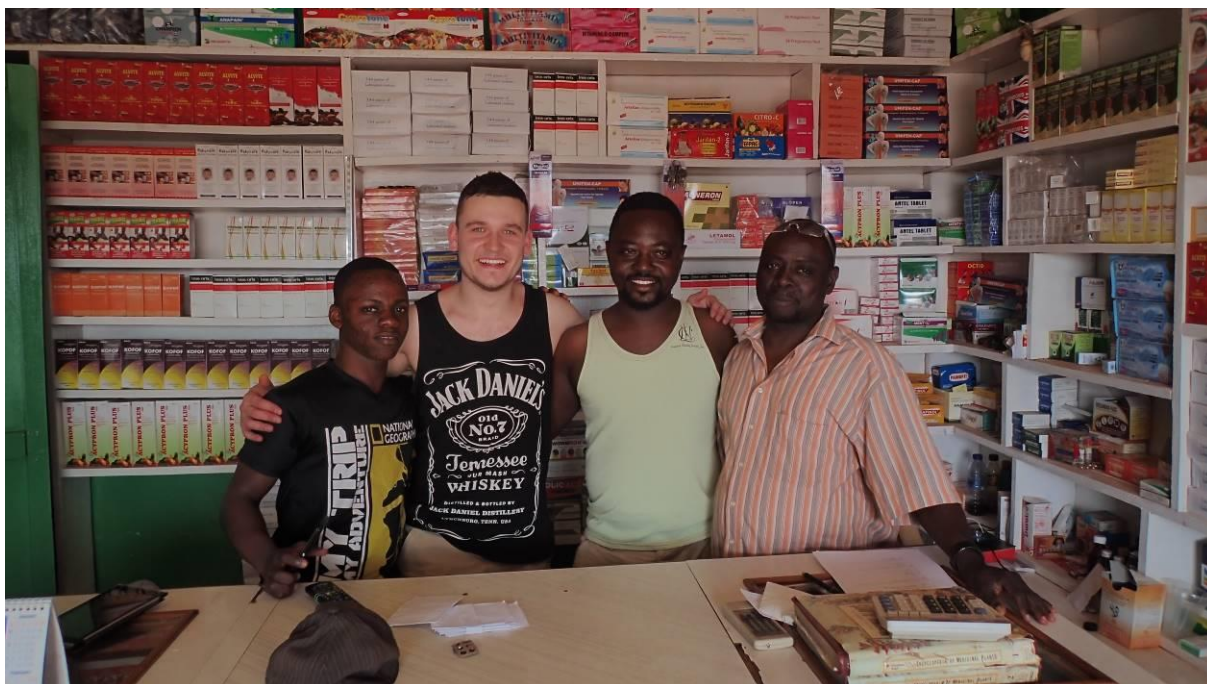
9 Dotazování autora práce (druhý zleva) sestry informátora – členky královské rodiny ve městě Odumasi