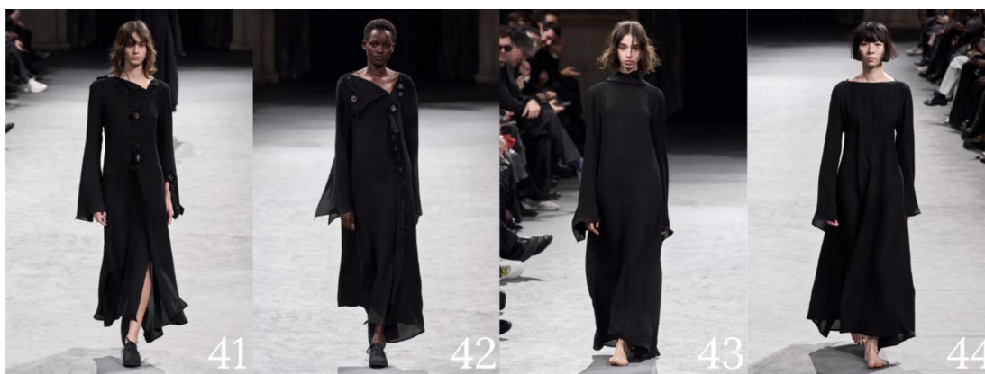
Obrázek 9 – Poslední čtyři modely (Oberrauch 2023)

První čtyři modely (viz Obrázek 8) mají všechny spoustu vrstev a také zdobivých prvků, které vytváří dojem o to více objemných siluet. Zároveň vypadají, jako kdyby se svým stylem dělily do stylisticky podobných dvojic. První dvojice, tvořena z modelu č. 1 a č. 2, využívá stejné siluety a také složitě vrstvených sukní, u druhé dvojice, modelů č. 3 a č. 4, můžeme vidět roztřepené lemy oblečení a velmi očividnou asymetričnost.