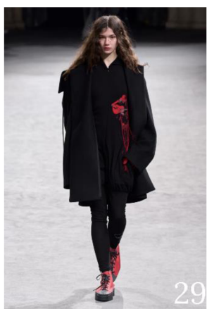
Obrázek 4 – Model č. 29 (Oberrauch 2023)

Na první pohled můžeme vidět, že je kolekce tvořena především oblečením černé barvy; další výrazný prvek, který se objeví zhruba od půlky kolekce na modelech č. 23–26 a č. 29 (nepatrně i na modelech č. 33 a 34) je použití červené barvy v kombinaci s černou. Lily Templeton (2023), autorka reportáže o této kolekci pro Women's Wear Daily , píše, že červená barva symbolizuje krev, znázorňuje tak „bolest, kterou Jamamoto cítil důsledkem osobních ztrát v posledním roce“, přičemž součástí reportáže jsou i střípky Jamamotova vyjádření k této kolekci, a je tedy možné, že se jedná o Jamamotův vlastní komentář, ne pouze o interpretaci Templeton. Kromě těchto dvou barev je nenápadně použita také tmavě modrá a tmavě šedá. Tyto barvy do kolekce Jamamoto také přidal, protože říká, že kdyby „použil pouze krev diváci by se nudili“ (Templeton, 2023). Slovo „krev“ Jamamoto použil místo slova „červená“, patrně tedy předchozí komentář patří samotnému Jamamotovi.