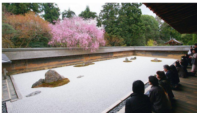
Obrázek 2 – Zenová zahrada v Rjóandži