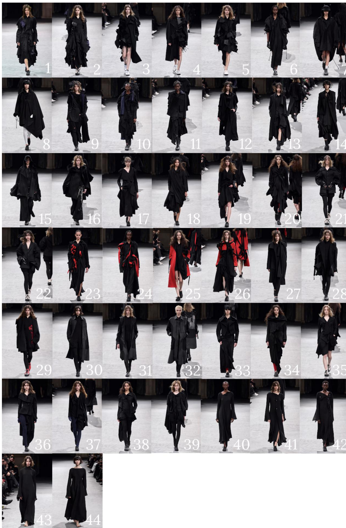
Obrázek 3 – Všechny 44 modely kolekce podzim/zima 2023 (Oberrauch 2023)