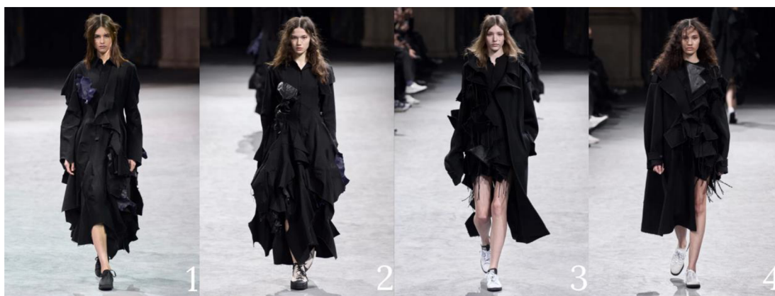
Obrázek 8 – První čtyři modely (Oberrauch 2023)

Na kolekci mi osobně přijde nejvíce fascinující, jak na sebe všechny modely navazují a postupně se zjednodušují. Na Obrázku 3 můžeme vidět, že se s postupem kolekce z oblečení ztrácí objem a spolu s tím i extravagantnost. I doplňky hlavy v druhé polovině kolekce vymizely. Siluety jsou stále užší a vrstvy oblečení tenčí, skoro jako kdyby ze sebe modelky svlékaly vrstvy oblečení.