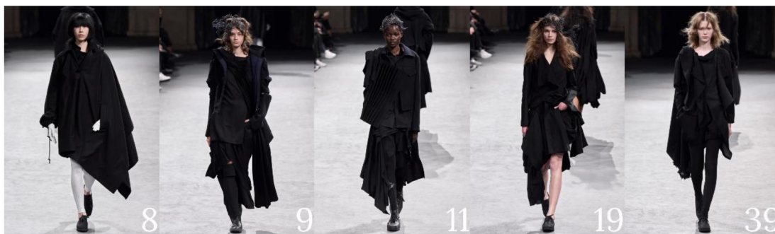
Obrázek 6 – Příklad asymetrických střihů (Oberrauch 2023)

U jedenácti modelek (č. 9–14, 17–19, 21–22) také vidíme doplňky hlavy, vytvořené z drátků, připomínající roztrhané sítě. V kombinaci s rozčuchanými účesy, které měla každá modelka s delšími vlasy, působí skoro jako ptačí hnízda. Pomáhají dotvářet nedokonalý a asymetrický vzhled oděvů. Také si z čísel modelů můžeme všimnout, že se objevují ve třech postupně kratších vlnách a v druhé polovině kolekce už se neobjevují vůbec.