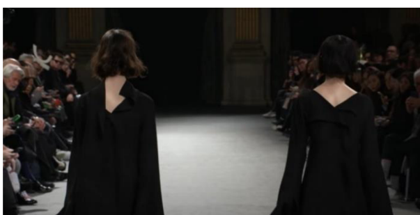
Obrázek 10 – Poslední dva modely (Yohji Yamamoto 2023)

Poslední čtyři modely (viz Obrázek 9) jsou všechny velmi jednoduché a elegantní. I zde je ale patrné jakési rozdělení do dvojic. Modely č. 41 a č. 42 vypadají jako variace jednoho oděvu s pozměněným spodkem sukně, stejně tak i modely č. 43 a č. 44 vypadají jako dvě variace stejných šatů, avšak s pozměněných výstřihem. Poslední dvě modelky také přišly na molo nezvykle zároveň, vedle sebe, i když zbytek přehlídky probíhal běžným způsobem, kdy, když dojde jedna modelka na konec mola, vyjde další (Yohji Yamamoto, 2023, 23:44). Ukončily tak přehlídku těmi nejprostšími a nejjednoduššími modely z celé kolekce, bez dekorativních prvků, šperků, dokonce bosky.