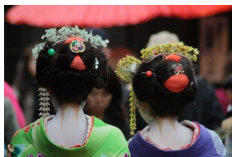
Obrázek 11 – Maiko v Kjótu (Paul 2023)

Poslední dva modely jsou zajímavé i tím, že mají odhalené šije. „Šije ( unadži 項), kterou se většina lidí příliš nezabývá, je v Japonsku považována za část těla, ve které sídlí ženská krása“ (Cherry, 2016, s. 21). Přitažlivost šije vychází z toho, že je při nošení kimona, z důvodu tradičního nošení vyčesaných vlasů, často jedinou odhalenou částí těla (Cherry, 2016, s. 21). Tzv. nukiemon (抜衣紋), tedy odhalování šije pomocí stažení zadního límce kimona, „se v roce 1907 stalo velmi populárním prvkem při nošení kimona“ (Fukai, 1989, s. 8). Podobnost s kimonem v případě posledních dvou modelů můžeme vidět právě ve faktu, že kromě šije je zbytek těla, až na šlapky, zahalený. Modelky sice nemají vyčesané vlasy, ale obě mají krátký sestřih.