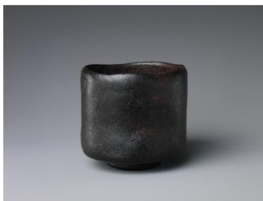
Obrázek 1 – Raku nádoba ze 17. století (The Metropolitan Museum of Art nedatováno)

Zatímco Enšú-gonomi vypovídá o jednoduchosti jasné a uspořádané, jednoduchost Rikjú-gonomi je více bezelstná a prostá, je opakem okázalosti a je také velmi úzce spjata s jednoduchostí krásy wabi (Bullen, 2017, s. 111). Jako příklad Rikjú-gonomi Bullen (tamtéž) uvádí velmi slavné černé nádoby vyráběny keramickou technikou raku (楽), které jsou používány při čajovém obřadu (viz Obrázek 1). Tato keramika, zvaná raku-jaki (楽焼), je vyráběna ručně bez použití keramického kola (The Metropolitan Museum of Art, nedatováno).