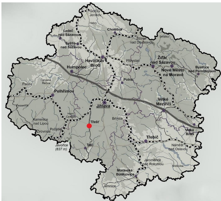
Obrázek č. 2: Mapa kraje Vysočina

Město Třešť se nachází v západní Moravě, v kraji Vysočina asi 17 km jihozápadně od krajského města Jihlavy. Detailní polohu lze shlédnout na obrázku č. 2.