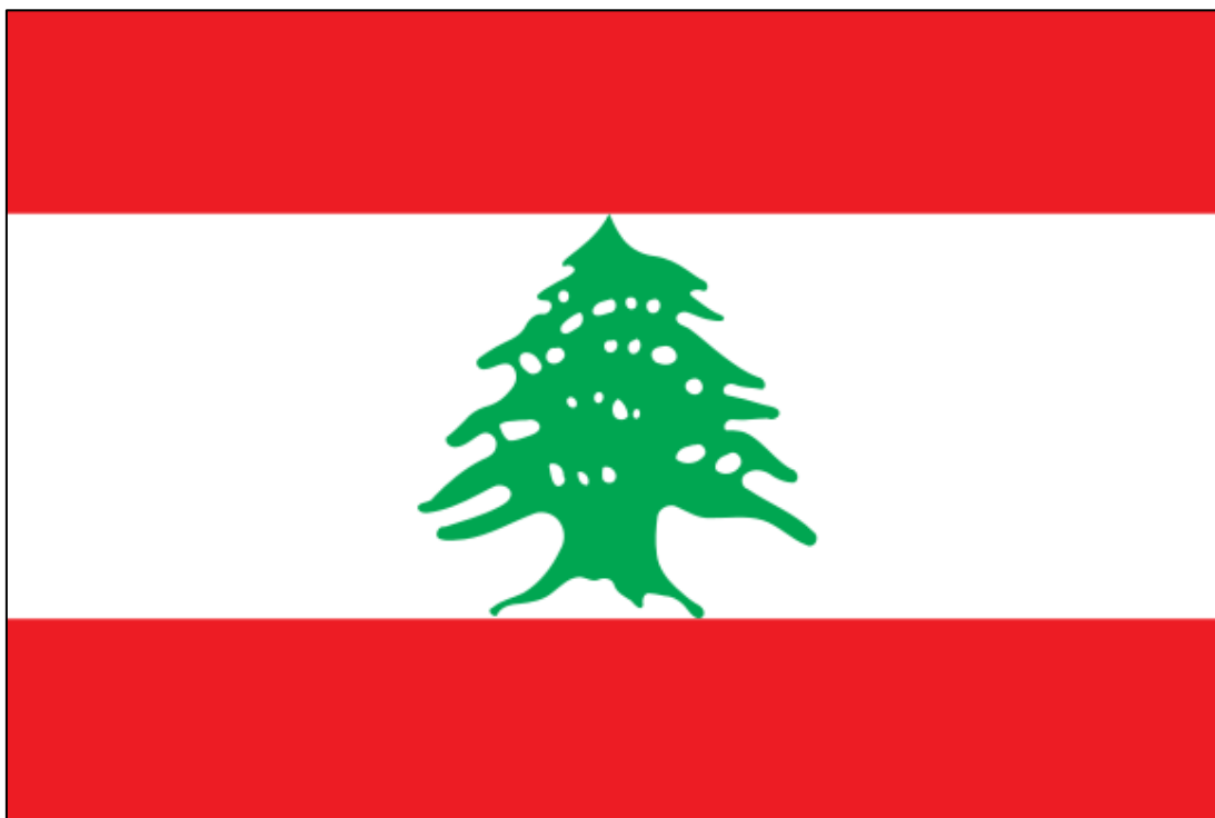
Obrázek č. 4. Vlajka Libanonu