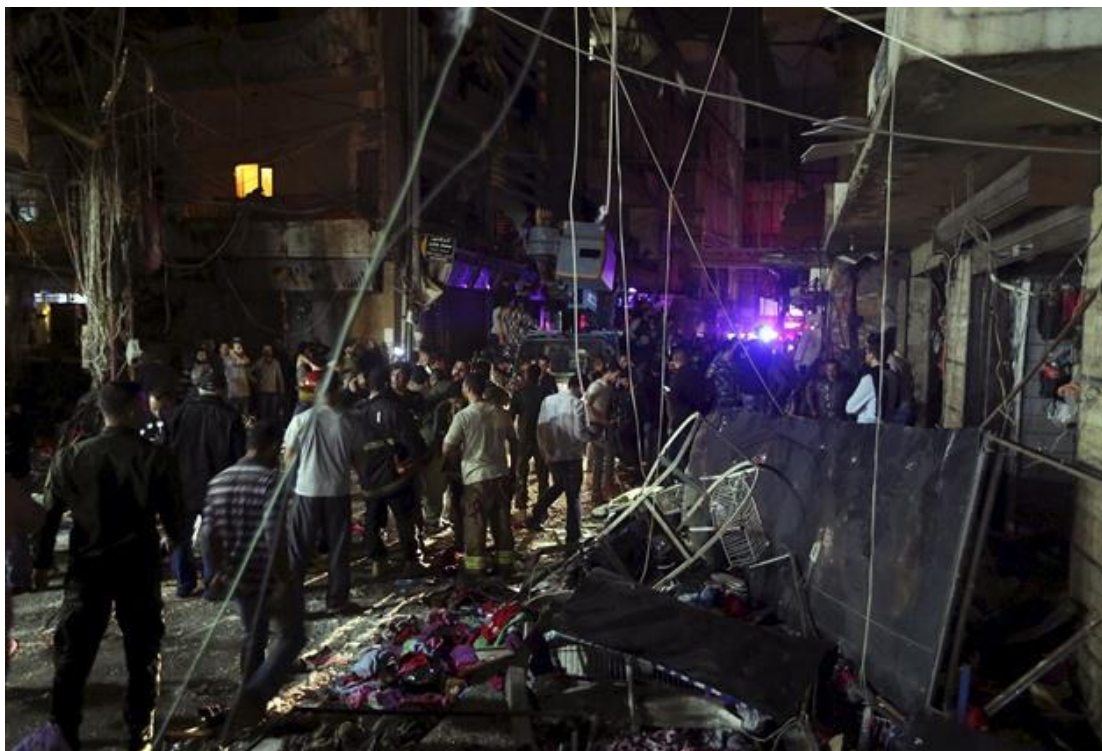
Obrázek č. 8. Sebevražedný útok v Bejrútu v roce 2015

Zdroj: Idnes.cz [fotografie]. Sebevražedný útok v Bejrútu [online] [cit. 2018-01-16]. Dostupné z: https://zpravy.idnes.cz/dva-sebevrazedne-atentaty-v-bejrutu-neprezilo-27-lidi-p00-zahranicni.aspx?c=A151112_190326_zahranicni_fka