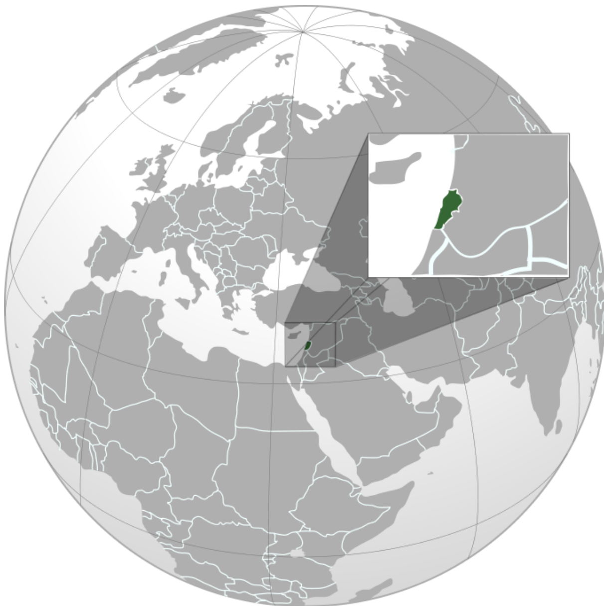
Obrázek č. 2. Poloha Libanonu