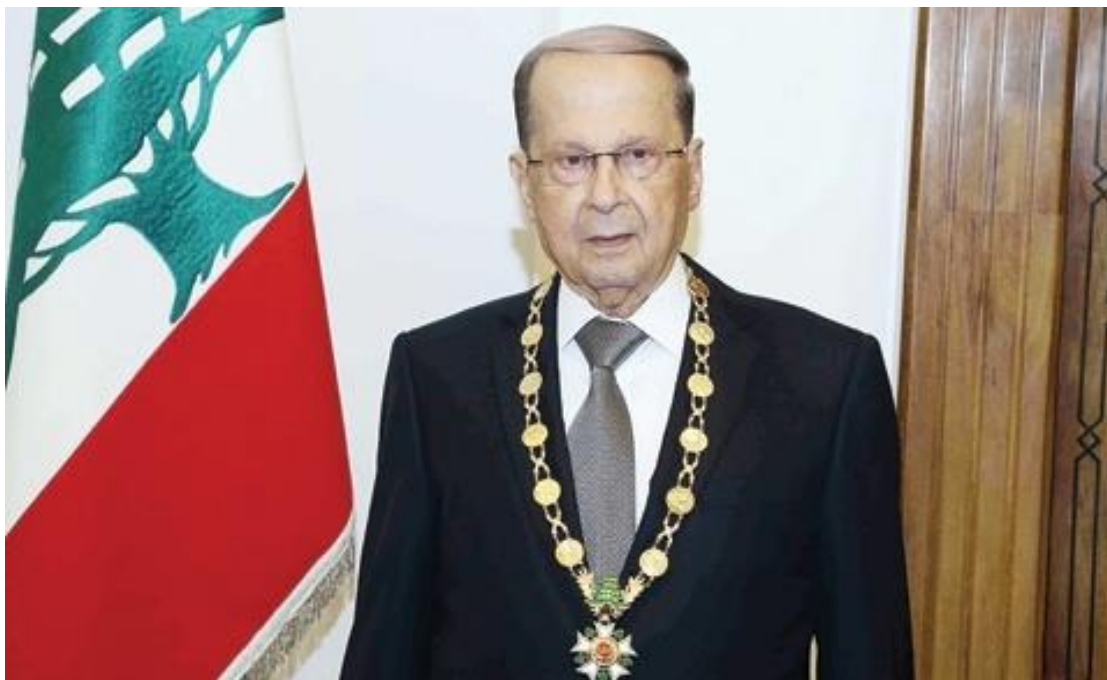
Obrázek č. 9. Současný prezident Libanonu – Michel Aún