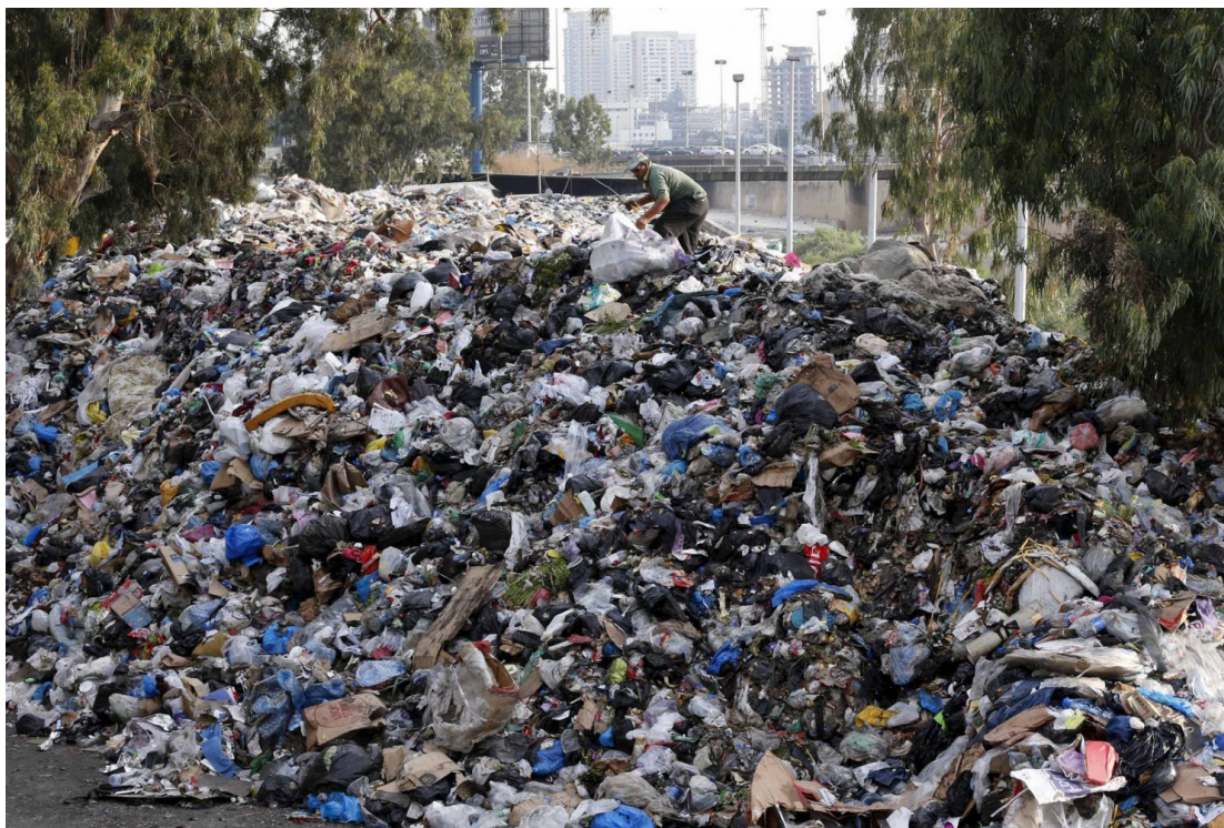
Obrázek č. 7. Velká odpadková krize v roce 2015