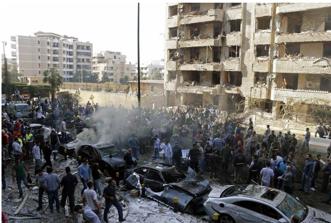
Obrázek č. 6. Útok sebevražděného atentáčníka na ambasádu v Bejrútu v roce 2013