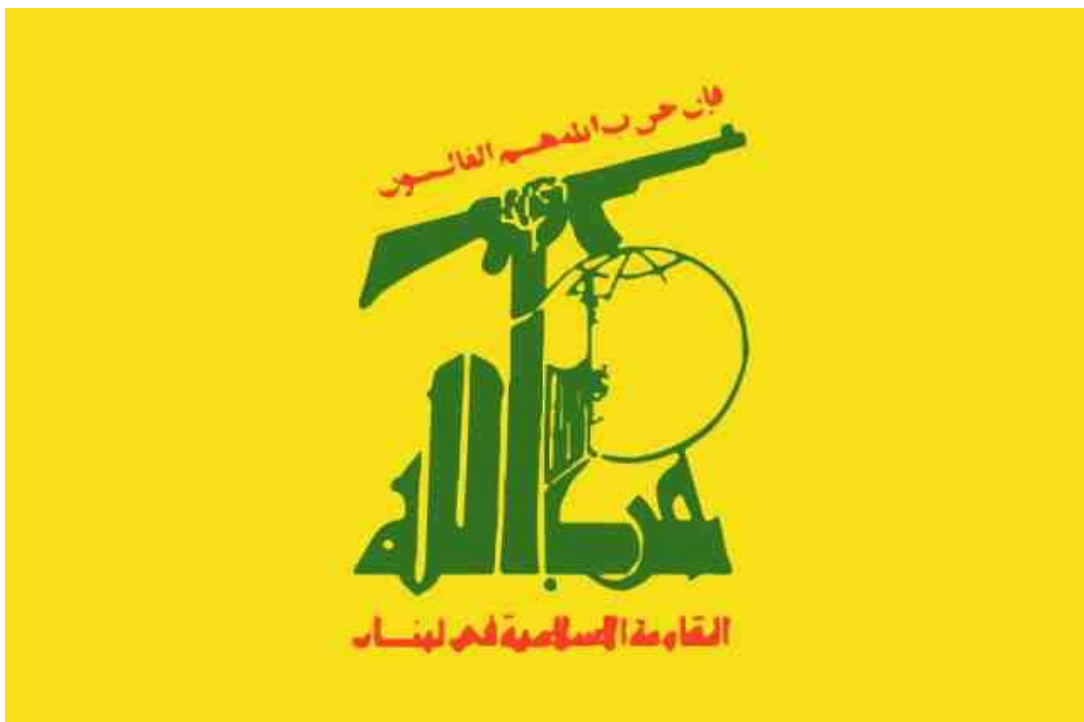
Obrázek č. 5. Vlajka Hizballáhu