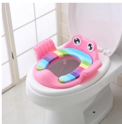
Obrázek 3: Příklad dětského nástavce na WC