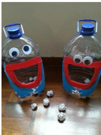
Obrázek 7: Příklad pomůcky pro nácvik krmení (cz.pinterest.com [online] [cit. 21. 3. 2022])