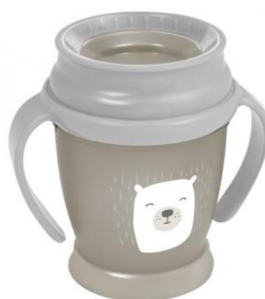
Obrázek 6: LOVI Hrníček 360 Mini s úchyty Buddy Bear 210 ml