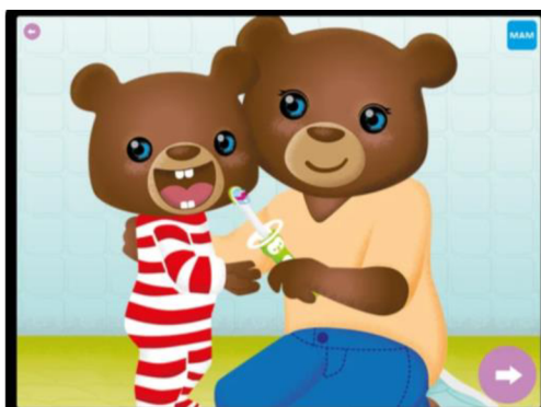
Obrázek 5: Příklad aplikace s tématem čištění zubů – MAM Brushy Time! (apps.apple.com [online] [cit. 21. 3. 2022])