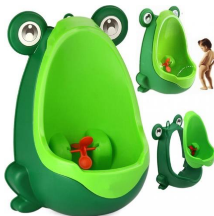
Obrázek 1: Dětský pisoár žába