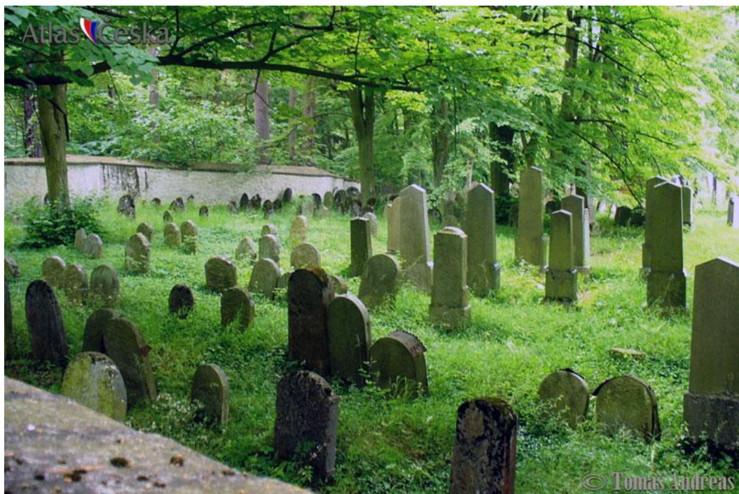
Obr. 2 Židovský hřbitov v Kolodějích nad Lužnicí