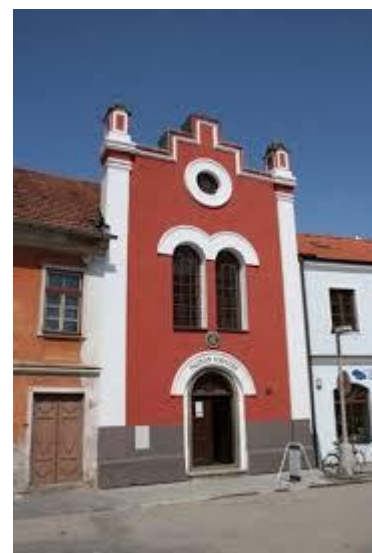
Obr. 5 Bývalá synagoga v Bechyni