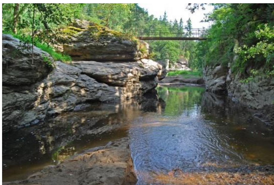
Obr. 4 Židova strouha