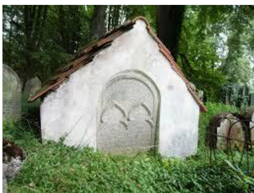
Obr. 3 Tumba rabína Jakoba Mahlera v Kolodějích nad Lužnicí