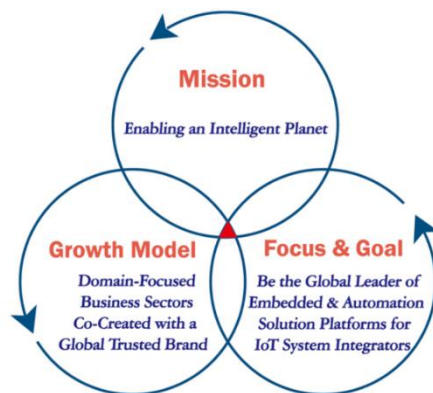
Obrázek č. 1 – Princip 3-Circle organizace

X/Y řídí své cíle a vize podle svého 3-Circle principu, který je založen na knize Good to Great (Jak z dobré firmy udělat skvělou) od Jima Collinse. Podle této knihy by se daná organizace měla zaměřit na 3 základní principy a zavázat se k dlouhodobému provádění těchto principů za účelem jejího dlouhodobého úspěchu. Princip 3-Circle organizace X/Y je znázorněn na obrázku níže.