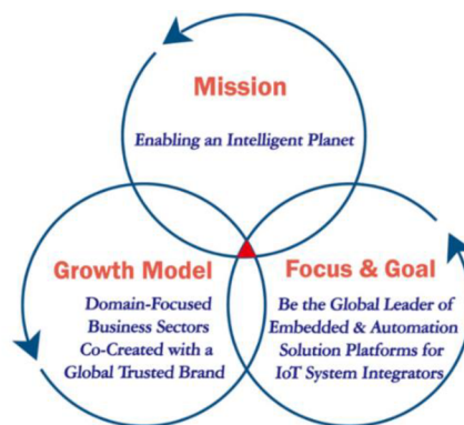
Obrázek č. 1 – Princip 3-Circle organizace

X/Y řídí své cíle a vize podle svého 3-Circle principu, který je založen na knize Good to Great (Jak z dobré firmy udělat skvělou) od Jima Collinse. Podle této knihy by se daná organizace měla zaměřit na 3 základní principy a zavázat se k dlouhodobému provádění těchto principů za účelem jejího dlouhodobého úspěchu. Princip 3-Circle organizace X/Y je znázorněn na obrázku níže.