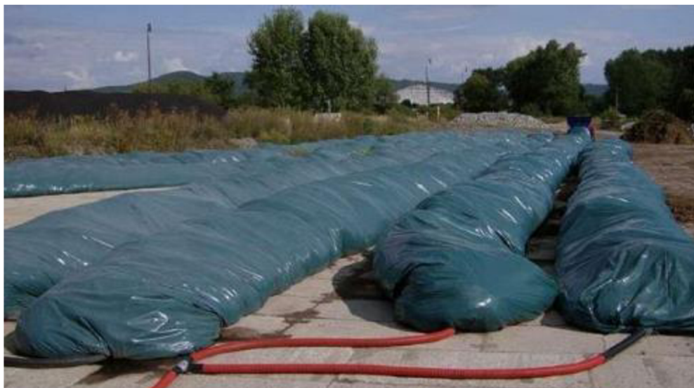
Obrázek 3 – Kompostovací vaky [7]

Při kompostování ve vaku jde v podstatě o kompostování v pásových hromadách na volné ploše, kdy hromady jsou uloženy v uzavřených PE-vacích známých z oblasti uskladňování statkových krmiv, avšak upravených pro kompostování.