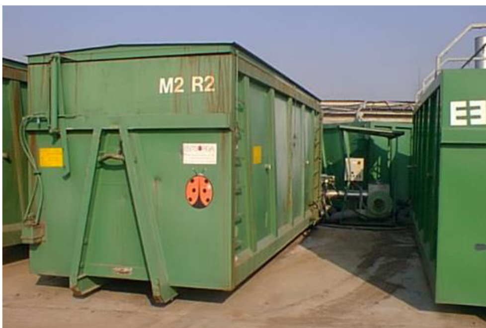
Obrázek 5 – Kompostovací boxy [7]

Celý systém je vybaven zavlažovacím zařízením, ventilátory vhánějící vzduch přes rošty uložených na dně boxů a zabezpečují tak provzdušnění kompostu. Překopávací zařízení je neseno na jeřábové kočce a pracovním orgánem je spirála opatřena výstupky, které zabezpečují průběžnou mechanickou destrukci částic materiálu. Vynášením materiálu z dolních vrstev základky až na povrch dochází k intenzivnímu provzdušňování.