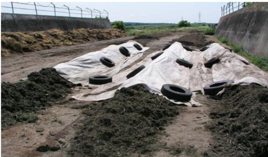
Obrázek 4 – Vodohospodářsky zabezpečený kompostovací žlab [7]

Prostory pro kompostování mají tvar podlouhlého žlabu, který je zaplněný kompostem. Výroba kompostu probíhá metodou kontrolovaného aerobního rozkladu s možností podpory procesu přístupem vzdušného kyslíku do tělesa výrobní zakládky pomocí ventilačních jednotek.