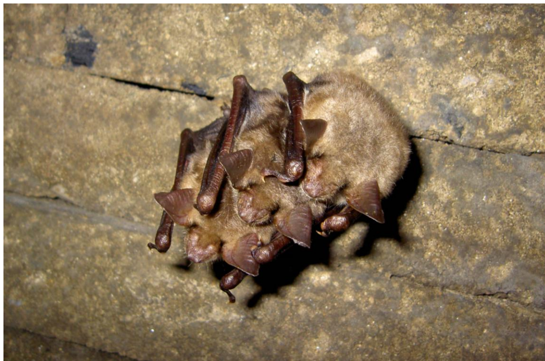
Obr. 1. Tři jedinci netopýra velkého ( M. myotis) zimující v lomu Malá Amerika (2. 2. 2012,).