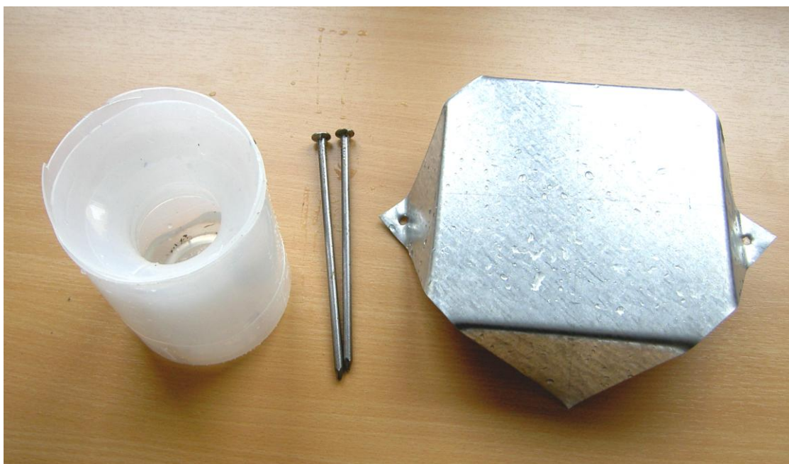
Obr. 4. Padací past na lezoucí hmyz (zleva nádobka s formalínem, hřebíky k upevnění stříšky, zakrývací stříška) (2. 4. 2012,).