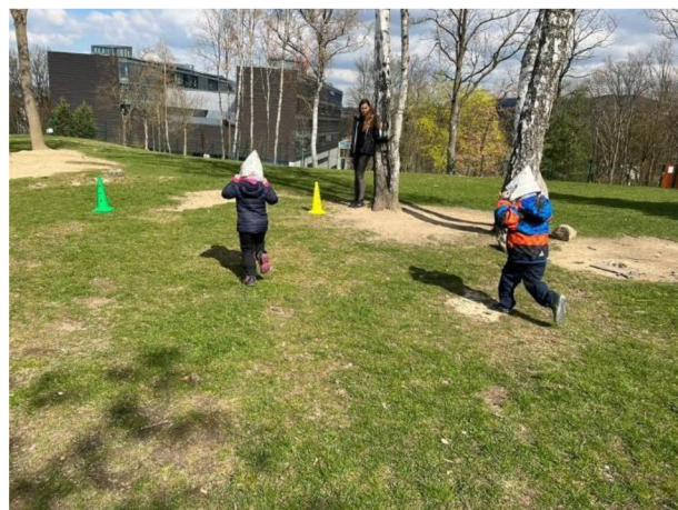
Obrázek 2: Afričtí nosiči