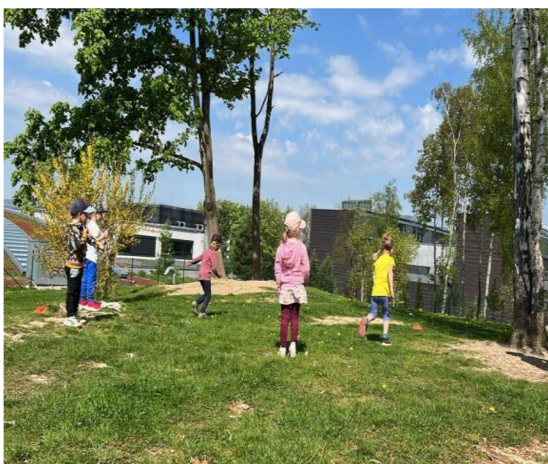
Obrázek 31: Lavina

Děti byly rozděleny na vyvážené skupiny a dobíhaly k cíli stejně rychle. Pro začátek je lepší, když bude méně skupin s menším počtem účastníků, aby se první hráč hned neunavil. Během hry se i děti střídaly ve svém pořadí a tak si každý vyzkoušel roli vůdce, Hra u dětí rozvíjí spolupráci a rychlost.