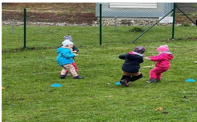
Obrázek 5: Přetahovaná s lanem

Podle paní učitelky bych měla dbát na to, aby síly dětí byly vyrovnané. Postavit proti sobě děti stejné věkové kategorie. Jinak se jí hra líbila, pravidla byla jasně daná a srozumitelná. Při hře se děti vyřádily a bavila je. Skvělá na vybití energie dítěte.