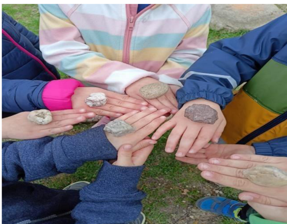
Obrázek 30: Drápky: hra s oblázky

Aktivita byla pro děti nová, ale velmi rychle si získala jejich pozornost. A i když se s ní setkaly poprvé, šla jim velmi dobře a zvládli ji všichni zúčastnění. Před činností byly poučeny o bezpečnosti a hra se později obešla bez zranění.