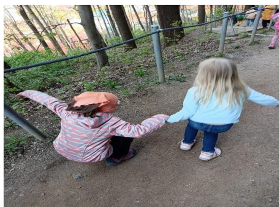
Obrázek 20: Pochodová hra