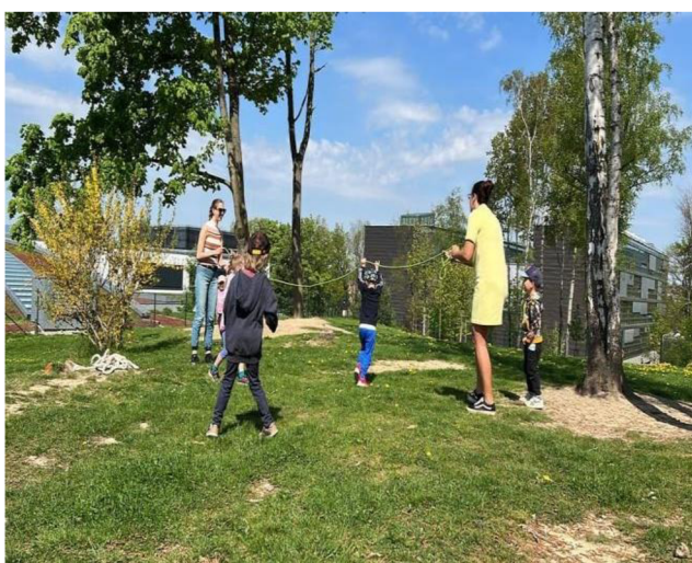
Obrázek 28: Velké švihadlo

Děti hra zaujala a byly ochotné ji opakovat. Zpočátku se bály, že je lano uhodí, ale po vyzkoušení z nich strach opadl a hra si získala jejich zájem. I u této hry se musí dát pozor na bezpečnost.