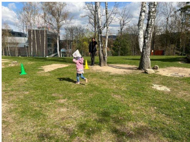
Obrázek 1: Afričtí nosiči

skupiny. Jinak začátek hry byl vysvětlen dobře a hra již pak pokračovala bez větších problémů. Děti hru podle ní ocenily a bavila je.