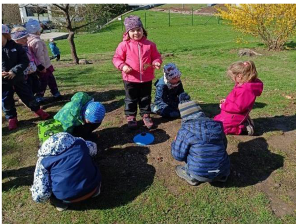
Obrázek 14: Vyměňování stromů