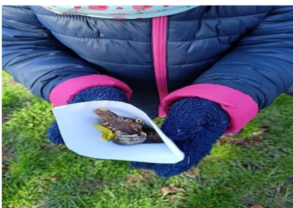
Obrázek 7: Vůňový koktejl

Aktivita by se jistě dala využít i pro téma čarodějnic. Dobře navazovala na skládání pohárku z ranní činnosti. Vhodné určitě do teplého jarního počasí. Pro začátek aktivity je vhodné si opět najít vhodné místo pro její realizaci. Jistě v dětech vzbudí zájem o přírodu a zároveň ji poznají i z dalších úhlů pohledu.