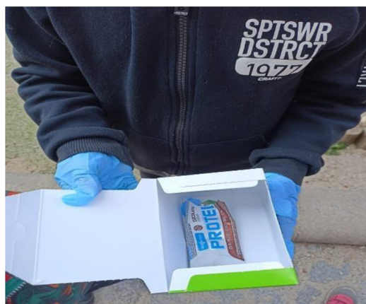
Obrázek 18: Co na louku nepatří