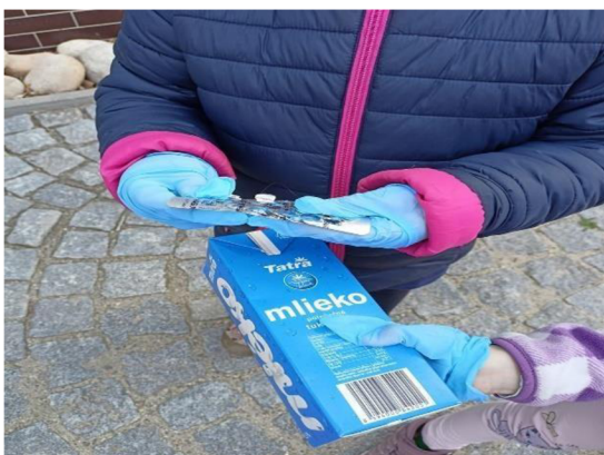
Obrázek 17: Co na louku nepatří