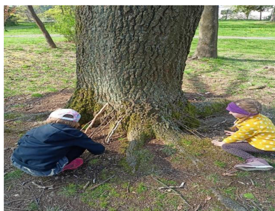
Obrázek 22: Domečky pro skřítky