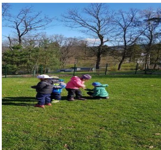
Obrázek 13: Oblázková štafeta

Na pochopení pravidel není hra náročná a u dětí probouzí skrytou soutěživost a radost ze hry.