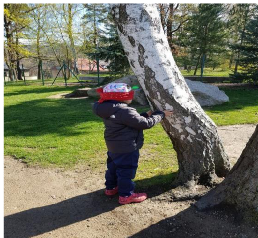
Obrázek 10: Poznej svůj strom