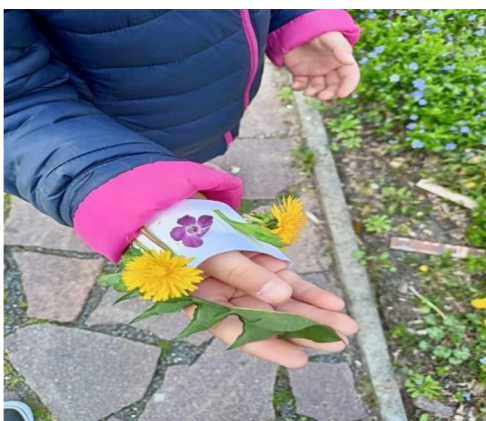
Obrázek 11: Přírodní náramky

Vhodný nápad pro téma čarodějnic s dobře zvolenou lokalitou. Pokud by došlo k tomu, že náramek nejde na ruku dítěte nasadit, dáme mu ho pouze do ruky.