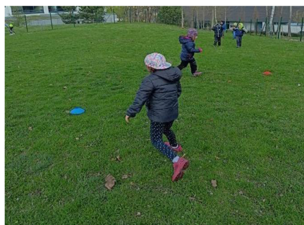
Obrázek 24: Voda, oheň, blesk