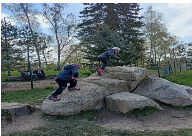
Obrázek 23: Voda, oheň, blesk

Dle paní učitelky se hra dětem líbila a byla to skvělá možnost pro pohybovou aktivitu. Ve hře děti zapojily svou soutěživost a dobře se vyběhaly. Pravidlům všichni porozuměli, a to i jistě díky předvedení jednotlivých pohybů na jednom dítěti.