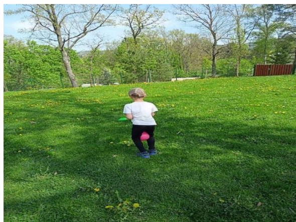
Obrázek 34: Klokani