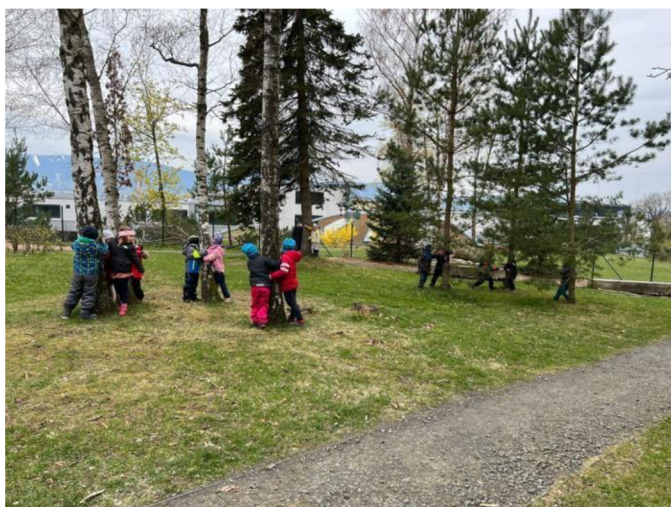
Obrázek 3: Škatulata, škatulata hýbejte se

Z pohledu paní učitelky byla tato hra dobrým nápadem pro zpestření pobytu venku. Lze ho realizovat kdekoliv a kdykoliv. Pokud by se ale hra měla uskutečnit příště, bylo by dobré mít po ruce menší hudební nástroj, jehož zvuky by značily, aby se děti rychle přesunuly k nejbližšímu stromu. Podle paní učitelky hra děti oslovila a byla zábavná. Hra by se dala použít i v letním počasí.