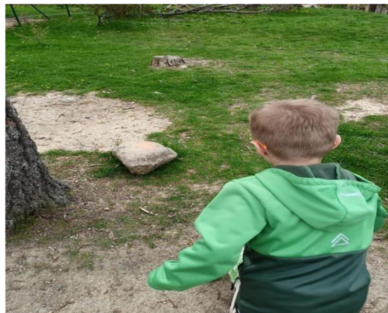
Obrázek 27: Tref kámen