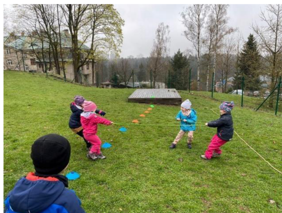
Obrázek 6: Přetahovaná s lanem