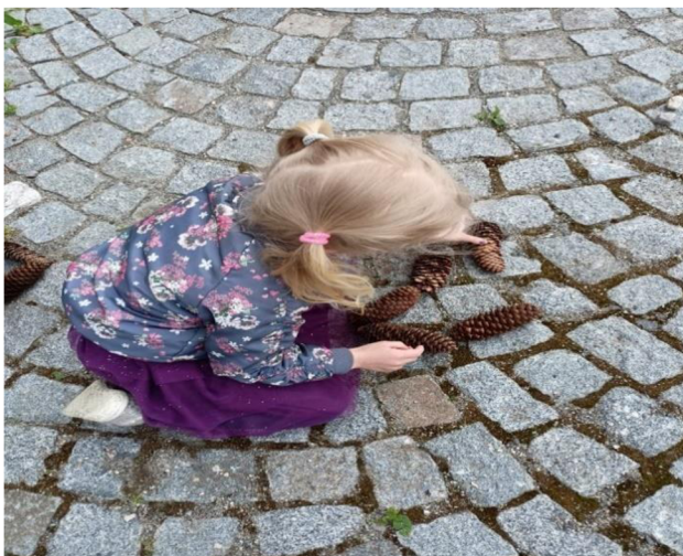
Obrázek 25: Nejkrásnější obrázek