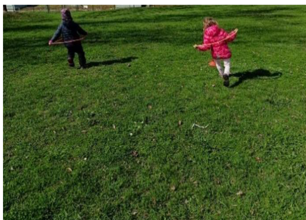
Obrázek 15: Štafeta v obruči

Dle paní učitelky zařadit před aktivitu menší běhání pro všechny nebo malou pohybovou aktivitu s říkankou. Lepší jasnější a stručnější vysvětlení, zkrátit věty. Jinak aktivita v pořádku bez problémů. Aktivita na sebe krásně navazovaly a byly dobře propojené.