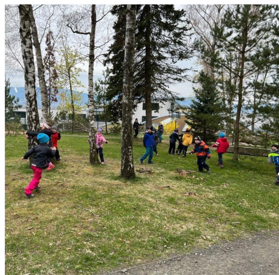
Obrázek 4: Škatulata, škatulata hýbejte se