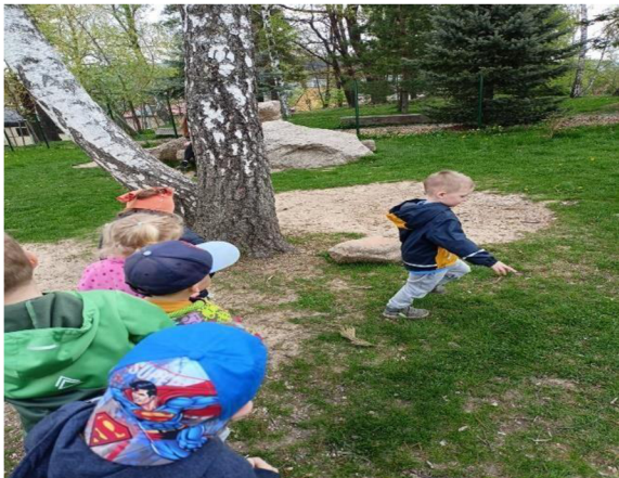
Obrázek 26: Tref kámen

Děti velmi bavilo se do kamene strefovat, což je i motivovalo k dalším pokusům. Zároveň i zkoušely, z jaké vzdálenosti kámen trefí.