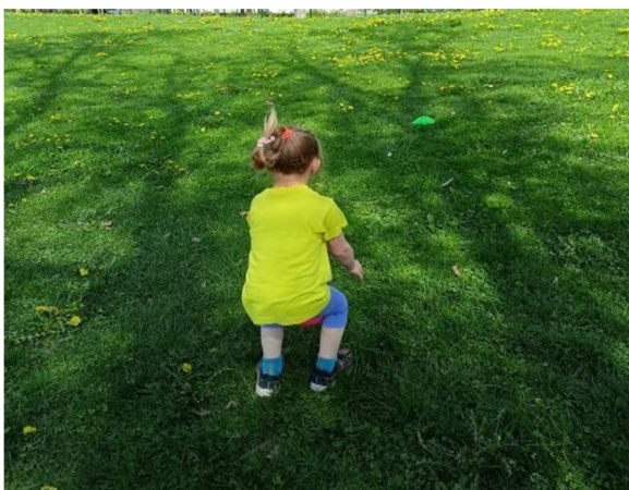
Obrázek 33: Klokani

Pravidla děti pochopily velmi rychle a nebyly nijak náročné na pochopení. Míč dokázali mezi nohama udržet všichni. Hra je vhodná pro každou věkovou kategorii. Šla by i udělat soutěž, kde by celá skupina závodila o to, kdo bude nejrychlejším klokanem.