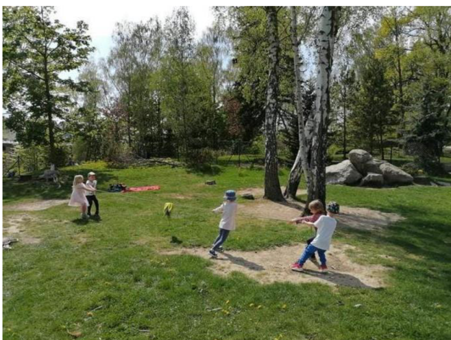
Obrázek 35: Přetahovaná s lanem

Bylo vhodně zvoleno, že střed lana byl vyznačen barevnou látkou, aby děti poznaly, jak velkou část lana už mají na své straně. Hru hrály na několik kol a nechtěly přestat. Při každém kole se měnily i pozice hráčů, což bylo dobré z důvodu rozvoje spolupráce a komunikace. Děti tak mohly porovnávat své síly mezi sebou.