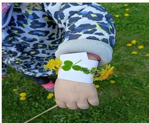
Obrázek 12: Přírodní náramky