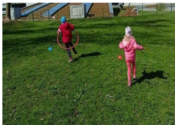
Obrázek 16: Štafeta v obruči