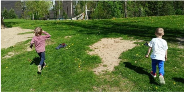
Obrázek 32: Oblékačí rychlost