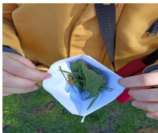
Obrázek 8: Vůňový koktejl