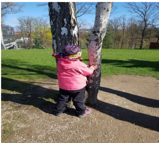
Obrázek 9: Poznej svůj strom