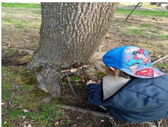
Obrázek 21: Domečky pro skřítky

Jednoduchá hra, která bavila všechny děti. Rozvíjely při ní svou kreativitu a fantasii. Některé děti udělaly domečků více a bylo vidět, že se hra setkala s pozitivním ohlasem. Dobrá byla i zpětná vazba dětí, kdy za mnou a druhou paní učitelkou chodily a žádaly o pomoc, nebo jen chtěly ukázat svůj domeček.