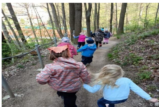
Obrázek 19: Pochodová hra

Hra byla zábavná a jednoduchá. Nebyl problém s její realizací a podle nadšení dětí hra bavila. Hodí se skvěle pro delší cestu v přírodě a děti si díky ní procvičí svou pozornost i sluch. Pravidla pochopily všechny děti a starší i může mladšímu dítěti sloužit jako vzor, pokud by pravidlům někdo nerozuměl.