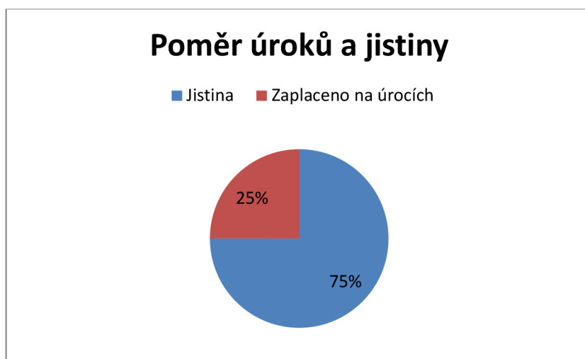
Graf 1 Poměr úroku a jistiny