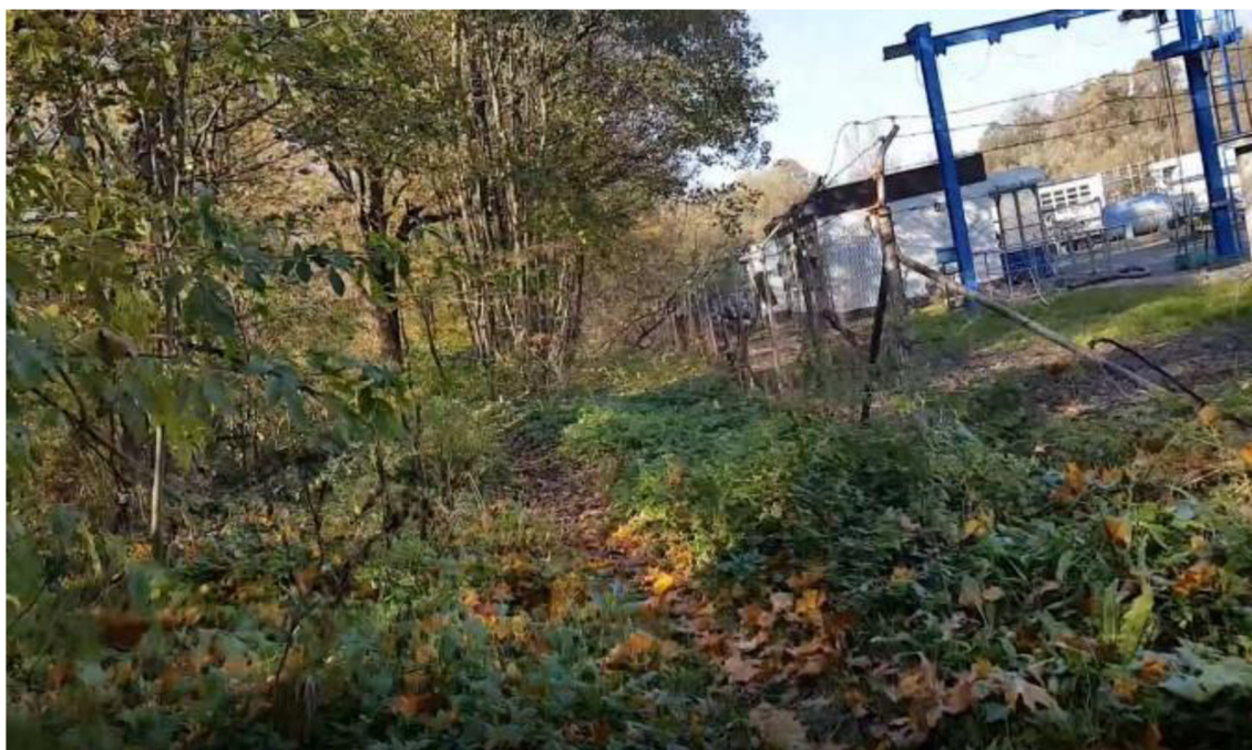
Obrázek 3 - Stav úseku od ČOV před realizací