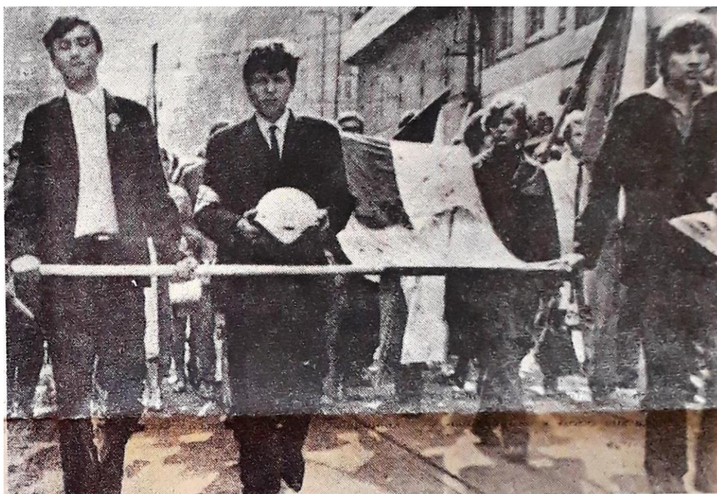
Vídeňské svobodné listy, č. 35/36, 30. 8. 1968, s. 3.