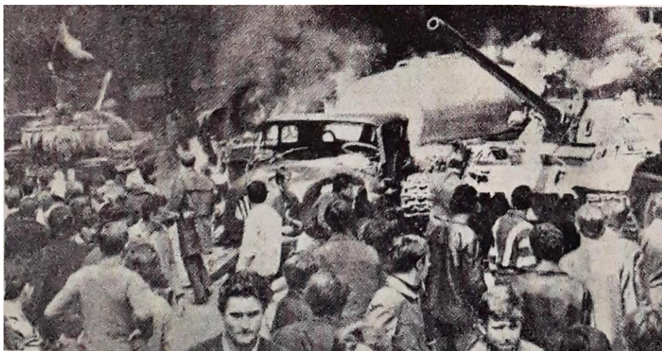
Vídeňské svobodné listy, č. 35/36, 30. 8. 1968, s. 6