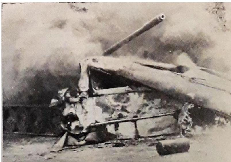
Vídeňské svobodné listy, č. 35/36, 30. 8. 1968, s. 3.