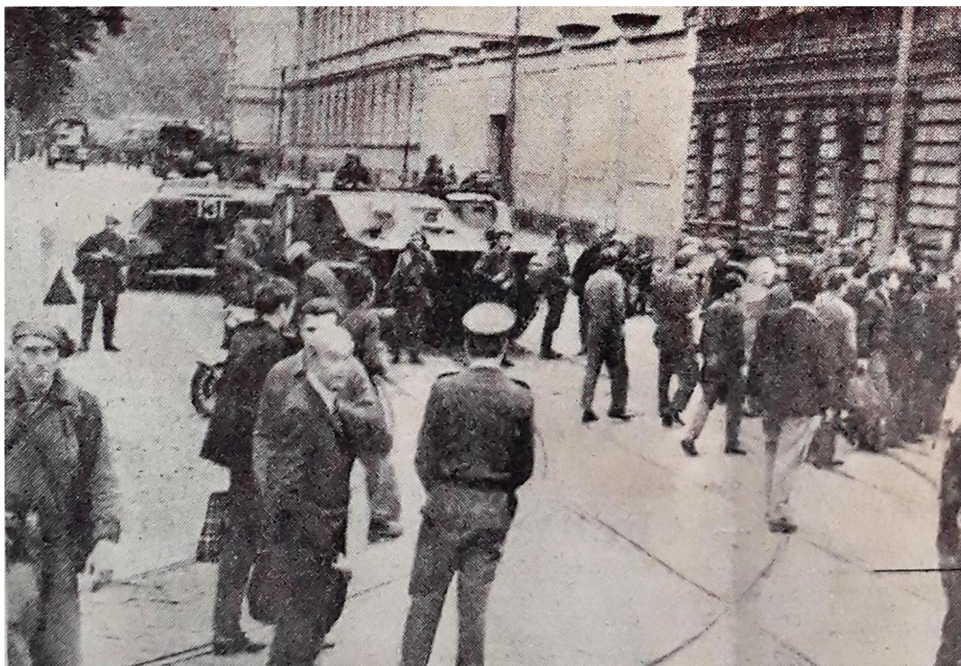
Vídeňské svobodné listy, č. 35/36, 30. 8. 1968, s. 3.