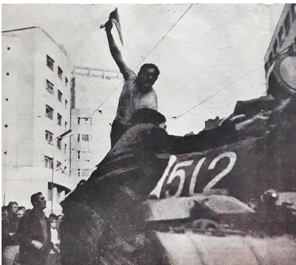
Vídeňské svobodné listy, č. 35/36, 30. 8. 1968, s. 6