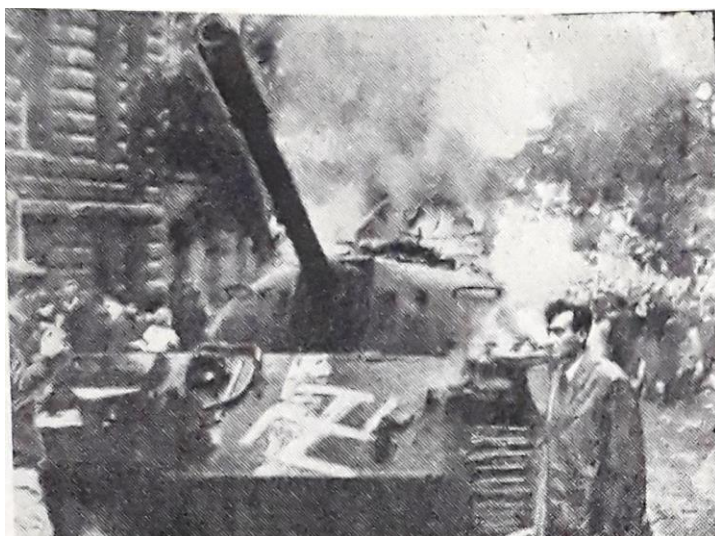
Vídeňské svobodné listy, č. 35/36, 30. 8. 1968, s. 3.