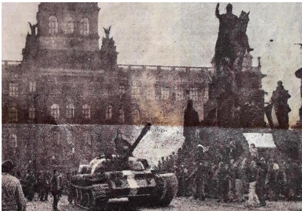
Vídeňské svobodné listy, č. 35/36, 30. 8. 1968, s. 6