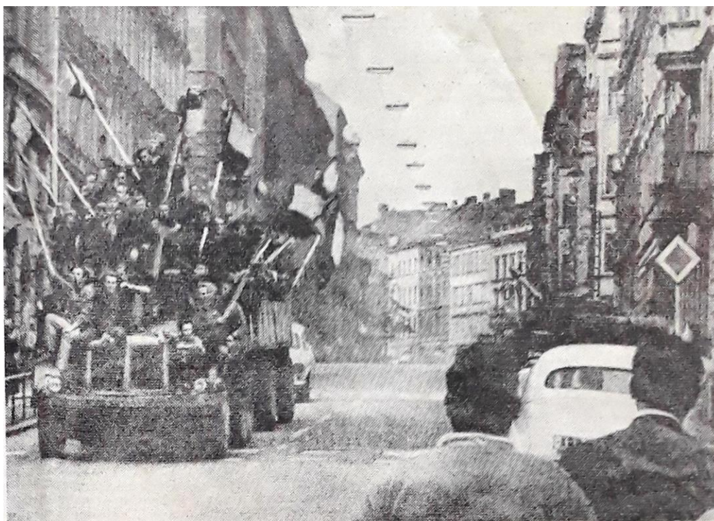
Vídeňské svobodné listy, č. 35/36, 30. 8. 1968, s. 3.