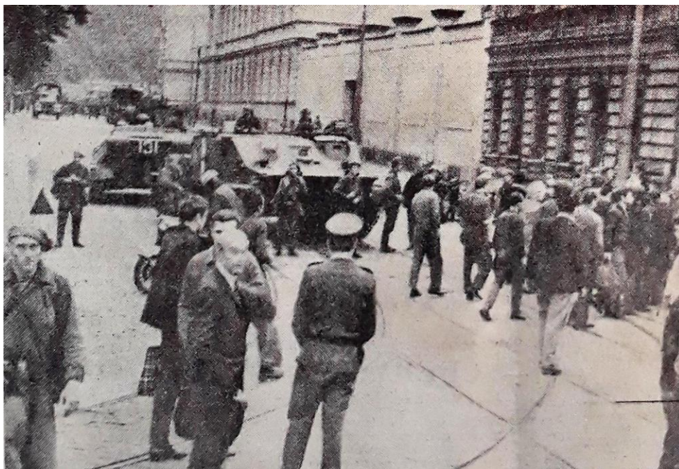
Vídeňské svobodné listy, č. 35/36, 30. 8. 1968, s. 3.