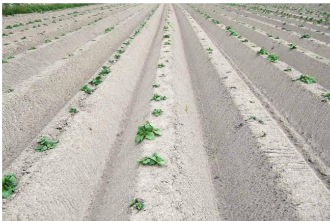
Obrázek 1: Nevhodný tvar hrůbků a brázd (Pavel Růžek)

Tvar a povrch hrůbků vytvářen při sázení brambor má významný vliv na zadržení vody ze srážek (nebo závlahy postřikem) a její infiltrace do půdy. Zlepšená infiltrace a minimalizace ztráty půdy přináší nejen ekologické výhody, ale zároveň správný tvar hrůbků má pozitivní dopad na uchování živin v půdě, což ovlivňuje výnosnost hlíz (Kasal a kol. 2016). Při protierozní ochraně pozemků, kde se pěstují brambory, se obvykle využívá kombinace různých opatření. Kombinací těchto opatření se dosahuje nejlepší ochrany půdy.