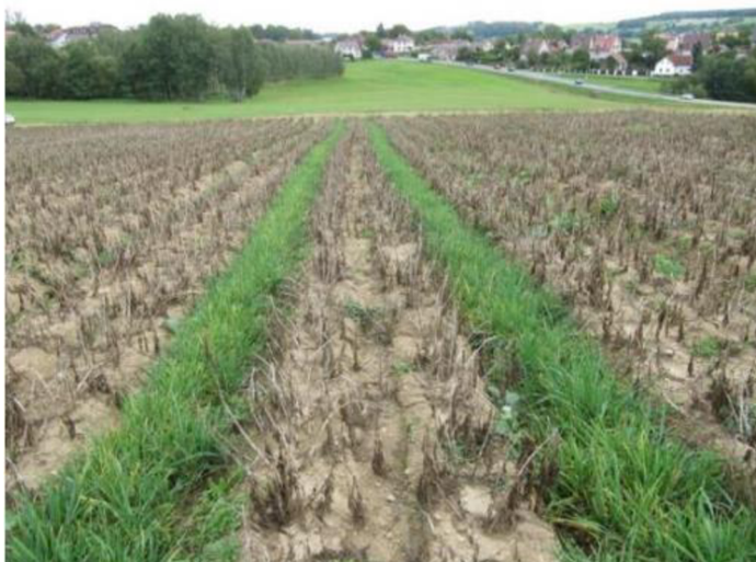
Obrázek 5: Kolejové brázdy oseté pomocnou plodinou (Jiří Záruba)