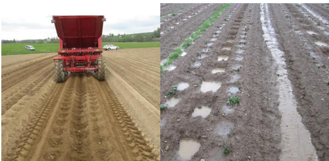
Obrázek 2: Hrázkování a důlkování (Jiří Záruba)

Aby byla technologie hrázkování co nejefektivnější, je důležité, aby řádky byly orientovány ve směru vrstevnic. Dále je doporučeno využívat hrázkování na pozemcích se sklonem do 7 % přičemž délka pozemku by neměla přesáhnout 300 metrů (Janeček 2012).