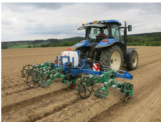
Obrázek 4: Varior 600 kypřič brambor (pal.cz)

Ve spolupráci Výzkumného ústavu bramborářského v Havlíčkově Brodě, Výzkumného ústavu rostlinné výroby v Praze a společnosti P&L Biskupice byl vyvinut speciální kypřič hrůbků, který účinně rozrušuje povrch hrůbků. Tento stroj dále vytváří nebo obnovuje důlky a hrázky v nekolejové brázdě a kypří utuženou půdu na okrajích kolejové brázd, která vzniká po opakovaných průjezdech techniky. Součástí kypřiče je zařízení na aplikaci kapalných minerálních hnojiv, což umožňuje současnou aplikaci přesného množství živin do kořenové zóny rostlin (Růžek a kol. 2018; pal.cz).