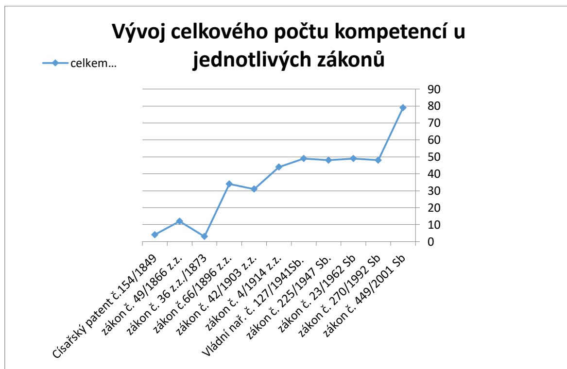
Graf č. 1 – Celkový vývoj kompetencí