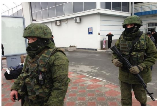
Obr.3: Neoznačení ozbrojenci na Krymu