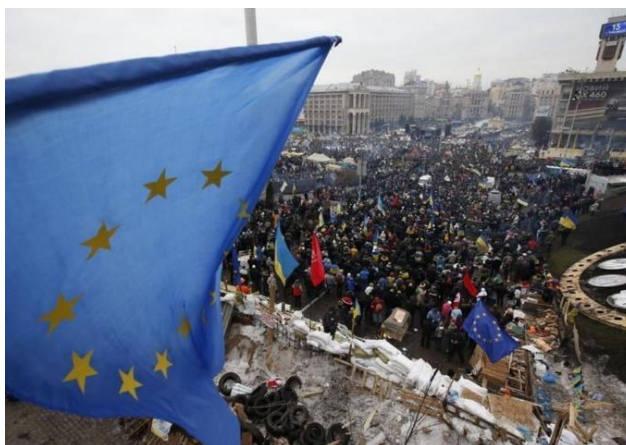
Obr. 2: Události protestů v Kyjevě 2013

Mnoho odborníků tvrdí, že se jednalo také o demonstrativní ukázkou síly za účelem zastrašení demonstrantů. S protesty přišlo na řadu posílení opozičních politiků a zesílení vlivu aktivistů. Dle vyšetřování došlo k zatýkání, únosům a trestům vůči odpůrcům Janukovyče a jeho vlády. (Peisakhin, 2015)