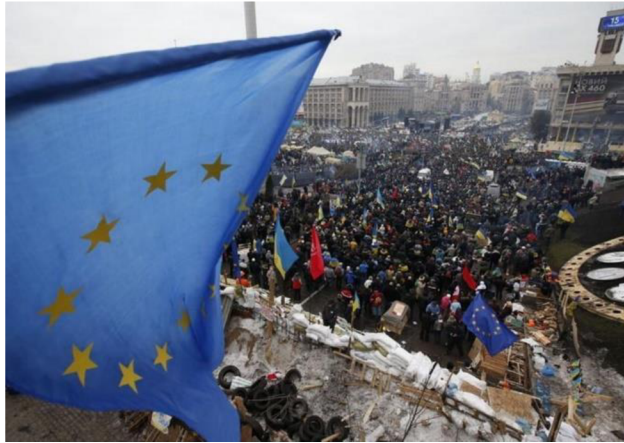
Obr. 2: Události protestů v Kyjevě 2013

Mnoho odborníků tvrdí, že se jednalo také o demonstrativní ukázkou síly za účelem zastrašení demonstrantů. S protesty přišlo na řadu posílení opozičních politiků a zesílení vlivu aktivistů. Dle vyšetřování došlo k zatýkání, únosům a trestům vůči odpůrcům Janukovyče a jeho vlády. (Peisakhin, 2015)