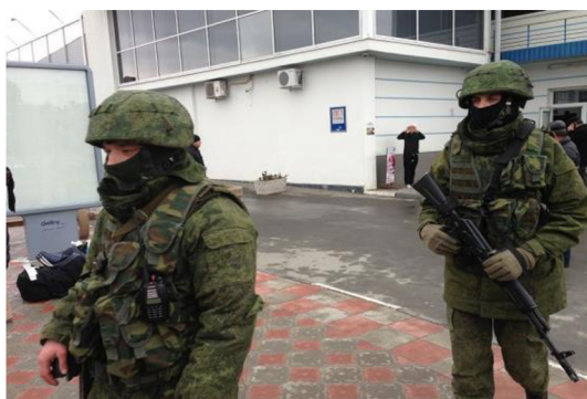
Obr.3: Neoznačení ozbrojenci na Krymu