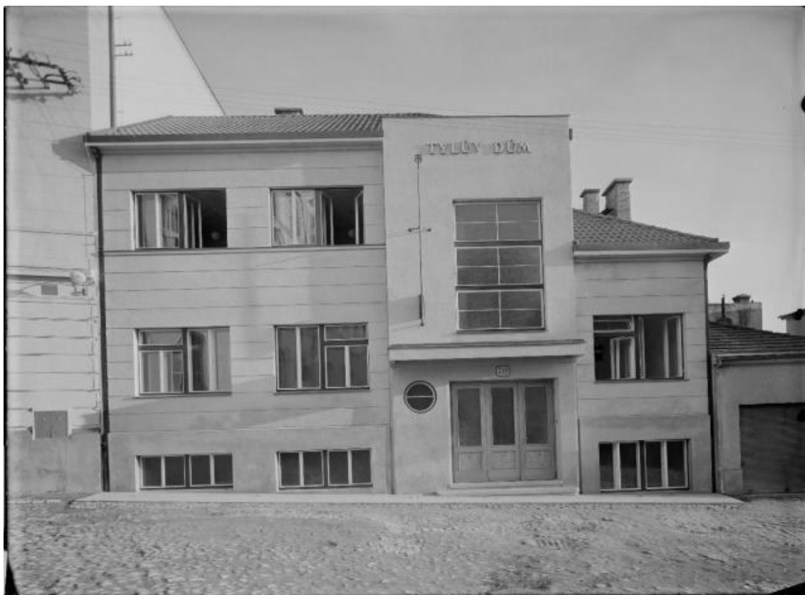
12) Tylův dům postavený v roce 1937 ve funkcionalistickém stylu.