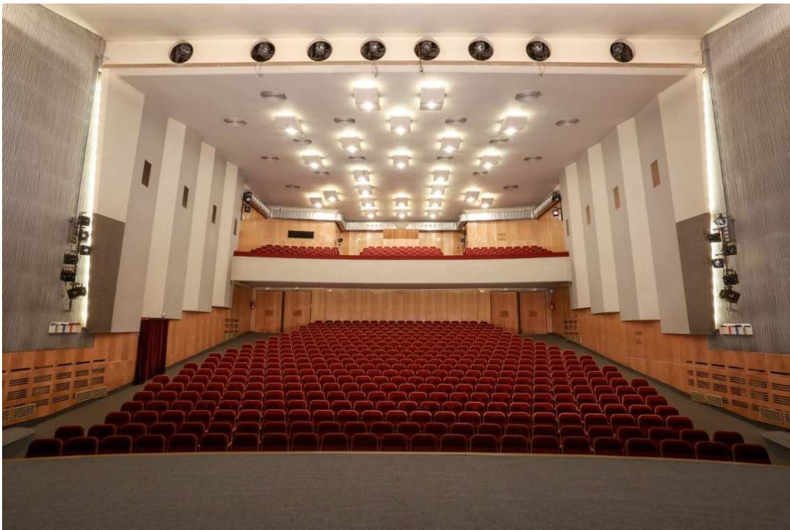
16) Hlediště velkého sálu DON Tábor.