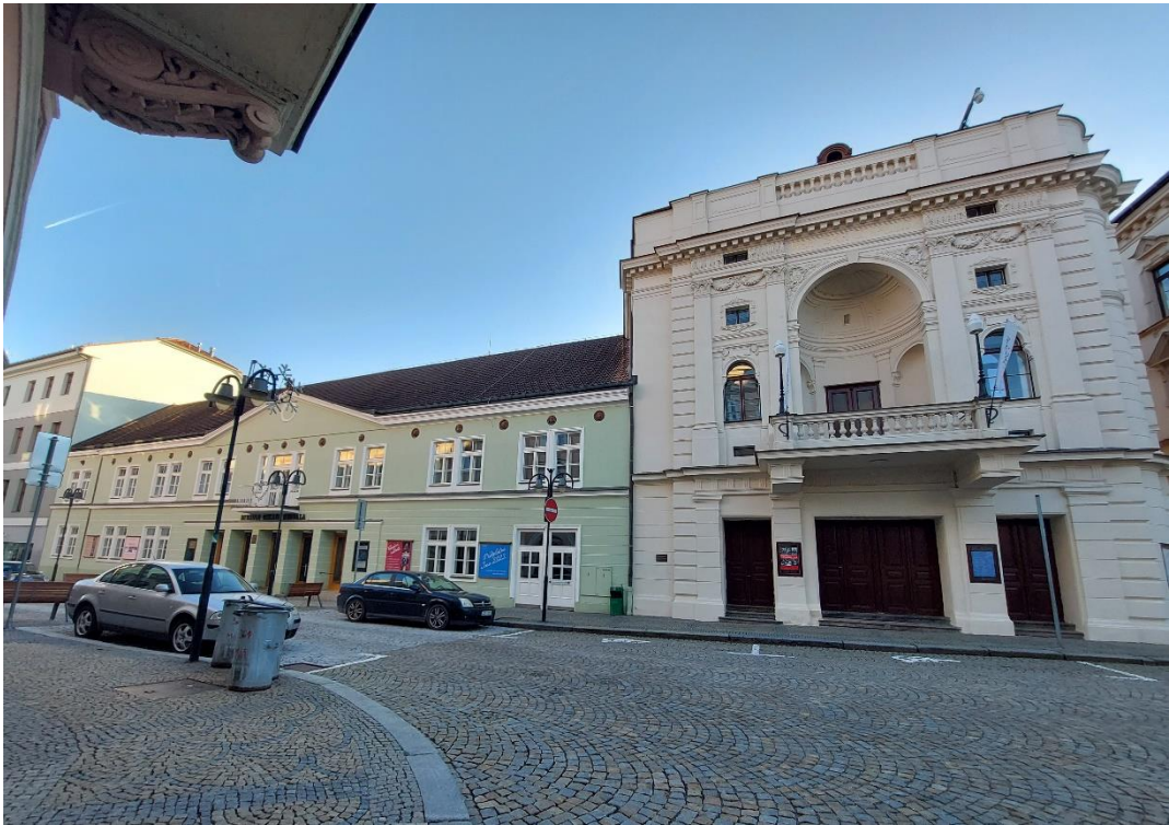
1) Divadlo Oskara Nedbala Tábor dnes.