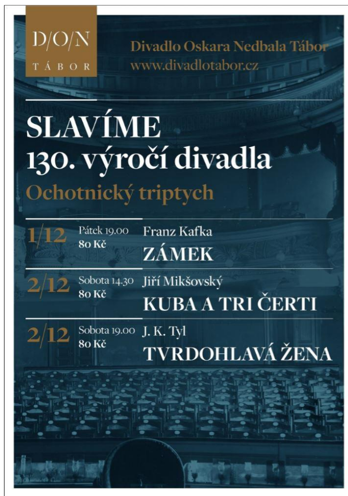
18) Plakát ke 130. výročí oslav DON Tábora.