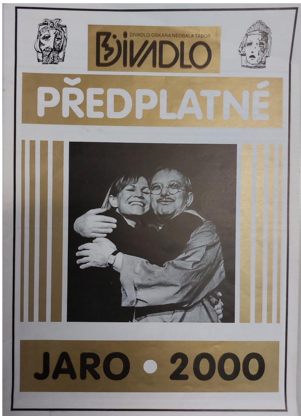
19) Předplatné JARO 2000.