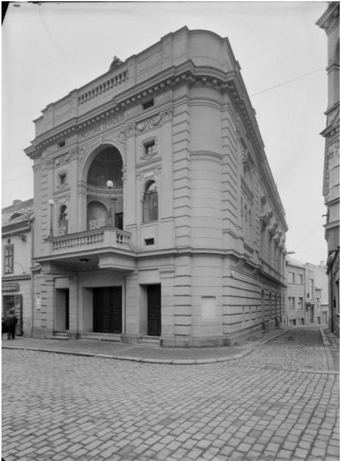
11) Divadlo po stavbě v roce 1937.