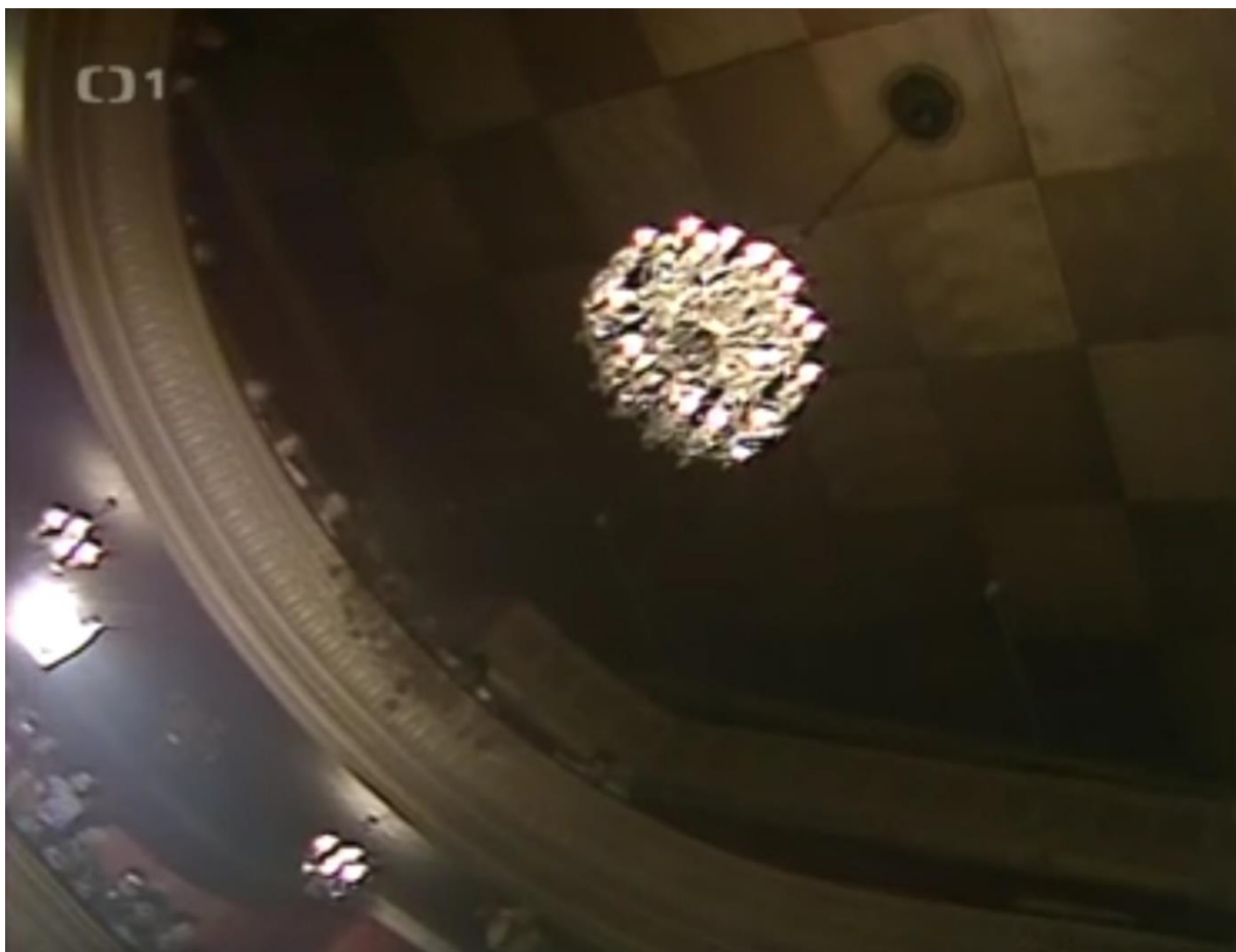
8) Akustické desky na stropě malého sálu DON Tábor, které několik let zakrývaly vyobrazení osmi múz od malíře Šimáka. Múzy byly náhodnou znovuobjeveny při natáčení seriálu Největší z Pierotů .