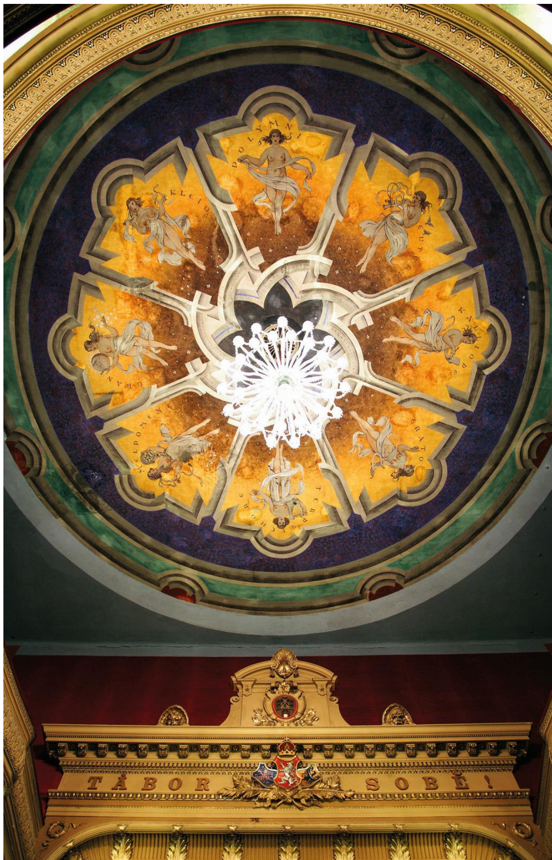
9) Vyobrazení osmi múz na stropě v malém sále DON Tábor.