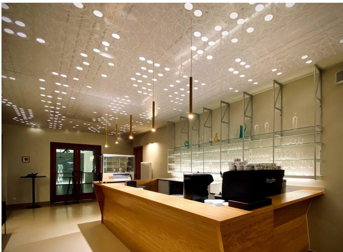
22) Kavárna DON Tábor doplněna o světelný pohled, který ukrývá notový zápis Oskara Nedbala Weihnachtsstimmung . (divadlotabor.cz)