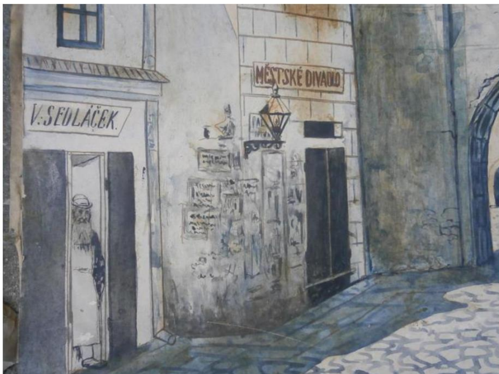
3) Obraz divadla u Pražské brány od malíře Āoupalíka.