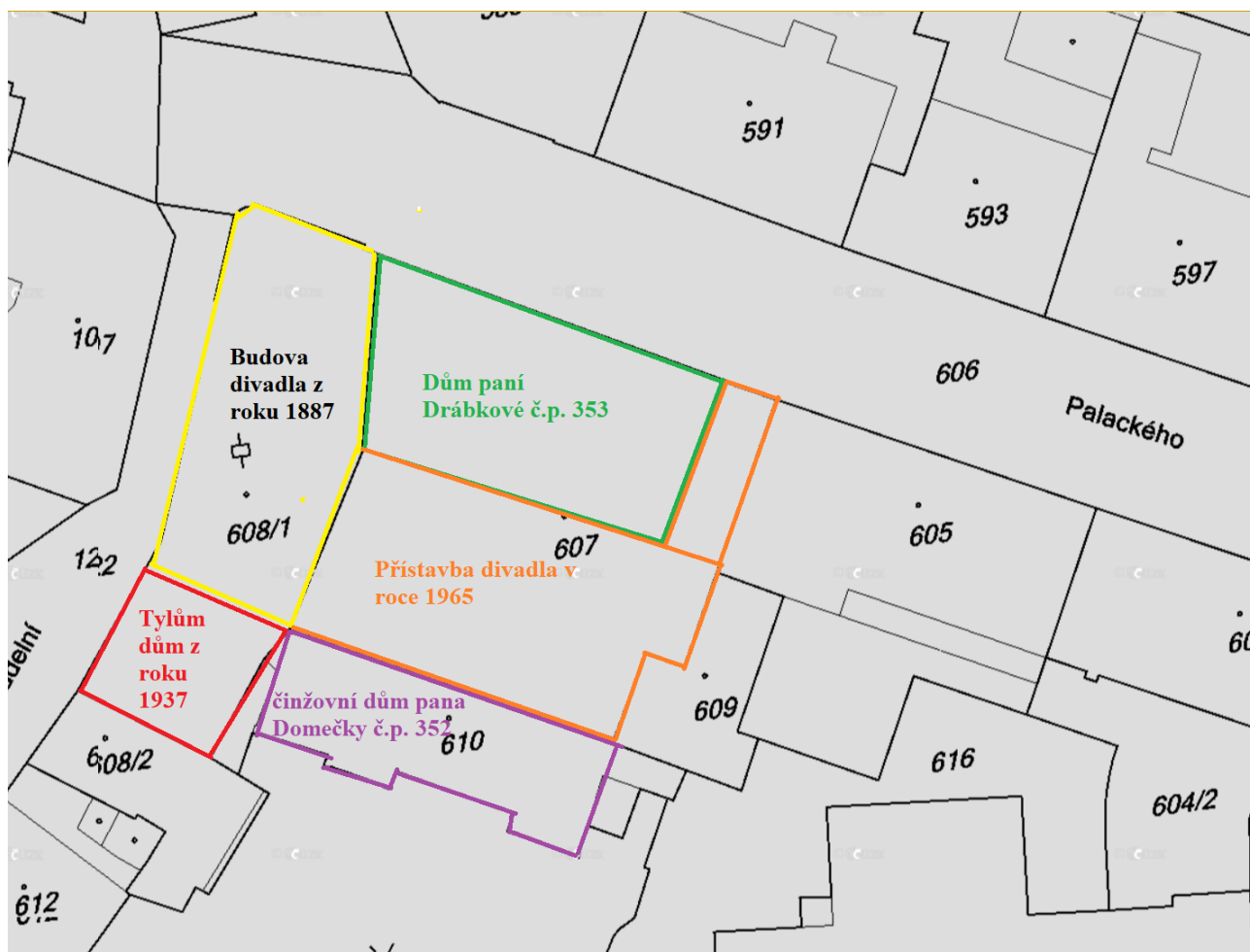
13) Situační plán budov divadla a kolem divadla z druhé poloviny 20. století.