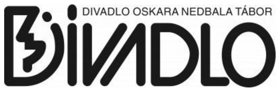
20) Staré logo DON Tábor.