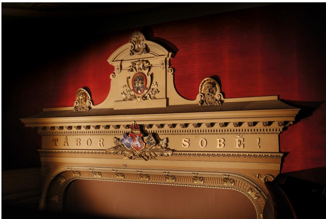
5) Nápis „Tábor sobě" v malém sále DON Tábor.