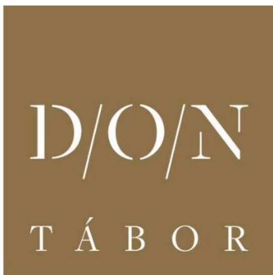
21) Nové logo DON Tábor.