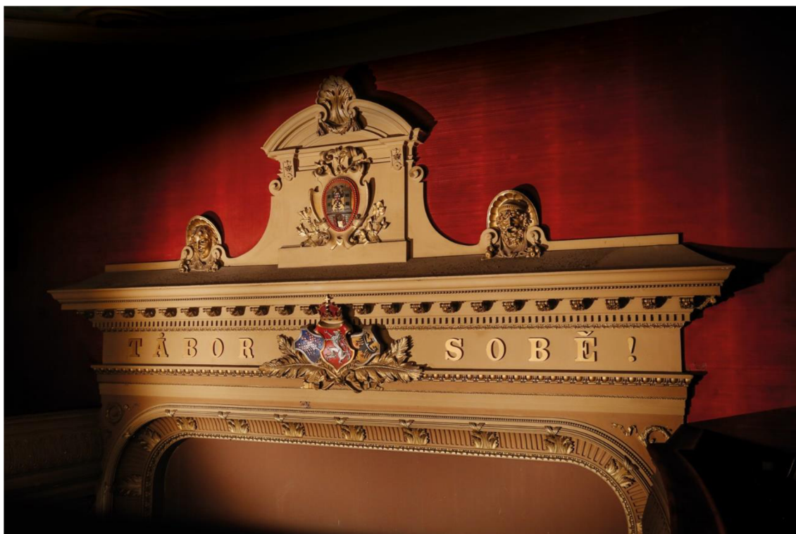
5) Nápis „Tábor sobě" v malém sále DON Tábor.