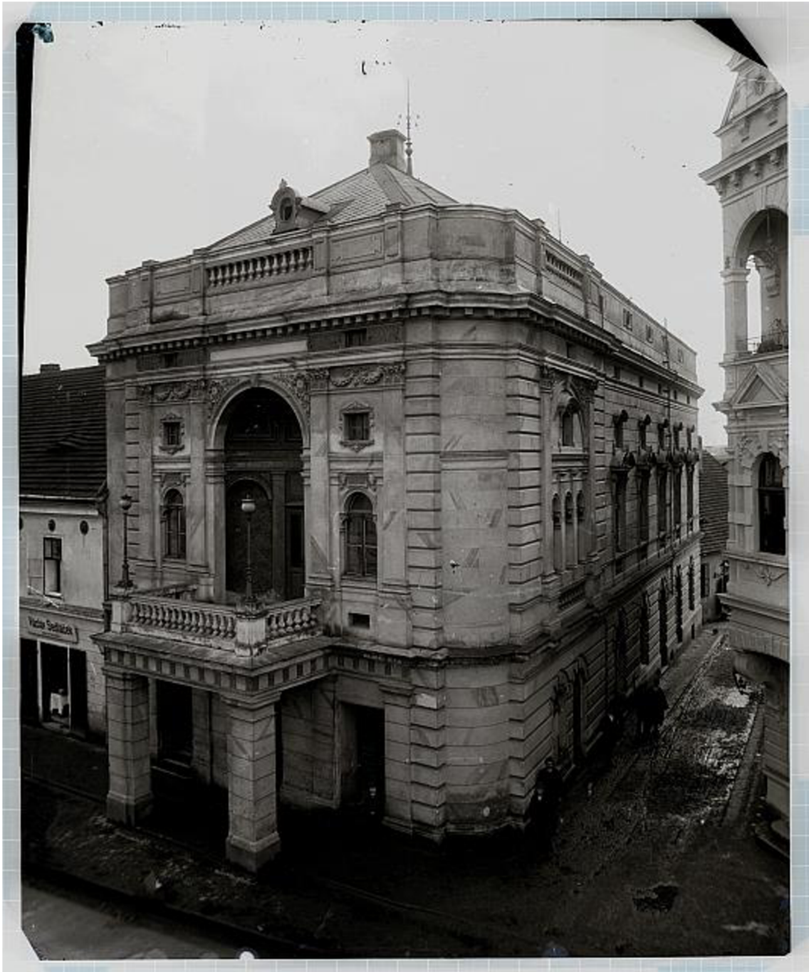
10) Městské divadlo Tábor z roku 1887.