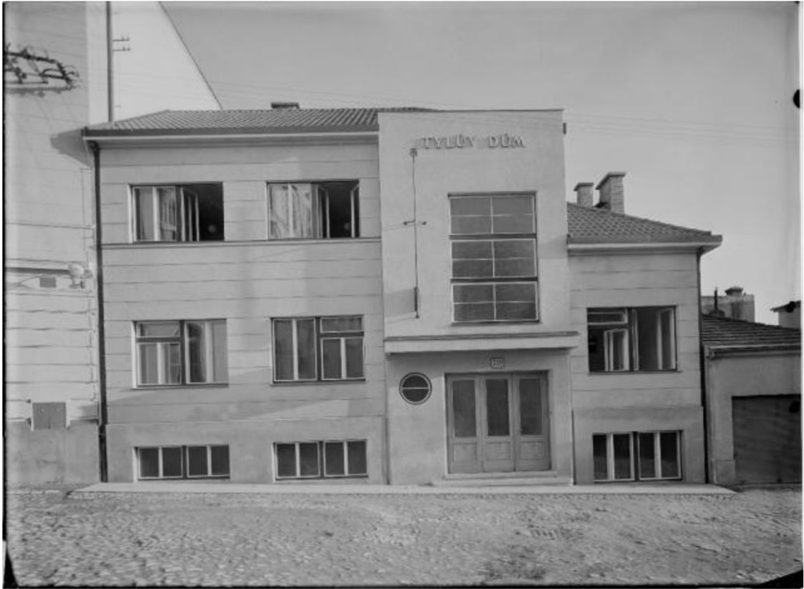
12) Tylův dům postavený v roce 1937 ve funkcionalistickém stylu.