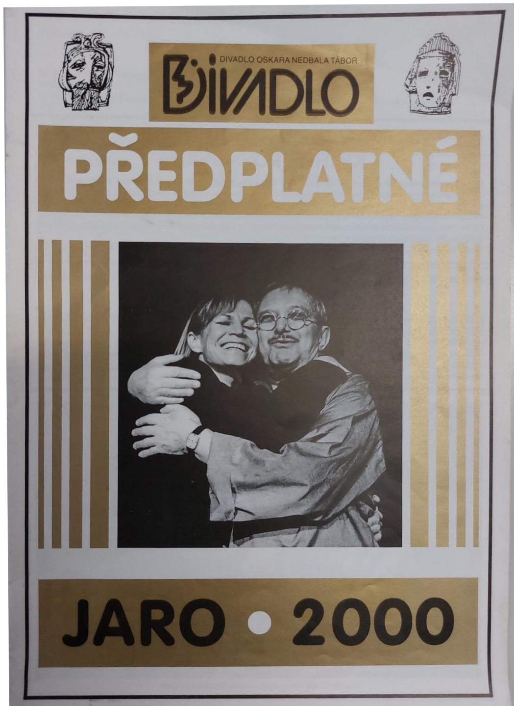
19) Předplatné JARO 2000.