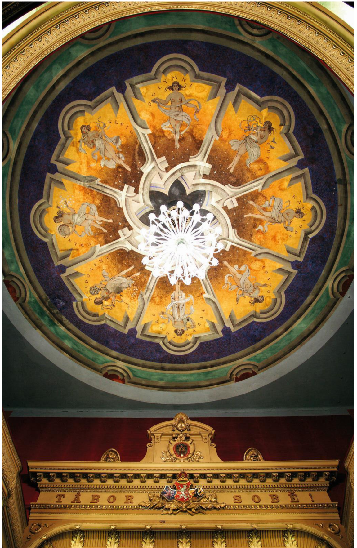
9) Vyobrazení osmi múz na stropě v malém sále DON Tábor.