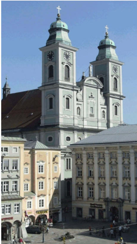
10. Starý dóm v Linci – jezuitský kostel sv. Ignáce z Loyoly