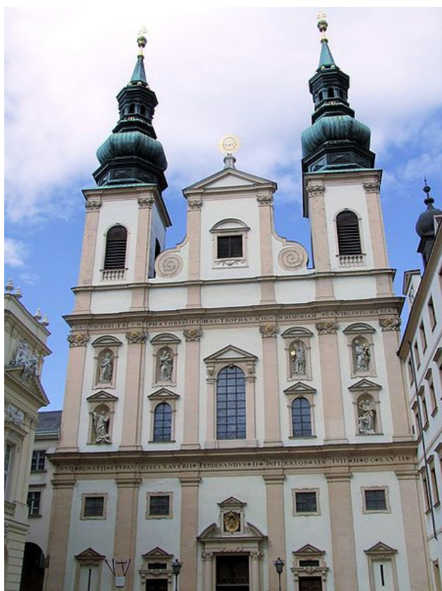
7. Jezuitský univerzitní kostel Nanebevzetí Panny Marie ve Vídni