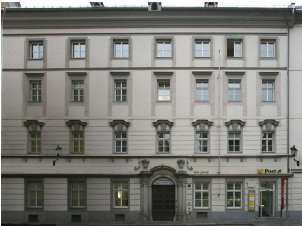
11. Bývalá jezuitská kolej v Linci, Domgasse 1, dnes pošta