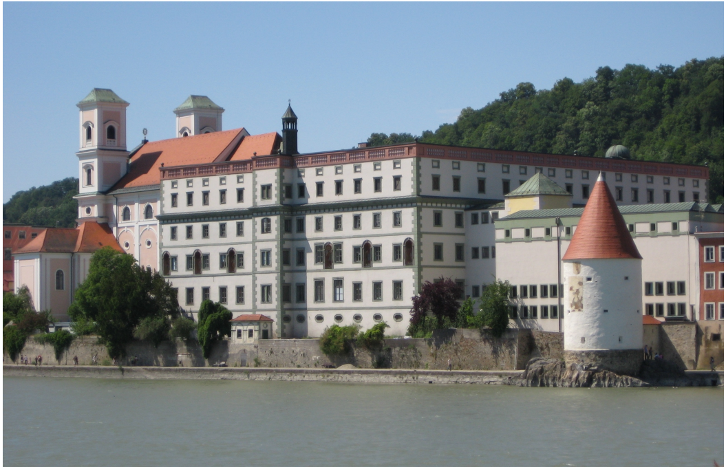
12. Kostel sv. Michaela a komplex bývalé jezuitské koleje v Pasově, dnes gymnázium