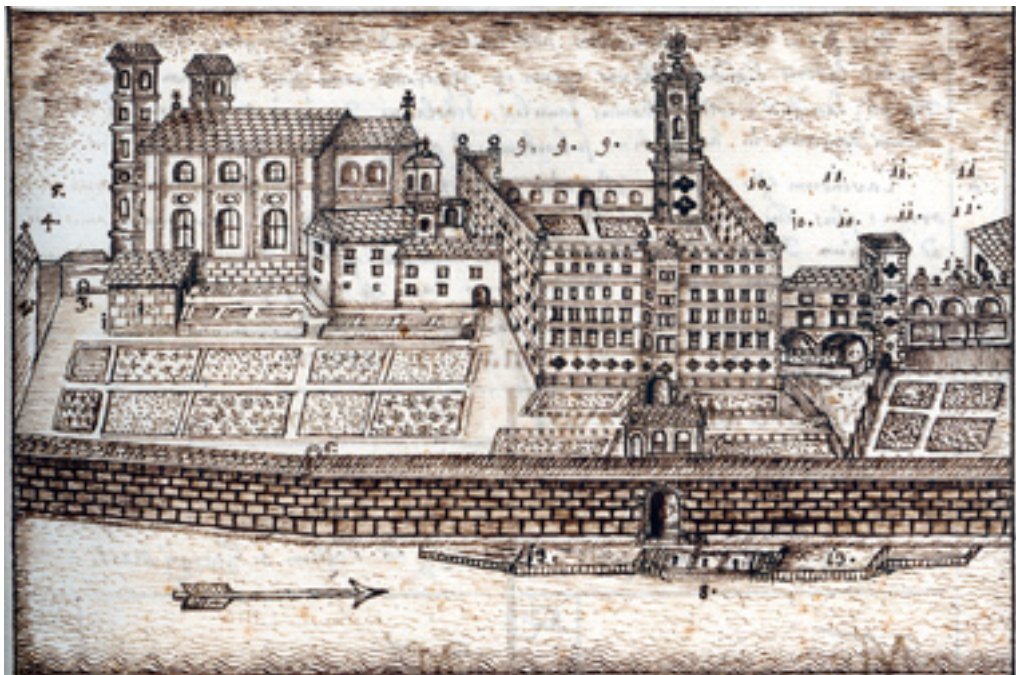
13. Dobový pohled na jezuitský areál v Pasově