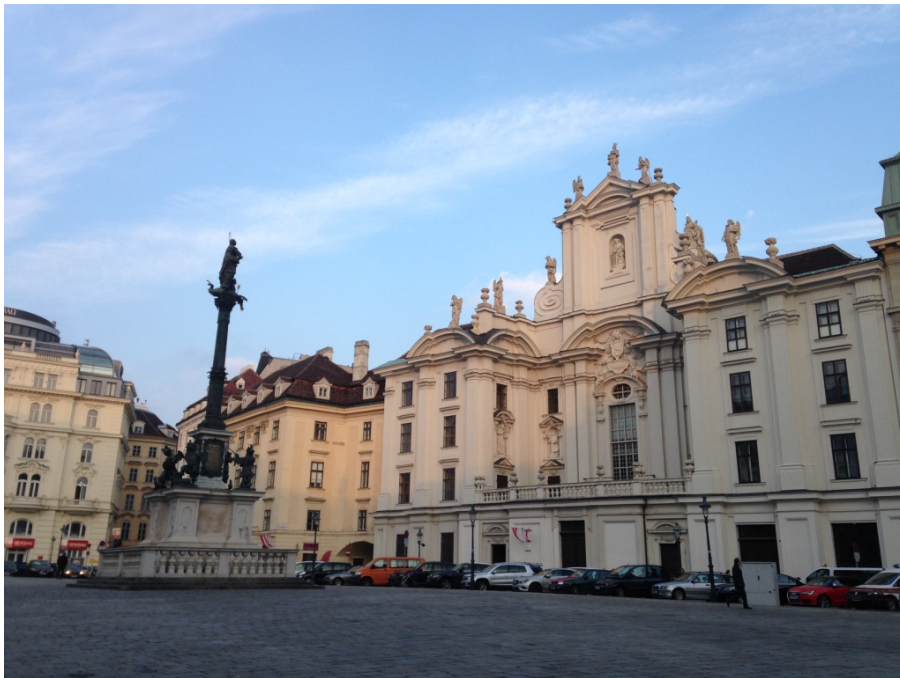
8. Vídeň, náměstí Am Hof, jezuitský kostel Devíti kůru andělských