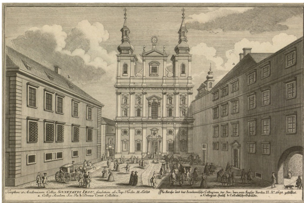
6. Jezuitský univerzitní kostel Nanebevzetí Panny Marie ve Vídni (vzhled po přestavbě z roku 1703) s budovou jezuitské koleje po pravé straně, rytina Salomona Kleinera z roku 1724