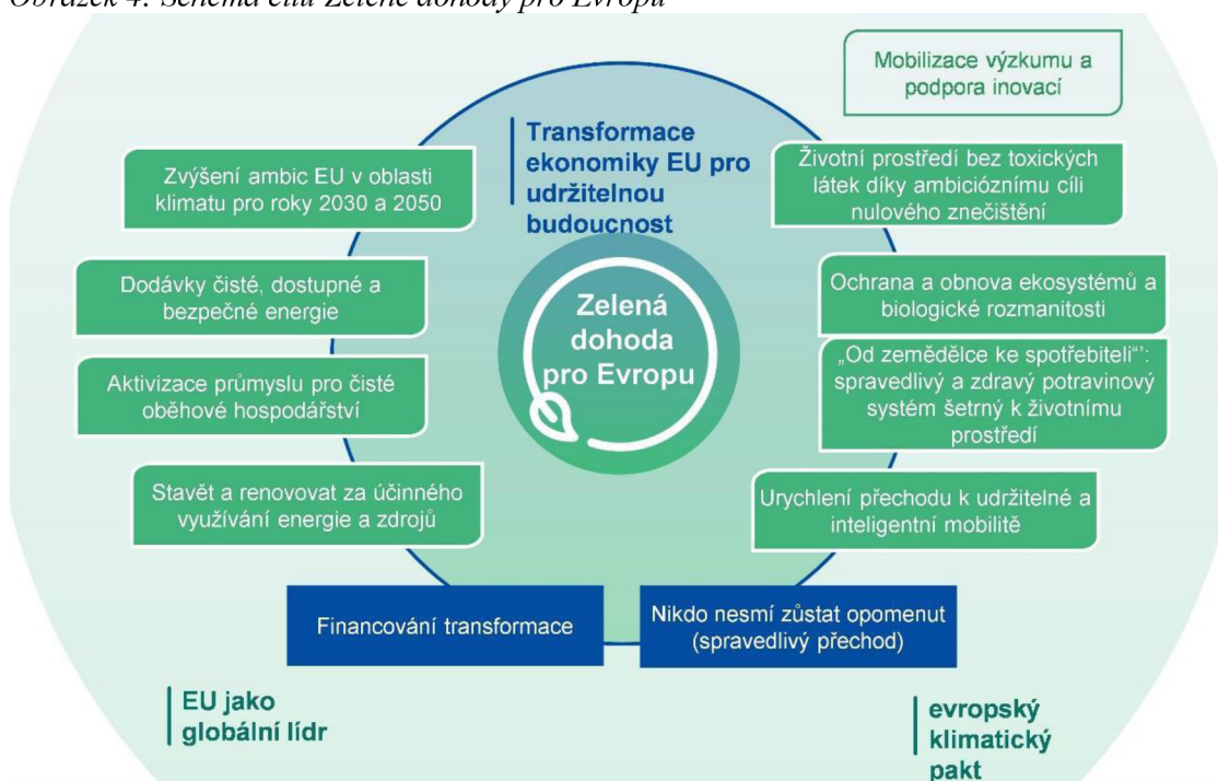
Obrázek 4: Schéma cílů Zelené dohody pro Evropu

Téma Zelené dohody pro Evropu je aktuální již třetím rokem. Současná předsedkyně Evropské komise se již v době své kandidatury netajila tím, že enviromentální politika a změna klimatu jsou pro ni prioritami. A tak již desátý den ve svém úřadu představila sdělením Evropské komise Zelenou dohodu pro Evropu. V tomto sdělení byla Dohoda popsána jako nová strategie růstu EU s cílem transformace celku na spravedlivou a prosperující společnost s moderní a zároveň konkurenceschopnou ekonomikou, která si dává za cíl efektivně využívat zdroje, přičemž v roce 2050 má za cíl vykazovat nulovou produkci skleníkových plynů. Celkem tato Dohoda vymezuje osm oblastí a kroky, které by v souvislosti s nimi měla EU podniknout při cestě za udržitelnou a ekologickou evropskou ekonomikou. Těmito oblastmi jsou konkrétně ochrana klimatu pro rok 2030 a 2050, čistá a dostupná energie, oběhové hospodářství, ochrana biodiverzity a inteligentní mobilita (Evropská komise, 2019).