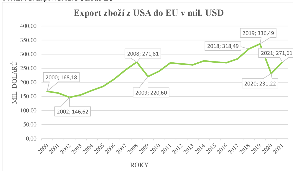
Obrázek 2: Export zboží z USA do EU