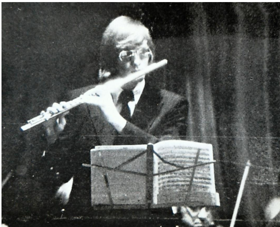
Příloha č. 13: S. Bubnov (SSSR), foto z roku 1977. 66