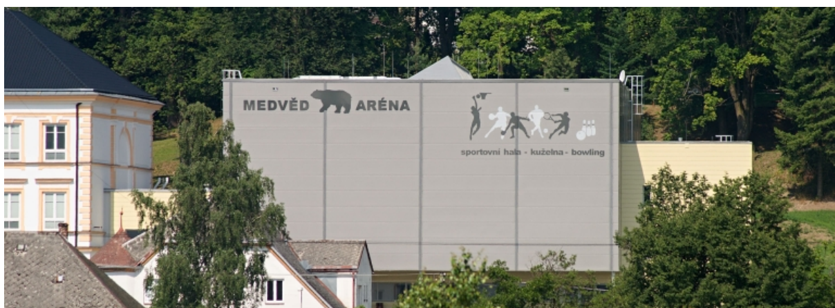
Obr. 3 Medvěd aréna Moravský Beroun 47