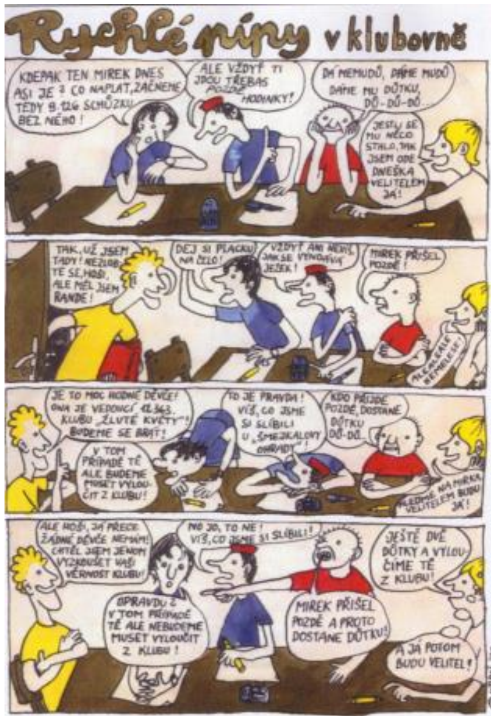
Obr. 2. Ukázka ze seriálu Rychlé pípy v klubovně (Dvorský Miloš, 2010)