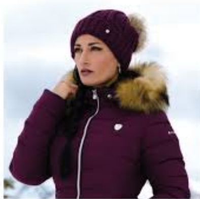
L'image 31 : Bonnet cavalier