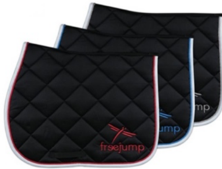
L'image 5: Tapis de selle