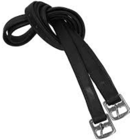
L'image 32 : Étrivières