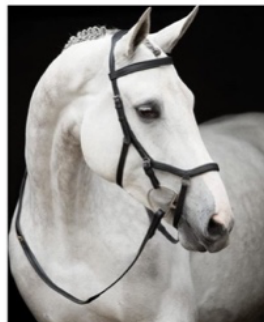
L'image 9 : Bridon cheval