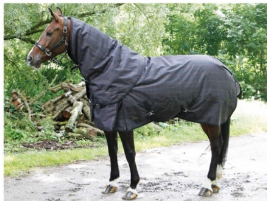
L'image 19 : Couverture imperméable