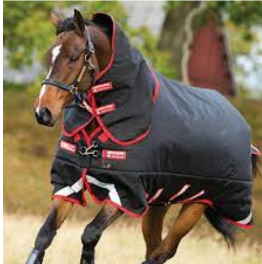
L'image 24 : Couverture extérieure