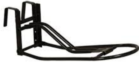
L'image 36 : Porte-Selle