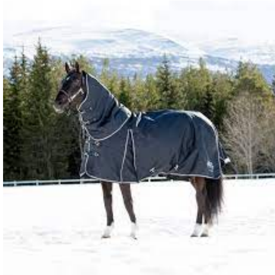
L'image 18 : Couverture hiver