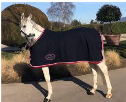
L'image 25 : Couverture séchante