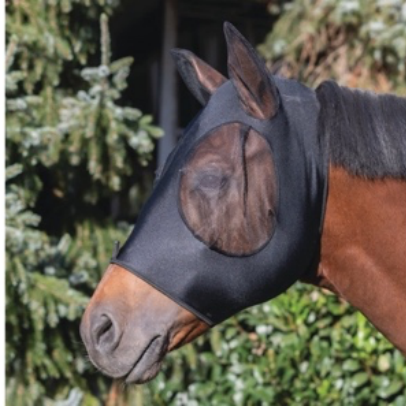
L'image 3 : Masque Anti-Mouche cheval