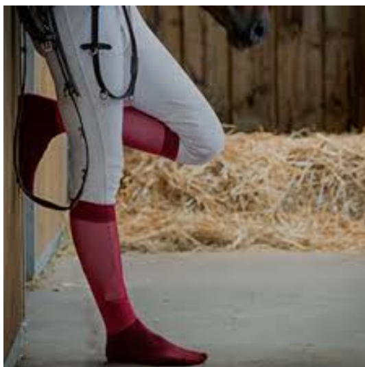
L'image 28 : Chaussettes cavalier