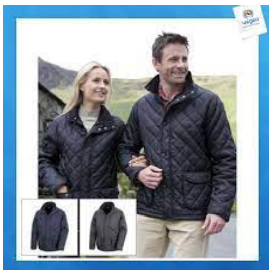
L'image 34 : Veste équitation