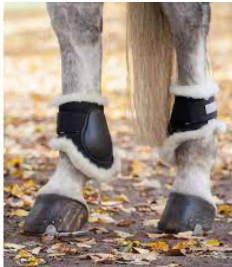
L'image 11 : Protège boulets