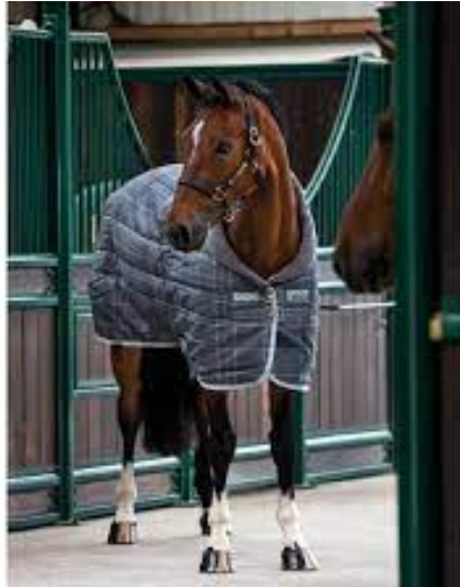
L'image 20 : Couverture box et écurie