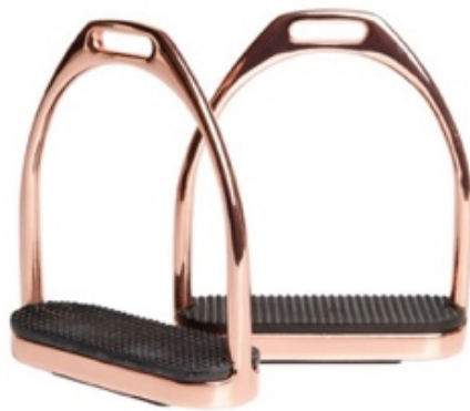
L'image 2 : Étriers