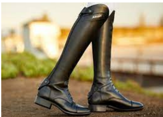
L'image 29 : Boots équitation