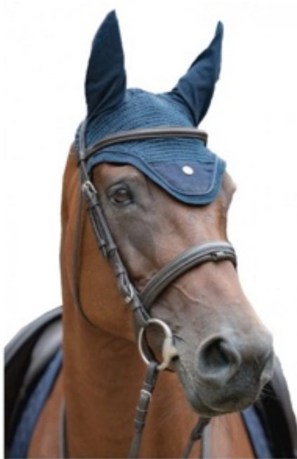
L'image 4 : Bonnet cheval