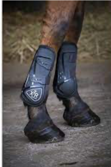
L'image 10 : Guêtre cheval