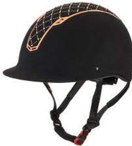
L'image 27 : Casque équitation

L'équipement équestre de base pour les cavaliers :