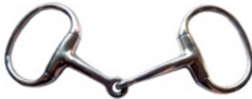
L'image 8 : Mors Cheval