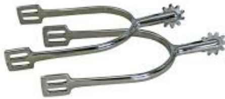
L'image 33 : Eperons