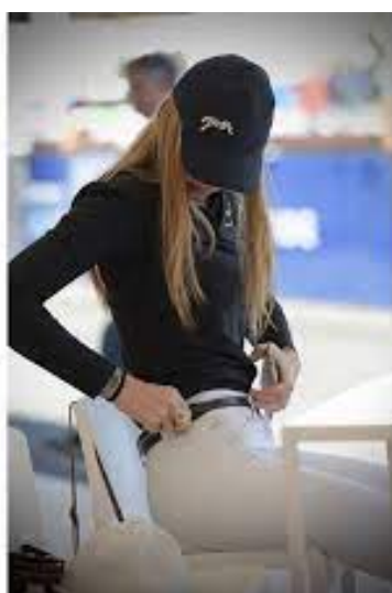
L'image 35 : Casquette équitation