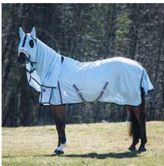
L'image 23 : Couverture anti-insectes