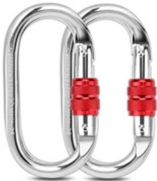
L'image 17 : Mousqueton