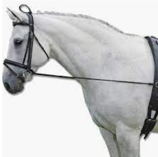
L'image 16 : Enrênements équitacion