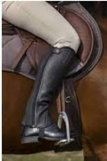
L'image 37 : Chaps/ minichaps équitation