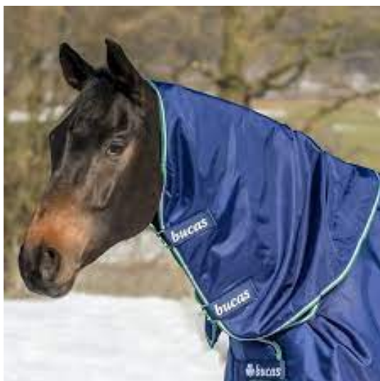
L'image 22 : Couvres-cou et camails