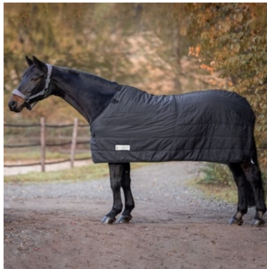
L'image 21 : Sous-couverture