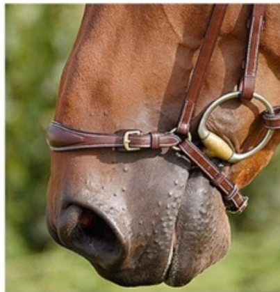
L'image 15 : Muserolle cheval