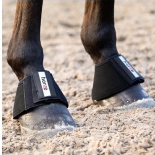
○ L'image 12 : Cloches pour cheval