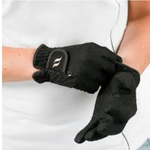
L'image 30 : Gants équitation