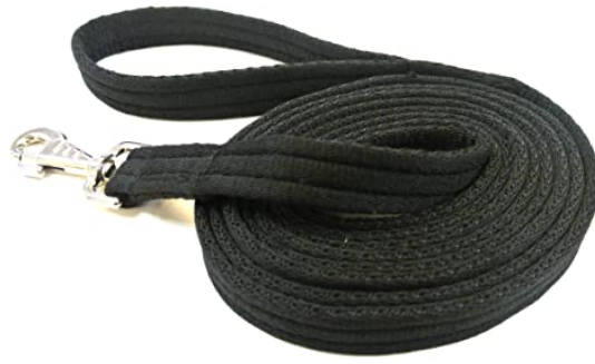
L'image 7 : Longes pour le cheval