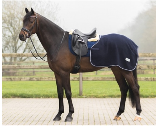
L'image 26 : Couvre reins

L'équipement équestre de base pour les cavaliers :