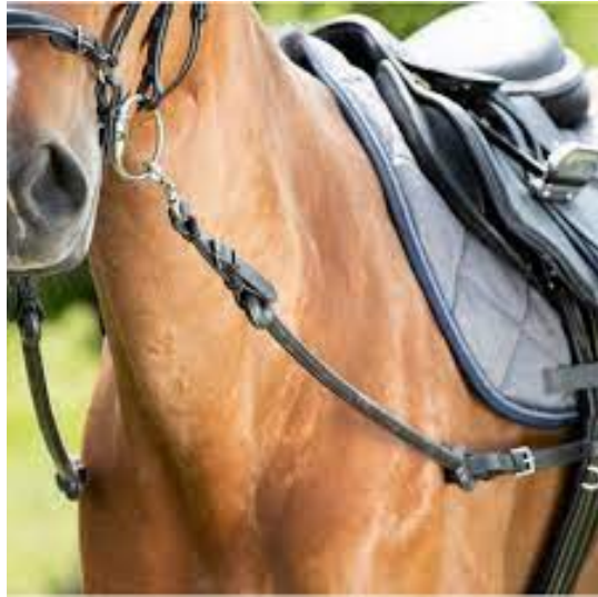
L'image 14 : Rênes cheval