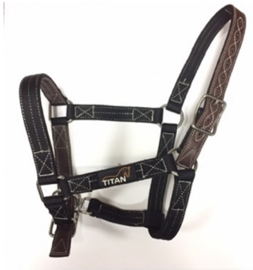
L'image 1 : Licol cheval

L'équipement équestre de base pour les chevaux :