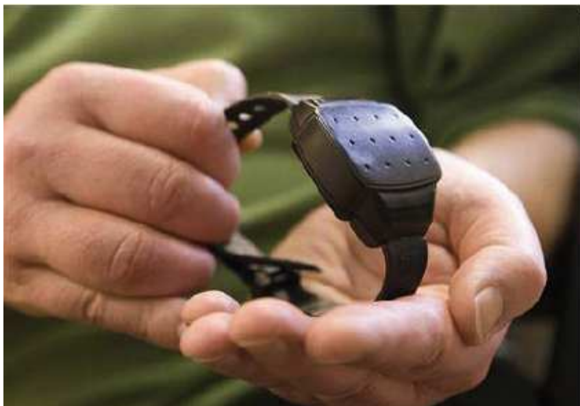
Obrázek č. 1 : Elektronický kontrolní systém – „náramek“ pro odsouzeného