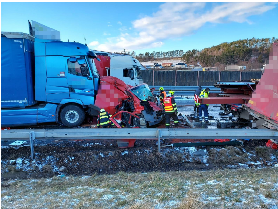
Obrázek č. 2 – HZS při zásahu o hromadné dopravní nehody na dálnici D5. 48

Po vyhlášení poplachu vyjela jednotka Slaný s evakuačním autobusem CROSSWAY na místo dopravní nehody na dálnici D5. Po příjezdu na místo události v 12:38 se jednotka nahlásila veliteli zásahu a provedla průzkum místa dopravní nehody. Jednotka ustavila autobus na bezpečném místě poblíž dopravní nehody a provedla přípravu na výdej nápojů a dek pro účastníky dopravní nehody. Zasahující jednotky požární ochrany doprovázeli osoby do připraveného autobusu, kde jednotka Slaný zajistila tepelný komfort pro osoby zasažené dopravní nehodou. V autobuse bylo celkem evakuovaných 15 – 20 osob. Autobus byl k dispozici na místě události po celou dobu zásahu. Po opuštění posledních osob z autobusu byla jednotka Slaný po konzultaci s VZ vrácena v 19:24 zpět na základnu.