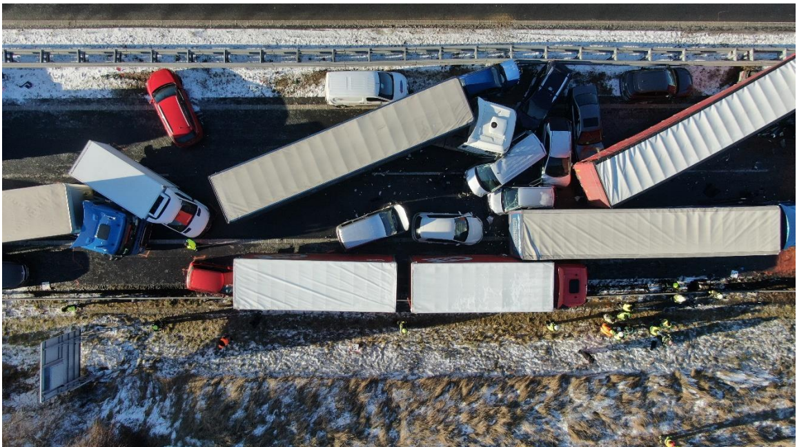
Obrázek č. 1 – Snímek dopravní nehody na dálnici D5.

Na místo události se taktéž dostavila tisková mluvčí HZS pro střeđočeský kraj, která zajistila komunikaci s médii a předávání informací k mimořádné události.