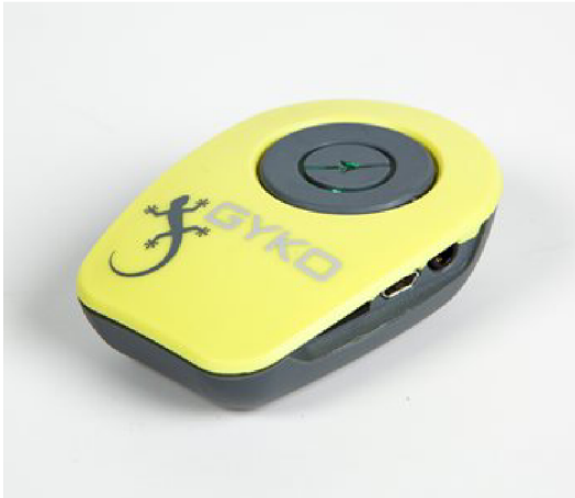
Obrázek 2. Měřicí přístroj Gyko, zdroj: www.gyko.it

Gyko lze použít např. v kombinaci s Optojumpem Next nebo je možné jej použít i samostatně.