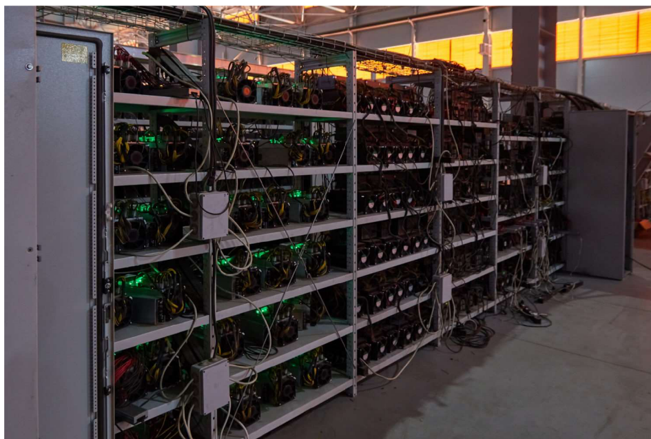
Obrázek 3 Regál plný ASIC minérů těžících Bitcoin

miner napájecí zdroj. Dalším příslušenstvím je PDU, tedy jednotka pro distribuování elektřiny. Využívá se hlavně v regálech, ve kterých se nachází více ASIC minérů. Aby zařízení mohlo těžit kryptoměnu, musí být připojené k internetu. Tento problém je řešen pomocí ethernet portu, do kterého lze zapojit UTP kabel. Ovládat ASIC zařízení lze pomocí počítače, notebooku nebo chytrého telefonu, jedinou podmínkou je, aby zařízení bylo připojené na stejné LAN síti jako ASIC (Bain & Kent, 2022, s. 175-181).