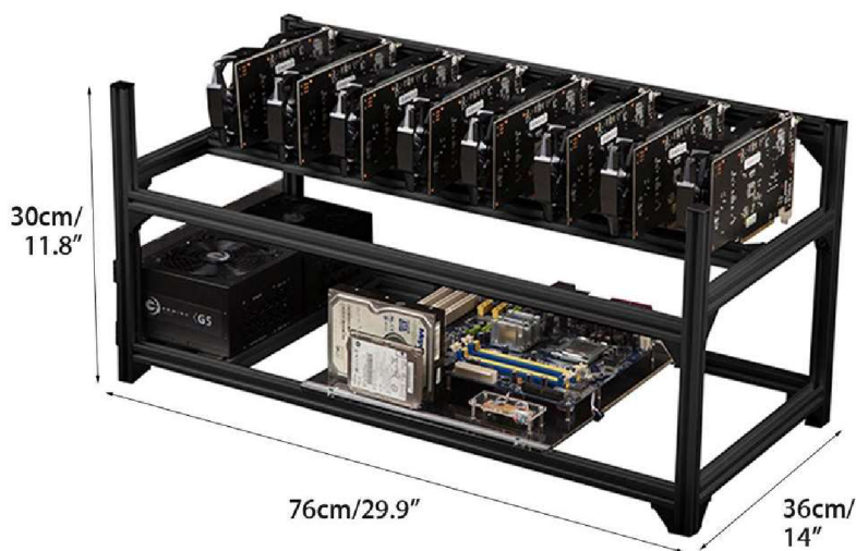
Obrázek 2 Těžební rig

Nejčastěji se pro těžbu pomocí grafických karet využívají tzv. těžařské rigy (mining rigs), na které je většinou umístěno od 6 do 12 grafických karet. Typický stolní počítač obvykle nabízí místo pro jednu nebo v některých případech i tři grafické karty. Těžařský rig, kromě již zmíněných GPU, obsahuje mnoho podobných komponentů jako má klasický stolní počítač, například základní desku, centrální procesor, operační paměť, napájecí zdroj, pevný disk, ventilátor a v neposlední řadě klávesnici, myš a monitor. Všechny tyto součásti jsou umístěny do speciálně upraveného rámu pro těžení kryptoměny. Ten na rozdíl od klasické PC skříně nabízí větší odvod tepla a dostatek prostoru pro umístění většího počtu grafických procesorů. Některé rámy nabízejí i možnost připojení dalšího rámu nebo namontování do racku počítačového serveru. Na obrázku 3 lze vidět vizuální příklad toho, jak vypadá těžební rig (Bain & Kent, 2022, s. 185-187).