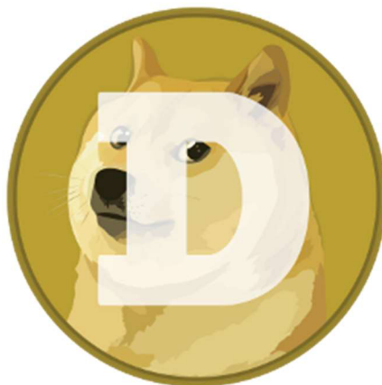
Obrázek 4 Logo Dogecoinu

síť a s open-source zdrojovým kódem. Jelikož byl Litecoin odvozen z Bitcoinu. Dogecoin je decentralizovaný, využívá technologii blockchain a algoritmus Scrypt (Dogecoin, 2023).