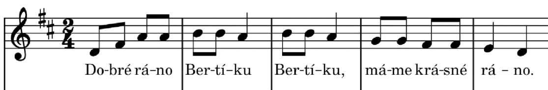
Obrázek 2 : Píseň „Dobré ráno Bertíku“.

Použitá literatura: JURKOVIČ, Pavel. Od výkřiku k písničce . 2012. Praha: Portál, 2012. ISBN 978-80-7367-750-3., str. 19