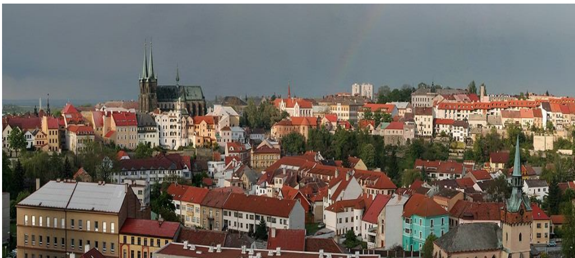
Obr. 3: Pohled na současnou Chrudim