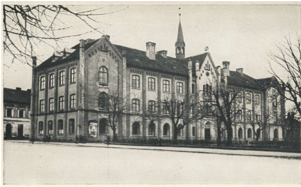
Obr. 5: Pohled na druhou budovu Gymnázia ve 30. letech 20. století ( Základní škola Chrudim, Školní náměstí [cit. 2012-03-27]. Dostupné na WWW: < http://www.zs-skolni-namesti.cz/o-skole/historie/ >.)