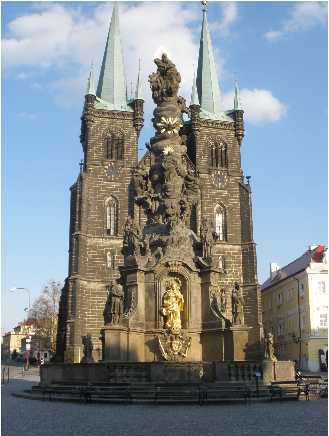
Obr. 8: Morový sloup a kostel Nanebevzetí Panny Marie na Resselově náměstí v Chrudimi