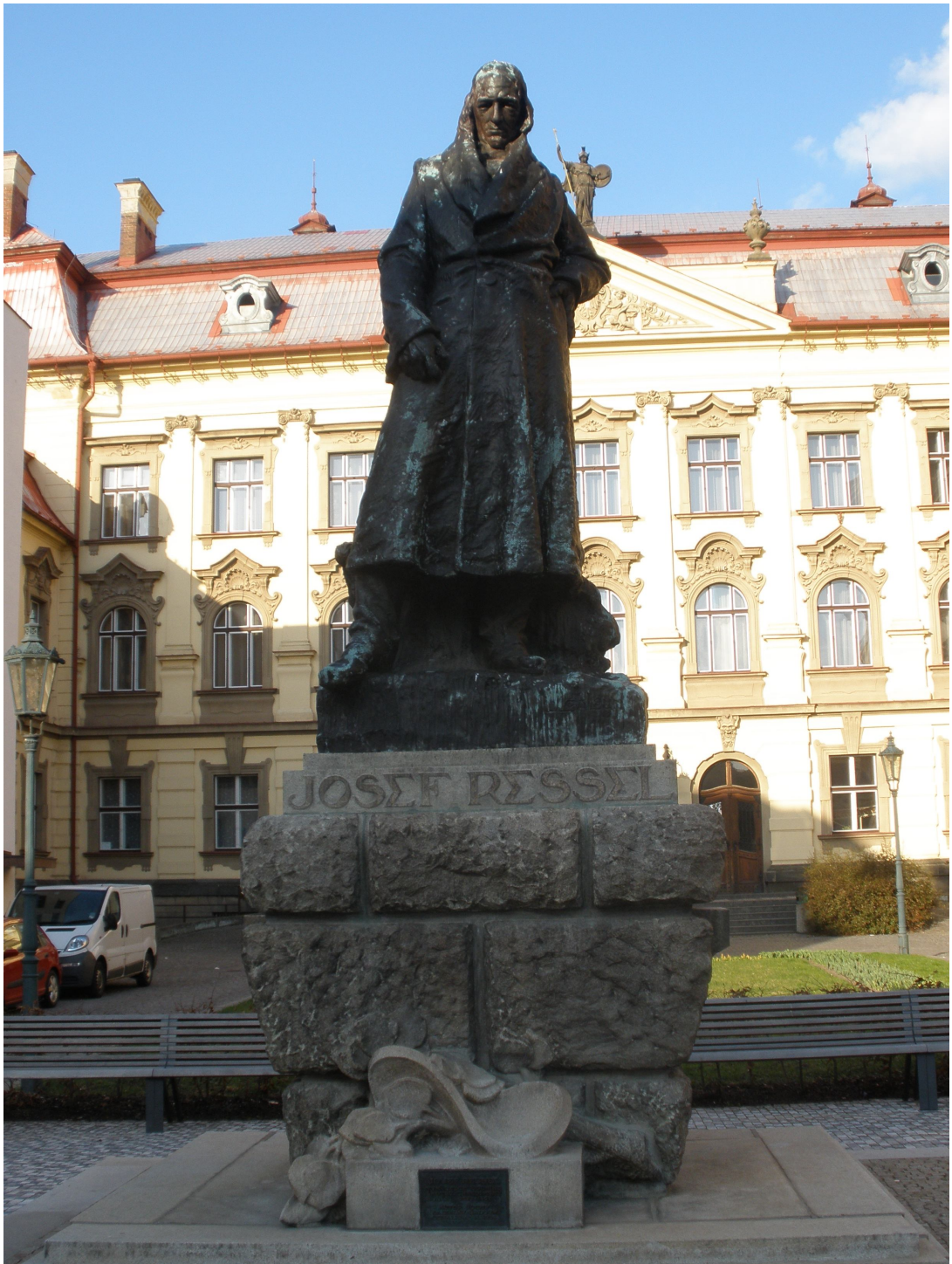
Obr. 9: Socha Josefa Ressela v Chrudimi (foto: archiv autora)