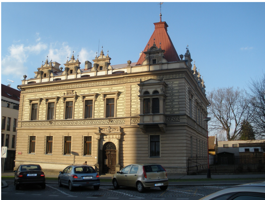
Obr. 6: Bývalá budova Odborné školy pro zpracování dřeva