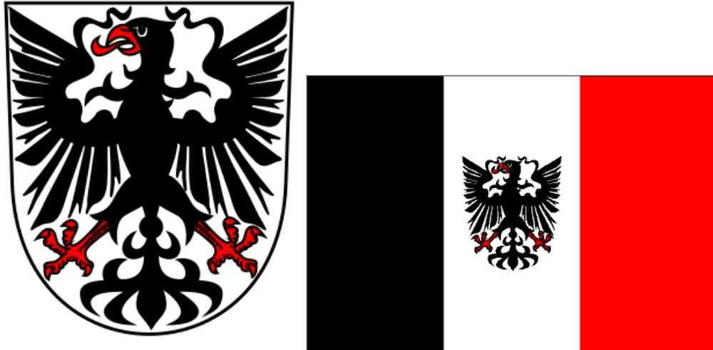
Obr. 4: Znak a prapor města Chrudimi (KOBETIČ, P., PAVLÍK, T., ŠULC, I. a kol., c. d., str. 129.)