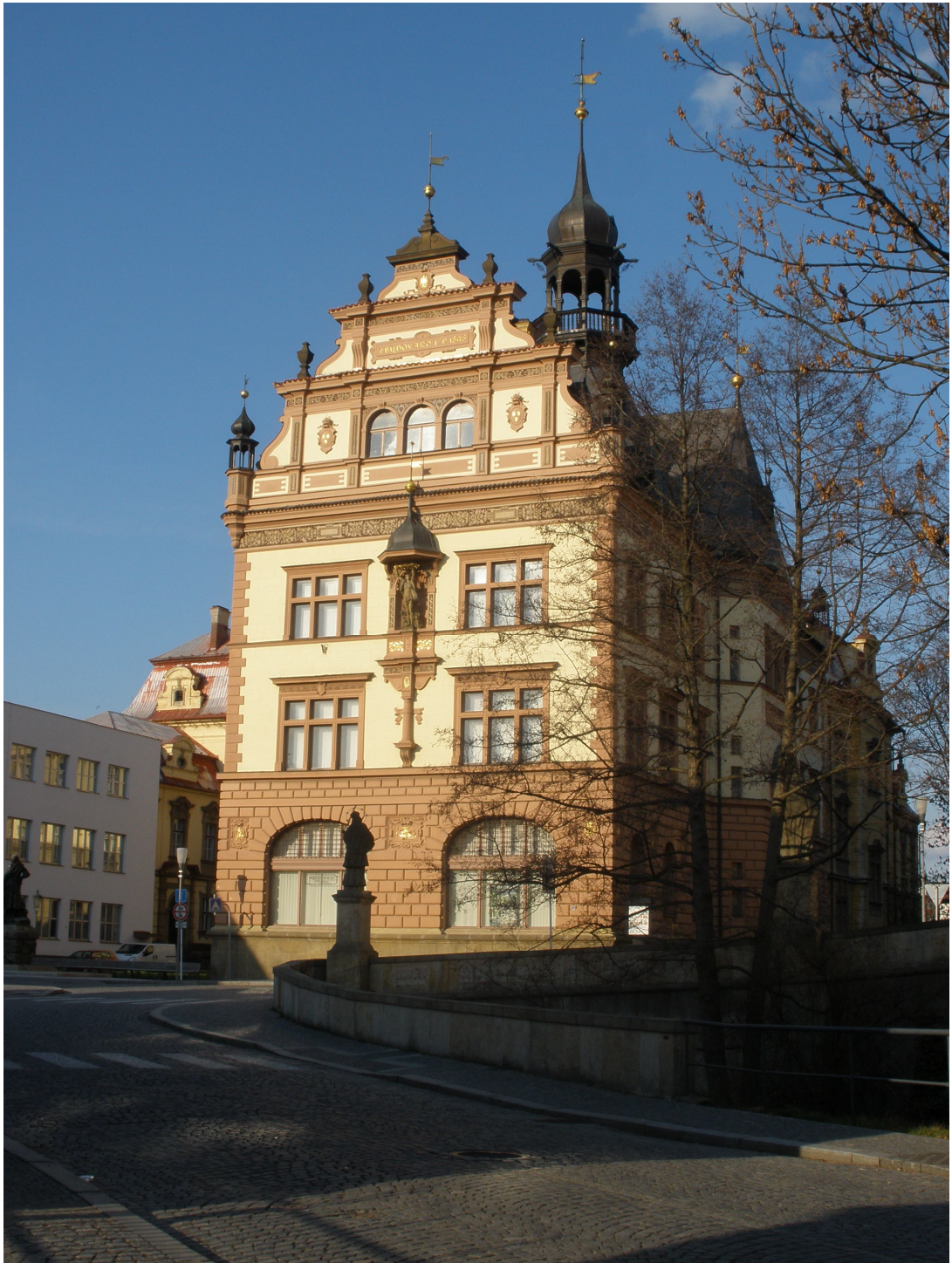
Obr. 10: Budova Regionálního muzea v Chrudimi