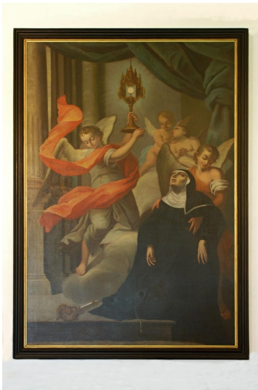
Obr. č. 7, J. K. Handke (?), svatá Klára z kostela opavských minoritů