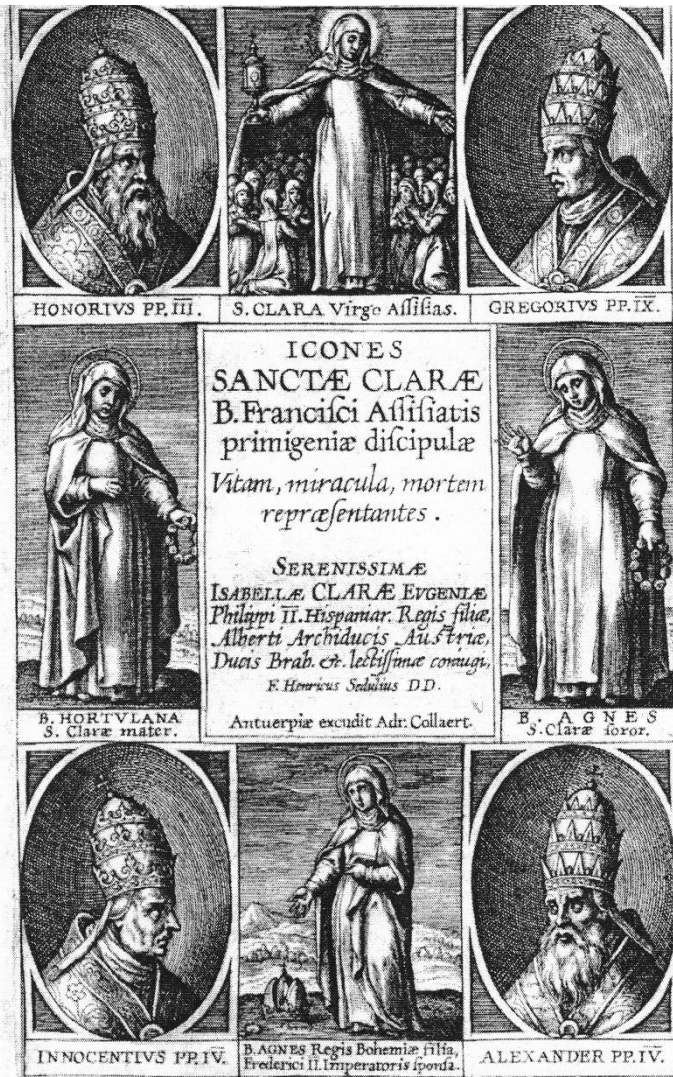
Obr. č. 2, titulní list tisku ICONES SANCTÆ CLARÆ

Převzato z E-knihy publikované books.google.com, citováno 13. 2. 2014