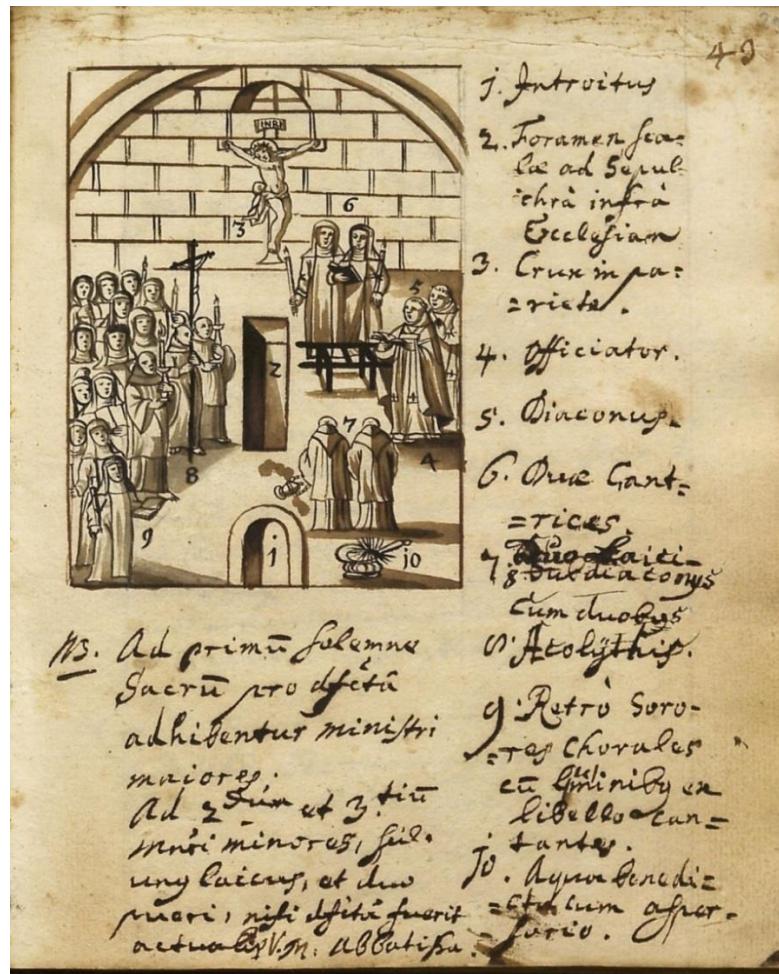
Obr. č. 1, shromáždění františkánů a klarisek z chebského kláštera při pohřebních obřadech

NKP, Cheb MS. 156, Confessarius Caeremoniis Clarissarum, s. 43 (novodobá paginace s. 29).