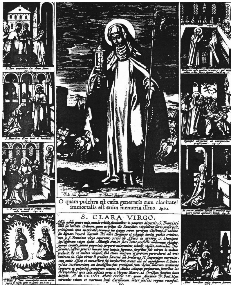
Obr. č. 4, sv. Klára na listu uvádějícím její životopis v tisku Historia seraphica