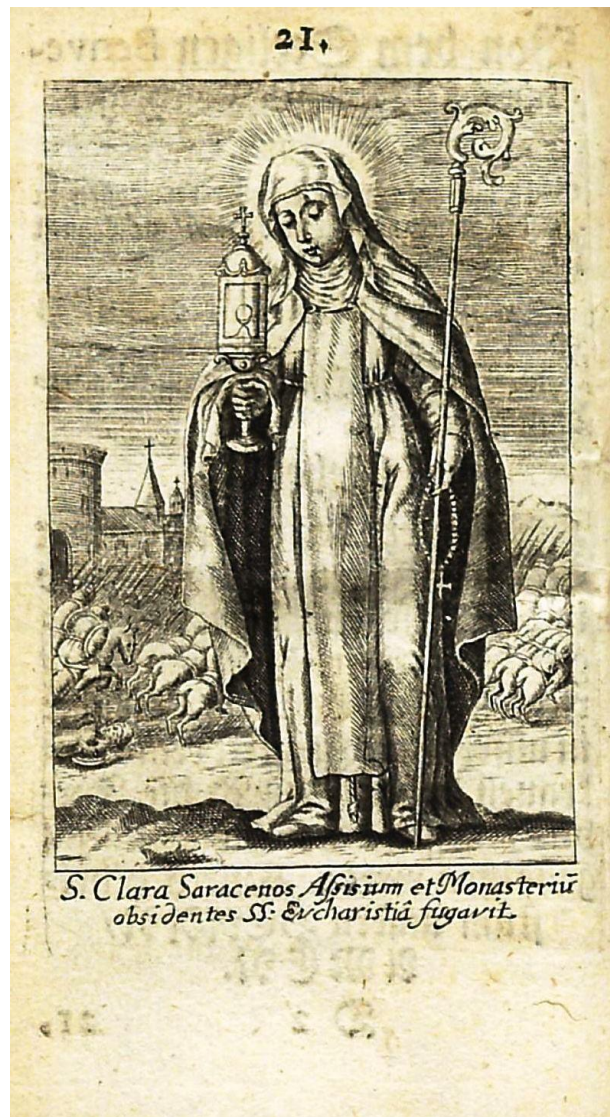
Obr. č. 5, svatá Klára v tisku Blumen und Früchte deß Seraphischen Gartens