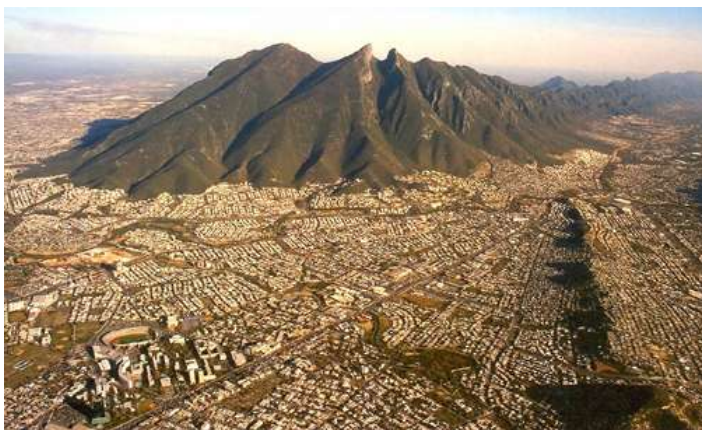
Obrázek 2: Monterrey

Monterrey vzniklo na úpatí pohoří Sierra Madre doposud obývaném indiánskými kmeny. Svou tradici zde má kaktus Peyotl obsahující halucinogenní psychotropní látku meskalin. Kaktusový nápoj využívali šamani