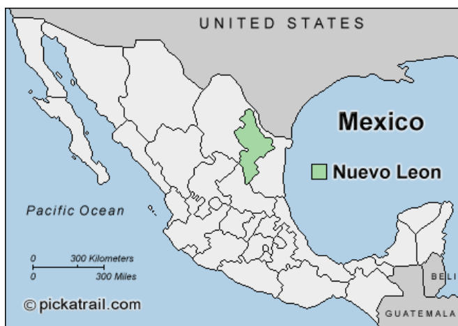
Obrázek 1: Stát Nuevo León, jehož hlavním městem je Monterrey

Výzkum probíhal ve městě Monterrey. Jedná se o hlavní město státu Nuevo León a společně s metropolitními oblastmi zde žije přes 4 miliony obyvatel, což z něho dělá třetí největší město Mexika. Monterrey bylo v posledních desetiletích známé jako industriální