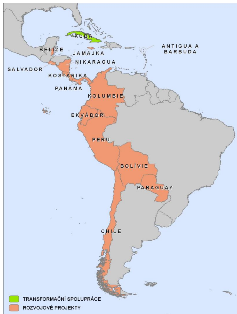
Obrázek č. 3 Státy Latinské Ameriky, ve kterých realizovány projekty české ZRS (zdroj geodat: MapAbility.com, upraveno dle autora)

Přehled všech projektů realizovaných Českou republikou v Latinské Americe včetně rozpočtu, realizátorů a období realizace viz příloha č. 3.