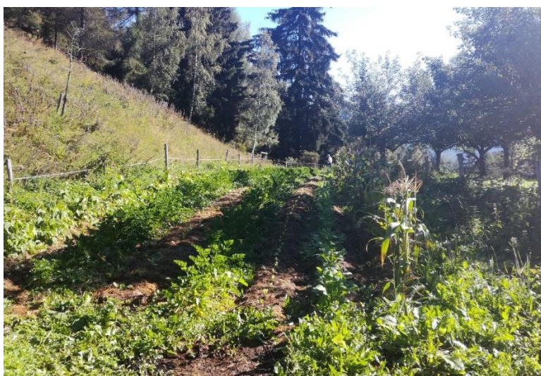
Obr. 12: Smíšená kultura salátu a kukuřice na Krameterhofu.

Holzer (2012) při pěstování obilí využívá některých druhů zeleniny (např. ředkvičky nebo listového salátu) jako podsevu, a tedy část vegetačního období je pěstuje spolu s obilím jako smíšenou kulturu. Vysévá je až po kvetení obilí. Dokud se obilí nesklidí, tak podsev roste pouze omezeně, ale jakmile dostane rostoucí meziplodina dostatek světla, tak rychle obráží (Holzer 2012).