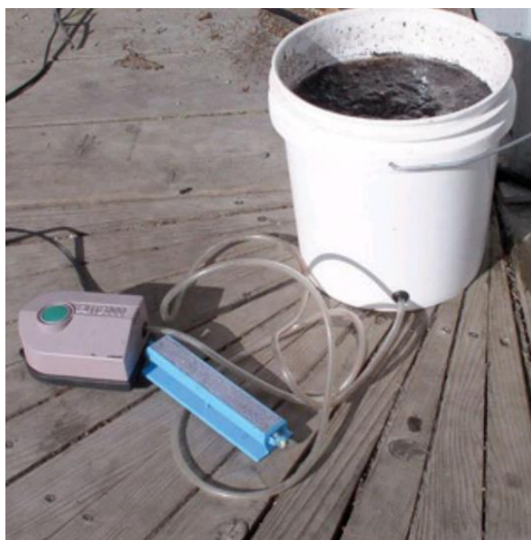
Obr. 4: Nádoba na výrobu ACT včetně pumpy pro zásobení směsi vzduchem.

Poměr kompostu ku vodě při výrobě preparátu se mezi studii liší, avšak zpravidla bývá používán poměr v rozptylu od 1:3 až 1:10 (Scheuerell & Mahaffee 2002). Při výrobě NCT se směs zpravidla fermentuje po dobu 5 až 8 (či až 16) dní, aby došlo k dostatečné akumulaci metabolitů fakultativních anaerobů (Scheuerell & Mahaffee 2002). Na druhou stranu však byly publikovány i výsledky, ze kterých vyplývá, že maximální inhibiční účinek plísňe révové ( Plasmopara viticola ) na listech révy vinné ( Vitis vinifera ) byl pozorován po aplikaci čaje po tří denní fermentaci (Ketterer 1990 in Scheuerell & Mahaffee 2002). Autoři rešerše se domnívají, že možná bude nutné stanovit optimální dobu fermentace pro každý systém rostlina-patogen-kompost (Scheuerell & Mahaffee 2002). Ingham (2005) píše k výrobě ACT, že doba výroby jednak závisí na dostatečném namnožení mikroorganismů, jednak také na vytváření nežádoucího biofilmu anaerobních organismů na okrajích nádoby, ke kterému dochází při delší výrobě. Zpravidla tak Ingham (2005) doporučuje délku výroby 20 až 36 hodin pro ACT.