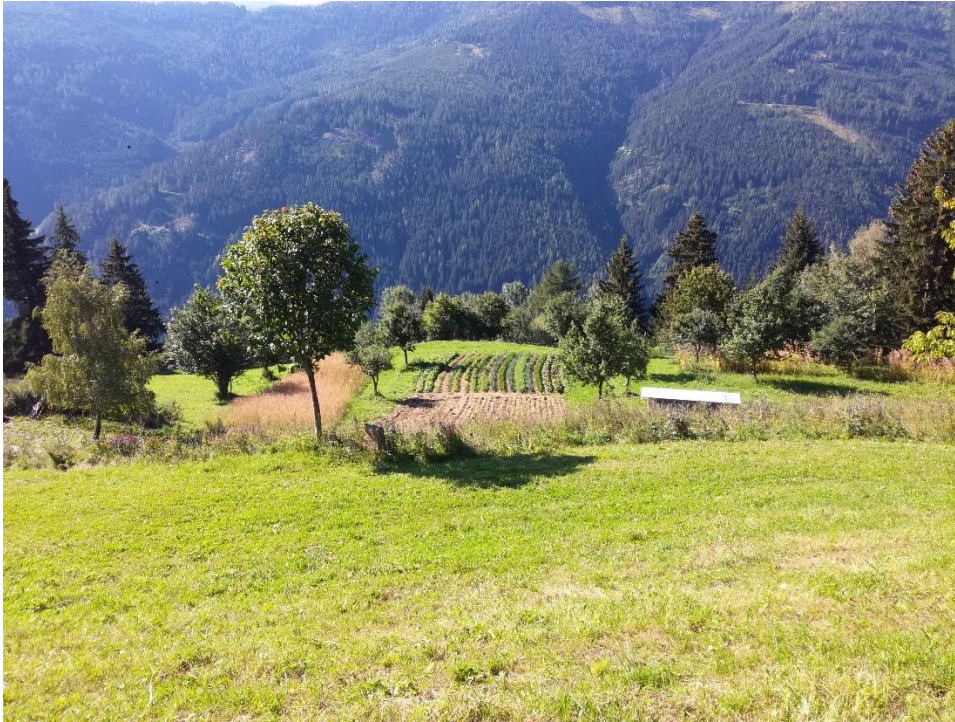
Obr: 1: Pastviny a políčka zeleniny na Krameterhofu (fotografie autora).

Pro stavby na svých pozemcích využívá Holzer (2019) zejména přírodních materiálů, především dřevo. Při pěstování se snaží využívat lokální odrůdy, které byly vyšlechtěny do právě takových půdně klimatických podmínek, kde budou pěstovány (Holzer 2019). Mezi důležité principy patří také využívání lokálních a obnovitelných zdrojů materiálů a energie (Holzer 2012).