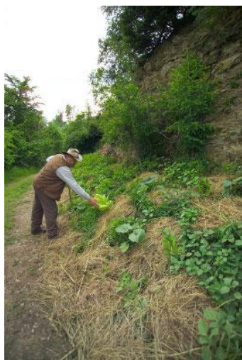
Obr. 11: Sepp Holzer u vyvýšeného záhonu, který je pokryt mulčem (Holzer 2012).

bohatá na živiny, a tak Holzer (2012) doporučuje pěstovat v tomto období především rostliny náročné na živiny. Uvádí např. tykev obecnou ( Cucurbita pepo ), cuketu ( Cucurbita pepo var. giromontina ) nebo slunečnici roční ( Helianthus annuus ) (Holzer 2012). Chalker-Scott (2022) se domnívá, že rozkládající se organická hmota by mohla uvolňovat příliš mnoho živin, které by v případě nezužitkování rostlinami mohly kontaminovat podzemní vodu. Podobně Sartoriusová (1997) varuje před pěstováním rostlin, které mají tendenci ukládat do svých pletiv vyšší koncentraci dusičnanů, v několika prvních letech.