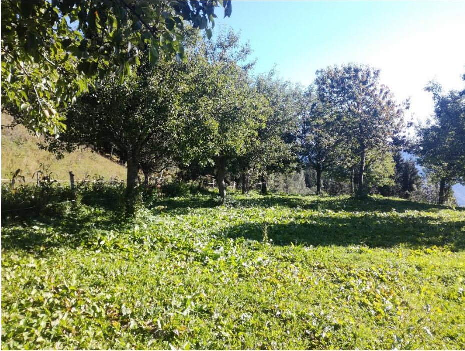
Obr. 6: Sad kombinovaný s pastevní plochou na Krameterhofu.