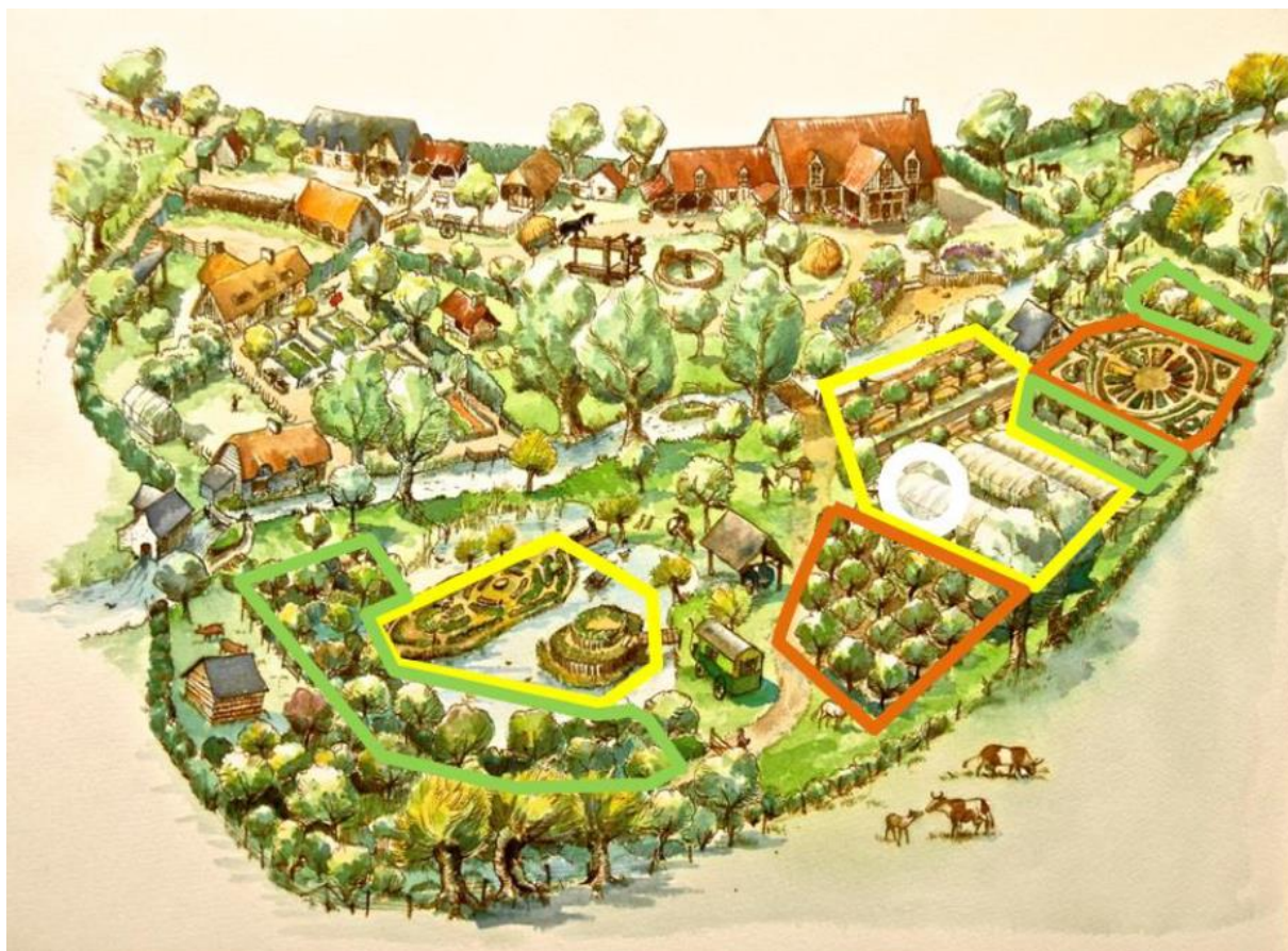
Obr. 5: Zónování na statku Bec Hellouin (Guégan & Léger 2015).

Zóna 0 (vyznačena bílým kroužkem): dílna ve skleníku, který se nachází uprostřed kultivovaných ploch. Odehrávají se zde pracovní porady a také je zde připravována zelenina k prodeji.