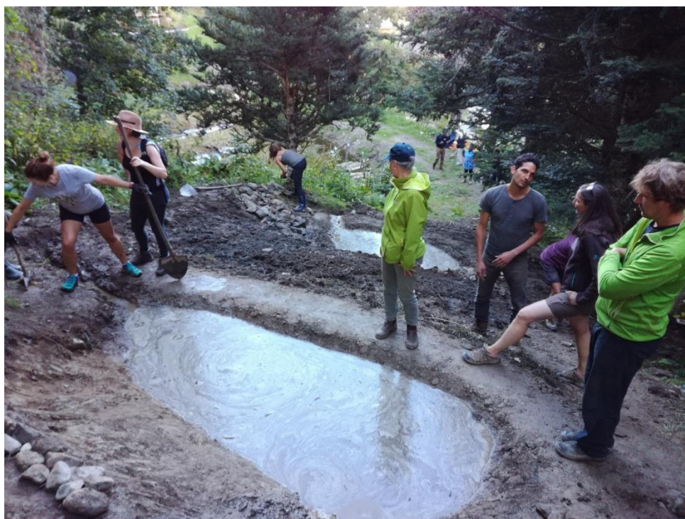
Obr. 8: Budování maličkých zkušebních přírodních retenčních jezírek v rámci semináře permakultury.