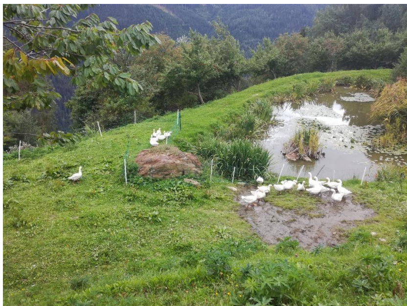
Obr. 9: Husy na venkovní pastvě s přístupem k jezírku na Krameterhofu.