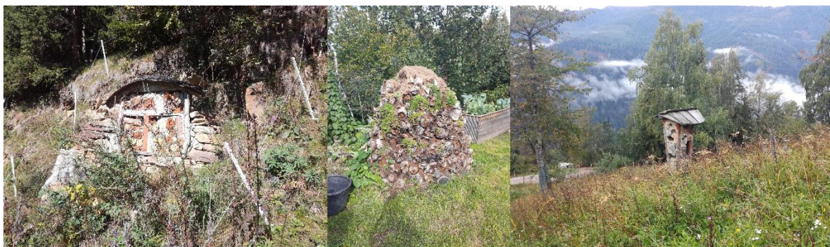
Obr. 7: Hmyzí hotely na Krameterhofu a Holzer Hofu.