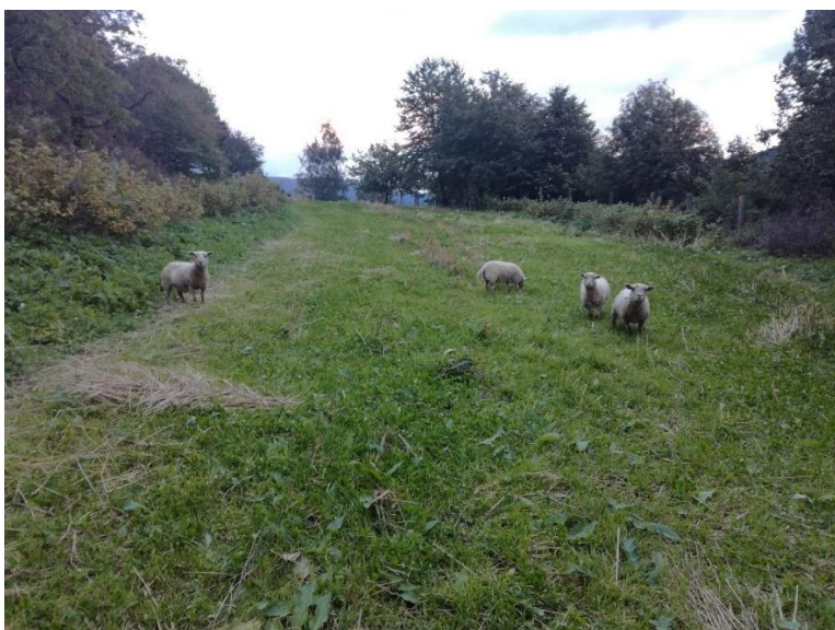
Obr. 10: Ovce na pastvě na poli na Krameterhofu, kde se nachází podsev jetele a roztroušená sláma.

Podsev jetele plazivého ( Trifolium repens ) plní v agroekosystémech vícero funkcí. Obohacuje půdu biologickou fixací o dusík (Kumar & Goh 2000). Podle Fukuoky (1985) jetel v poli rýže seté potlačuje růst plevelů, neboť vyplňuje volné plochy, čímž se klíčícím plevelům dostává méně světla. Holzer (2019) doplňuje, že pokryv jetele také chrání půdu před nepříznivými vlivy. Podsévat ještě před sklizní je podle Holzera (2012) vhodné při pěstování různých obilnin, včetně i např. pohanky seté ( Fagopyrum esculentum ).