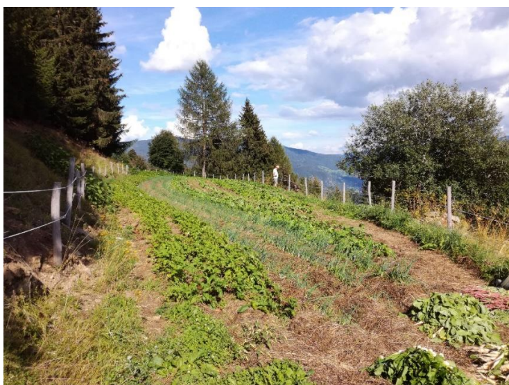
Obr. 3: Hojně mulčované řádky cibule a ředkviček na Krameterhofu.

Výběr mulčovacího materiálu může být ovšem i vhodně uzpůsoben pěstované plodině. El Dessougi et al. (2003) zjistili, že kukuřice setá ( Zea mays ) více prosperovala, pokud se ponechaly na pěstební ploše rostlinné zbytky z brukve řepky ( Brassica napus ssp. napus ) nebo řepy obecné ( Beta vulgaris ) oproti např. rostlinným zbytkům lupiny bílé ( Lupinus albus ). Podle autorů lze lepší růst kukuřice vysvětlit větší dostupností fosforu v půdě při zakomponování vhodných rostlinných zbytků (El Dessougi et al. 2003). Podle Holzera (2012) je potřeba navršit na půdu pouze takové množství čerstvého materiálu, aby se do půdy dostával dostatek vzduchu. U suchého materiálu jako je sláma je možno použít i vrstvu 20 cm (Holzer 2012).