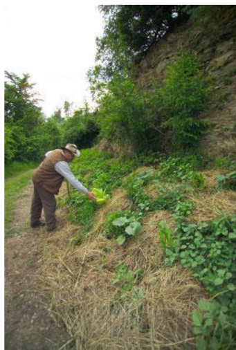
Obr. 11: Sepp Holzer u vyvýšeného záhonu, který je pokryt mulčem (Holzer 2012).

bohatá na živiny, a tak Holzer (2012) doporučuje pěstovat v tomto období především rostliny náročné na živiny. Uvádí např. tykev obecnou ( Cucurbita pepo ), cuketu ( Cucurbita pepo var. giromontina ) nebo slunečnici roční ( Helianthus annuus ) (Holzer 2012). Chalker-Scott (2022) se domnívá, že rozkládající se organická hmota by mohla uvolňovat příliš mnoho živin, které by v případě nezužitkování rostlinami mohly kontaminovat podzemní vodu. Podobně Sartoriusová (1997) varuje před pěstováním rostlin, které mají tendenci ukládat do svých pletiv vyšší koncentraci dusičnanů, v několika prvních letech.