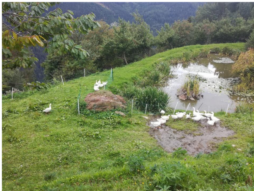
Obr. 9: Husy na venkovní pastvě s přístupem k jezírku na Krameterhofu.