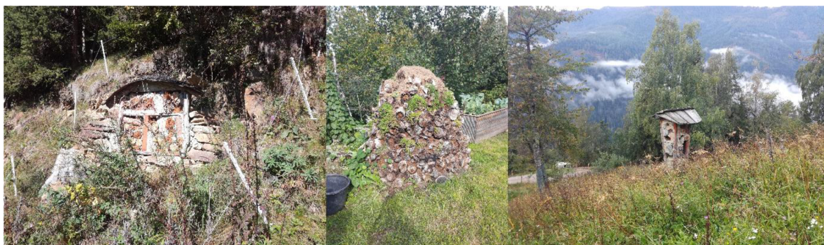
Obr. 7: Hmyzí hotely na Krameterhofu a Holzer Hofu.