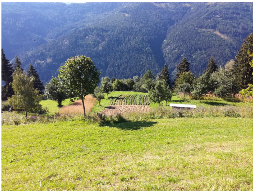
Obr: 1: Pastviny a políčka zeleniny na Krameterhofu.

Pro stavby na svých pozemcích využívá Holzer (2019) zejména přírodních materiálů, především dřevo. Při pěstování se snaží využívat lokální odrůdy, které byly vyšlechtěny do právě takových půdně klimatických podmínek, kde budou pěstovány (Holzer 2019). Mezi důležité principy patří také využívání lokálních a obnovitelných zdrojů materiálů a energie (Holzer 2012).