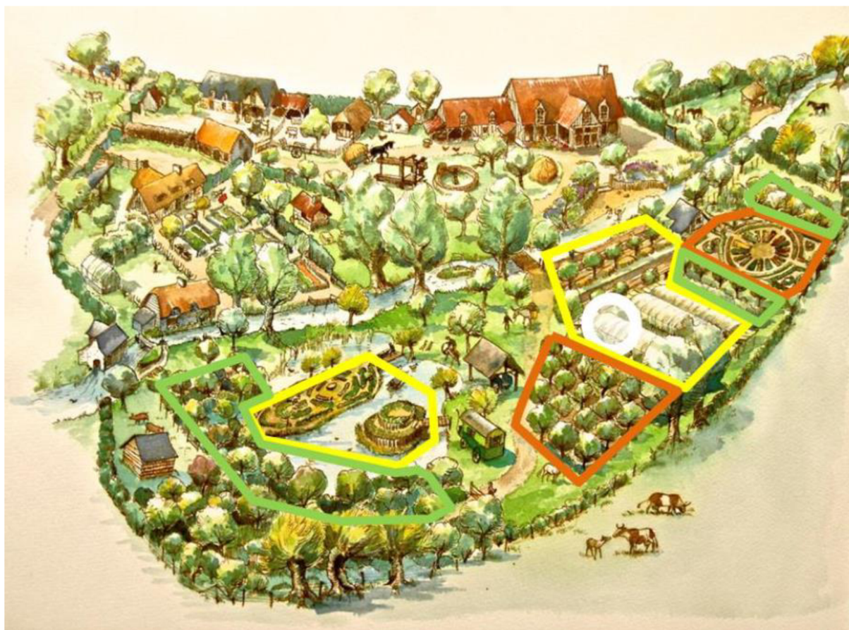
Obr. 5: Zónování na statku Bec Hellouin (Guégan & Léger 2015).

Zóna 0 (vyznačena bílý kroužkem): dílna ve skleníku, který se nachází uprostřed kultivovaných ploch. Odehrávají se zde pracovní porady a také je zde připravována zelenina k prodeji.