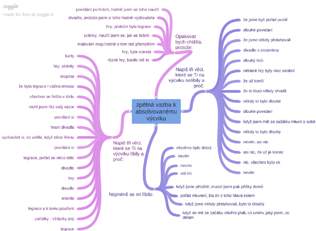
Obrázek č. 4: Mapa zpětné vazby