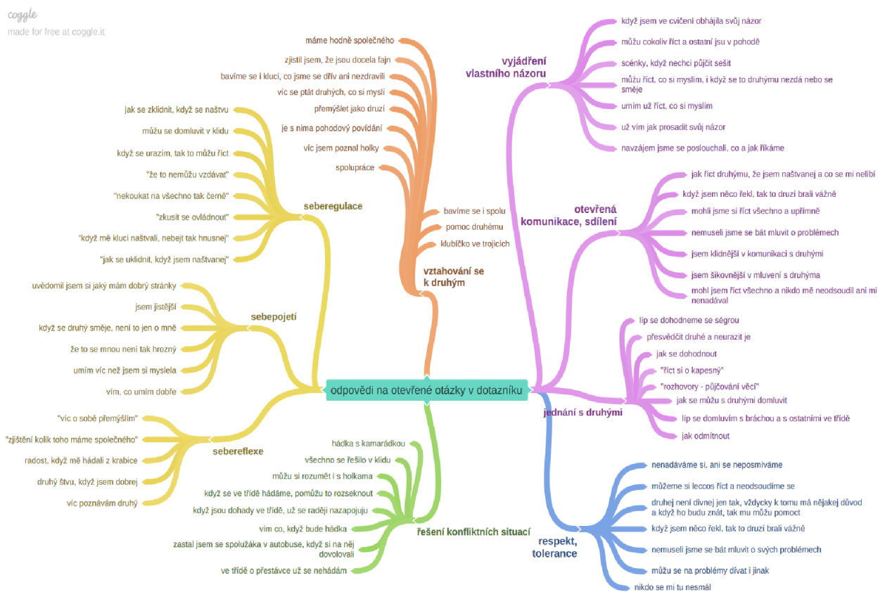
Obrázek č. 3: Mapa odpovědí na otevřené otázky dotazníku

Odpovědi vyjadřující pozitivní posun v analýze odpovědí na otevřené otázky dotazníku a jsou zastoupeny u sledované oblasti alespoň 5krát se týkají oblasti a) sebepojětí , b) řešení konfliktů , c) vyjádření vlastního názoru a d) otevřená komunikace .