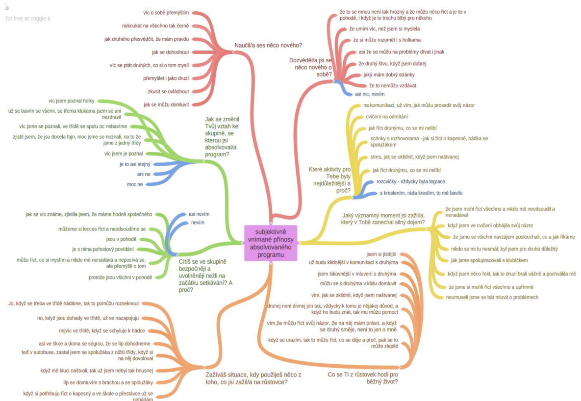
Obrázek č. 2: Mapa subjektivně vnímaného přínosu programu

Takto sestavený a absolvovaný program byl celkově třemi žáky označen jako velmi významný , za významný jej považují tři žáci a za středně významný dva žáci. Na pětistupňové škále od 1 – 5, kdy 1 = velmi významný program a 5 = naprosto bezvýznamný program , by se tak program díky vyjádřením žáků pohyboval v průměru na hodnotě 1,875.