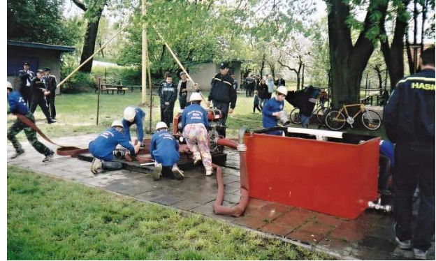
Obr. č. 13. Putovní pohár Obce Závěšice 2007