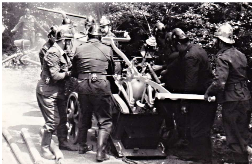
Obr. č. 9. Soutěž 1977