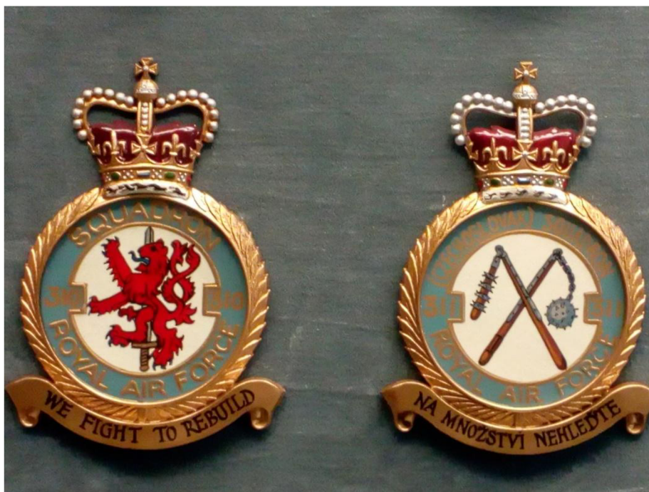
Obrázek 1: Odznak 310. čs. stíhací perutě a odznak 311. čs. bombardovací perutě