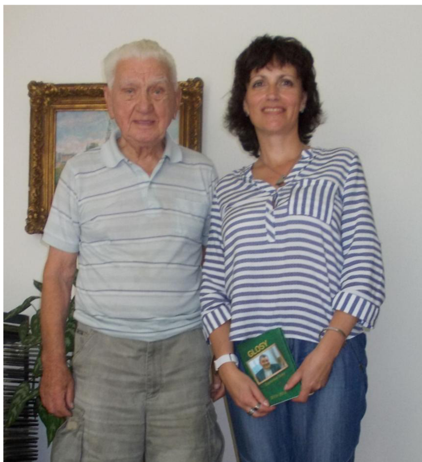
Obrázek 11: Setkání autorky s generálem Bočkem 30. července 2017 v Brně

Rozhovor s panem generálem Bočkem byl nesmírně zajímavý a poutavý. Za těch několik hodin shrnul podstatnou část svého života od roku 1939 až po současnost. Jak několikrát podotknul, nemá na nic čas a často někam jezdí. Zúčastňuje se mnoha armádních akcí nebo pietních vzpomínek. Autorce diplomové práce poskytl k vyfotografování několik osobních dokumentů a fotografií, které směla s jeho laskavým svolením použít v této diplomové práci.