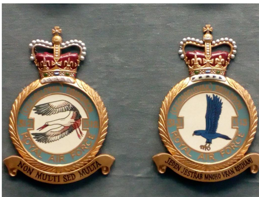
Obrázek 2: Odznak 312. čs. stíhací perutě a odznak 313. čs. stíhací perutě