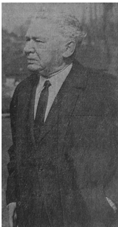
Obrázek 3: Generál Karel Janoušek v roce 1968