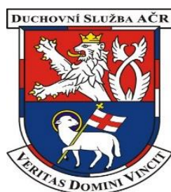
Oficiální znak duchovní služby